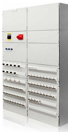
Kuva 1. Kehikkorunkoinenkeskus (POK, 2024).

Kehikkorunkoon toteutettu sähkökeskus on kehikko, jossa on sivu seinät sekä pohjalevy, mikäli keskuksen takana oleva seinä on rakennettu materiaalista, joka ei ole paloturvallinen (Salminen, 2018). Keskuksen komponentit ovat asennettuna kiskoihin keskuksen. Kehikkorunkoiset keskukset sijoitetaan kuivaan tilaan, jonne pääsy on vain opastetuilla henkilöillä, tai vaihtoehtoisesti asennetaan lukittava ovi, joka peittää komponentit. Kehikkorunkoista keskusta voidaan käyttää pää-, mittaus- tai jakokeskuksena. Tyypillisesti maksimi nimellisvirta on 630 ampeeria. Kuvassa 1 esimerkkinä POK:n valmistama kehikkorunkoinen keskus.