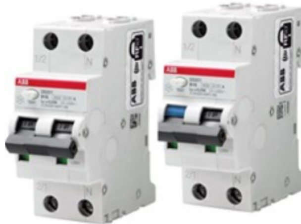
Kuva 7. ABB:n Johdon- ja vikavirtasuojan yhdistelmä (ABB, 2024).