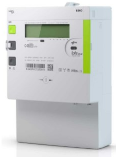
Kuva 5. Landis+Gyr E360 energiamittari (Landis+Gyr, 2024).

Uusilla mittareilla on mahdollista päästä sähkömarkkinalain edellyttämän vartin mittaustiheyteen (Vaasan Sähköverkko, 2024). Kuvassa 5 Landis+Gyr:n etäluettava energiamittari.