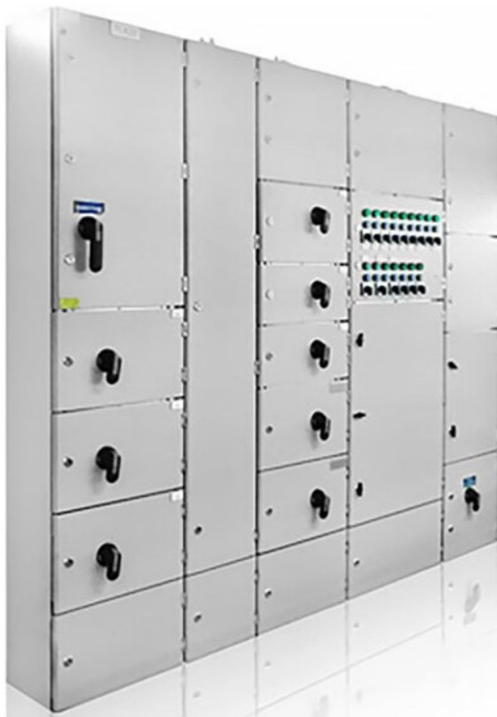
Kuva 3. Kotelokeskus (POK, 2024).

Koteloitua runkoa voidaan käyttää useammassa ja haastavammassa paikassa kuin kevyttä kehikkorunkoistakeskusta. Kotelokeskukset voivat sijaita likaisissa ympäristöissä kuten tehtaissa tai ulkotiloissa. Ulkoasennuksiin lisätään usein sadelippa estämään vedenpääsyä keskukseen sisälle. Koteloiduissa keskuksissa tulee myös ottaa huomioon, että kaapeleiden läpivienteihin tulee käyttää päätylaippoja. Laipoissa tulee olla riittävä IP-luokitus ja riittävä määrä läpivientejä. Kuvassa 3 esimerkkinä POK:n valmistama kotelokeskus.