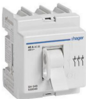
Kuva 4. Hager 40A Pääkytkin (Ahsell verkkokauppa, 2024).

Sähkökeskuksen pääkytkimen tehtävänä on toimia kytkimenä, jolla saadaan tehtyä keskus jännitteettömäksi kääntämällä se auki asentoon (Leskinen, 2018). Esimerkiksi omakotitalojen keskuksissa on vain yksi katkaisija ja se on pääkatkaisija. Se mitoitetaan keskuksen nimellisvirran mukaan. Katkaisijalla erotetaan keskus jakeluverkosta, tai muusta sähkön syötöstä. Kuvassa 4 esimerkkinä pääkytkimestä Hager merkin 40A kolmenapainen pääkytkin, mikä on asennettavissa sähkökeskuksen DIN-kiskoon.