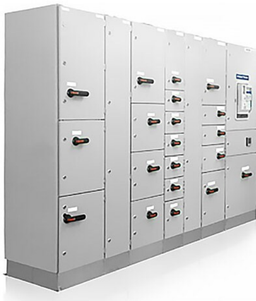
Kuva 2. Kennokeskus (POK, 2024).

Kennokeskuksissa on tavallista, että suurivirtaisille lähdöille käytetään kaapelikuilua. Kuilun etuna on, että isoille tuleville kaapeleille jää enemmän kytkentätilaa. Sinne ei yleensä asenneta kojeita eikä liittimiä, mutta nolla- ja maadoituskiskot voidaan tarvittaessa sijoittaa kaapeli kuiluun. Kuvassa 2 mallina POK:n valmistama kennokeskus.