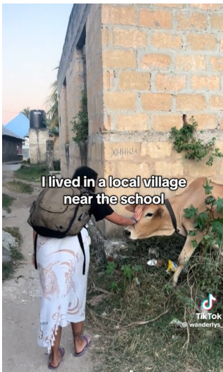
Kuva 5. Vapaaehtoisturisti silittää lehmää itselleen vieraassa ympäristössä. Video E5. (TikTok.com, 20.9.2025.)

Videossa E5 (20.9.2025) vapaaehtoinen silittää vapaana kulkevaa lehmää. Kohtaus muodostaa visuaalisen asetelman eksotoinnista. Videossa E5 (20.9.2025) korostetaan toiseuden kokemusta, jossa vapaaehtoinen kuvaa itselleen vierasta ympäristöä, joka on osa vapaaehtoisen kokemaa seikkailua. Lehmä ja taustalla oleva talo luovat mielikuvaa autenttisuudesta ja yksinkertaistaa globaalin etelän asuinympäristöä, mikä on havainnollistettu kuvassa 6.