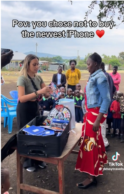
Kuva 2. Vapaaehtoisturisti jakamassa koulutarvikkeita. Video B2. (TikTok.com, 22.10.2024).

Videossa B2 (22.10.2024) esitetään kielellinen ilmaisu, jossa vapaaehtoinen esitetään aktiivisena toimijana ja paikalliset asukkaat passiivisina. Esimerkissä (2) käy ilmi kielellinen ilmaisu, jossa vapaaehtoisturisti on jättänyt ostamatta kalliin puhelimen ja matkustanut säästelyillä rahoilla globaaliin etelään auttamaan paikallisia. Esimerkki (2) esittää vapaaehtoisturistin hyväntahtoisena ja empaattisena henkilönä. Paikalliset ihmiset ilmentävät köyhyyttä ja lasten huomio vapaaehtoiselle toimii kiitollisuuden välineenä, mikä käy ilmi kuvasta 3.