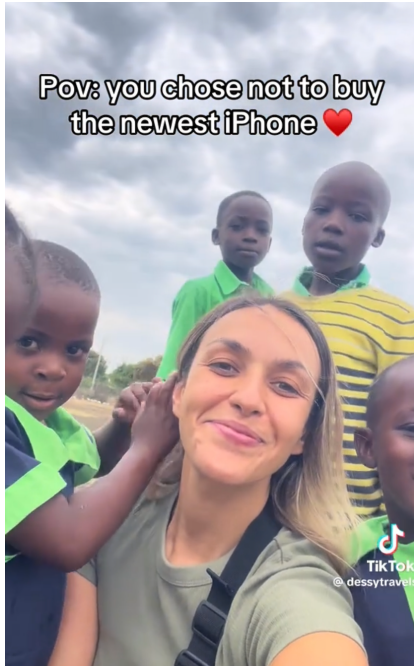
Kuva 3. Vapaaehtoisturisti lasten kesellä. Video C3.