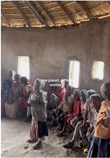
Kuva 4. Paikallisia lapsia savimajassa. Video C3.

kuvaa paikallisten elämästä. Lapset esitetään homogeenisenä ja avuntarpeessa olevana joukkona. Kuvaustapa voi korostaa vapaaehtoisen asemaa, josta hän voi kokea merkityksellisyyttä.