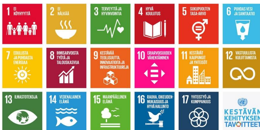
Kuva 1. YK:n 17 tavoitetta (Suomen kestävän kehityksen toimikunta, n.d).

Kesäkuussa 2023 julkaistun puoliväliarvion mukaan yksikään Agenda 2030 :n seitsemästätoista päätavoitteesta ei nykyisellä vauhdilla tule toteutumaan, ja alatavoitteista vain noin viidesosa saavutetaan maailmanlaajuisesti määräaikaan mennessä. Vuodet 2015–2019 toivat edistystä muun muassa äärimmäisen köyhyyden, lapsikuolleisuuden sekä puhtaan veden ja sähkön saatavuudessa. Pandemiat ja muut kriisit hidastivat tavoitteita erityisesti matalatuloisissa maissa. Tavoitteet ovat edelleen saavutettavissa, mikäli kehitysrahoitusta nostetaan merkittävästi vuoteen 2025 mennessä. (Ulkoministeriö, n.d.)