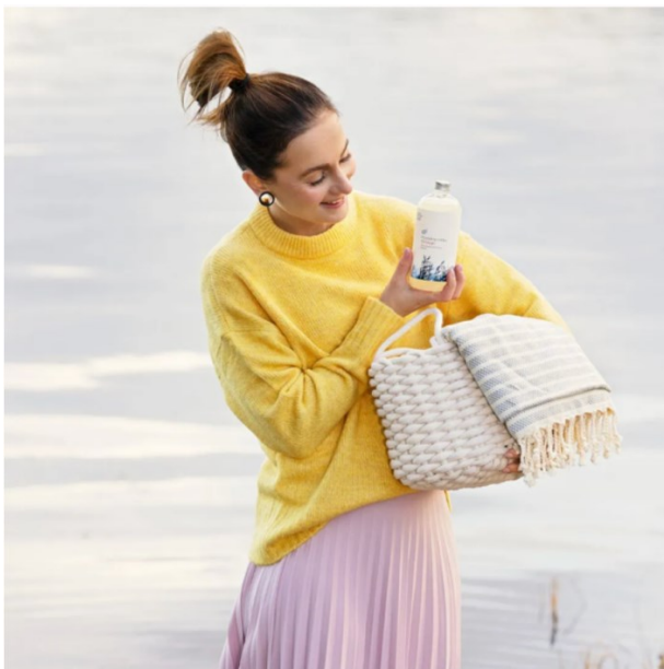
Kuva 2. Esimerkki Saaren Taian tekstien oletusyleisöstä. (A42)

Naisoletusta vahvistaa taas erityisesti se, että monissa brändin tuotekuvissa esiintyy naisilta näyttäviä henkilöitä (katso kuva 2). Kuvassa 2 naiselta näyttävä henkilö poseeraa veden äärellä brändin pyykkietikkapullo kädessään.