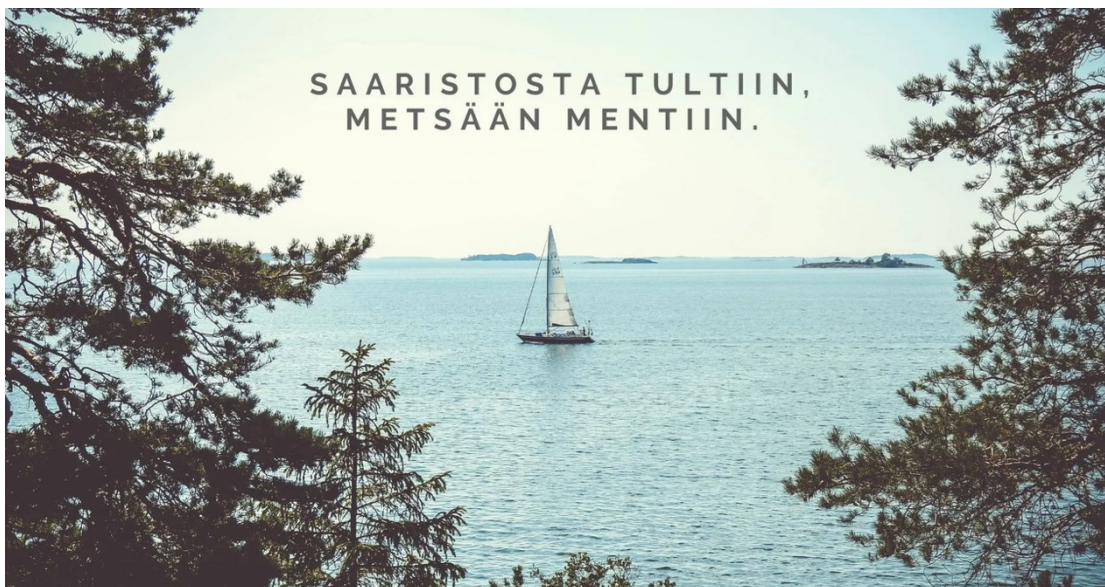
Kuva 7. Kuva, jossa myönnetään viestinnässä epäonnistuminen. (A21)

Myös esimerkiksi kuvassa 7 viitataan somekohuun liittyvään anteeksipyyntöön.