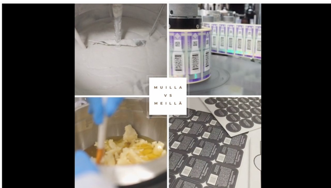
Kuva 6. Kuvankaappaus videosta, jossa ilmenee brändin toimintatapoja. (A25)

Aineistossa olevissa videoissa ja kuvissa korostuu myös Suomessa sekä yleisesti ihmisten työllistäminen (katso kuva 6).