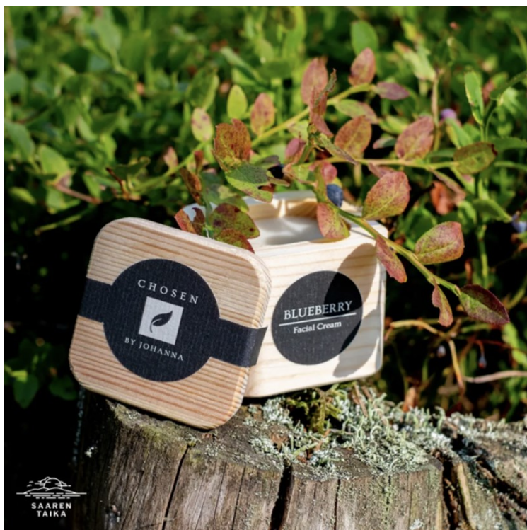
Kuva 5. Kuva tuotteesta, joka on sen sisältämän raaka-aineen läheisyydessä. (A34)

Esimerkiksi kuvassa 5 tuodaan esille luonnosta saatavien raaka-aineiden hyödyntäminen tuotteiden valmistuksessa.