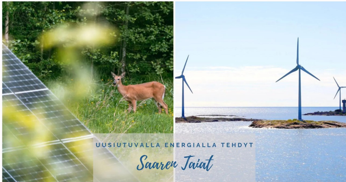
Kuva 4. Esimerkki kuvasta, jossa näkyy uusiutuvan energian lähteitä. (A14)

Kuvan 4 oikealla puolella näkyy Saaren Taian omia aurinkopaneeleja, minkä avulla konkretisoidaan brändin omaa sähköntuotantoa. Aurinkopaneelien takana näkyy lisäksi Kauuris ja koivumetsää, mikä korostaa luonnon läsnäoloa. Oikealla puolella näkyy taas kari-koilla olevia tuulimyllyjä, joilla pyritään todennäköisesti tuomaan ilmi uusiutuvan energian hyödyntämistä. Kuvassa lisäksi lukee ”uusiutuvalla energialla tehdyt Saaren Taiat”, jolla leikkisästi hyödynnetään brändin nimeä siten, että sillä viitataan tuotteiden valmistukseen, joka tapahtuu kuvan perusteella aurinkovoimalla ja tuulivoimalla. Kuvalla havainnollistetaan loogisesti ja konkreettisesti uusiutuvan energian käyttöä, mikä taas representoi Saaren Taian ympäristöllisesti vastuullisuutta valmistusta.