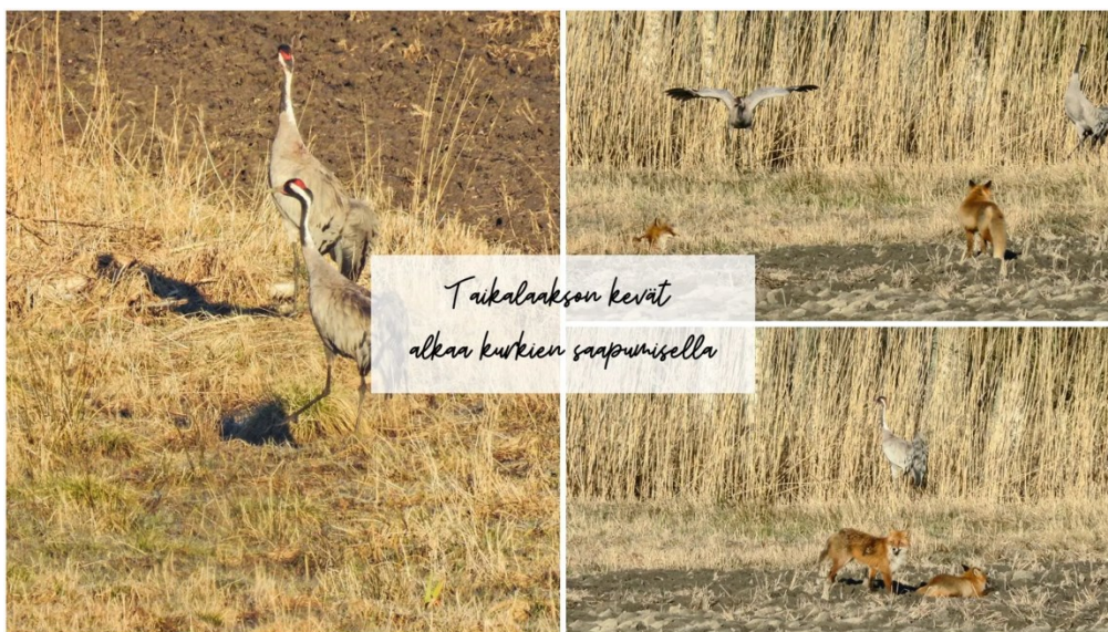
Kuva 1. Esimerkki kuvasta, jossa näkyy suomalaista luontoa. (A6)

Aineiston yhteiskunnalliseen kontekstiin liittyy keskeisesti myös brändin suomalaisuus. Tämä näkyy esimerkiksi aineistossa esiintyvissä kuvissa, joissa esitetään suomalaista luontoa (katso kuva 1).