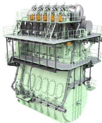
Kuva 5 MAN B&W 5G70ME-GI Mk10.5

Toinen uuden teknologian moottorityyppi on dieselmoottorin sykliä hyödyntävä korkeapaineinen kaasumoottori, jota edustaa esimerkiksi MAN Energy Solutionsin ME-GI-moottori. Tässä moottorissa kaasu ruiskutetaan suoraan sylinteriin korkealla paineella ja palaminen alkaa ilman erillistä sytytyslähdettä, kuten dieselmoottorissa. Tämä tekniikka mahdollistaa erittäin tarkan polttoaineen annostelun ja sopii erityisen hyvin suurille pitkän matkan aluksille, jotka vaativat maksimaalista tehokkuutta ja luotettavuutta, jopa kaasun ja dieselin seoksella käydessään (MAN Energy Solutions, n.d.).