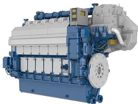
Kuva 4 Wärtsilä 6L34DF