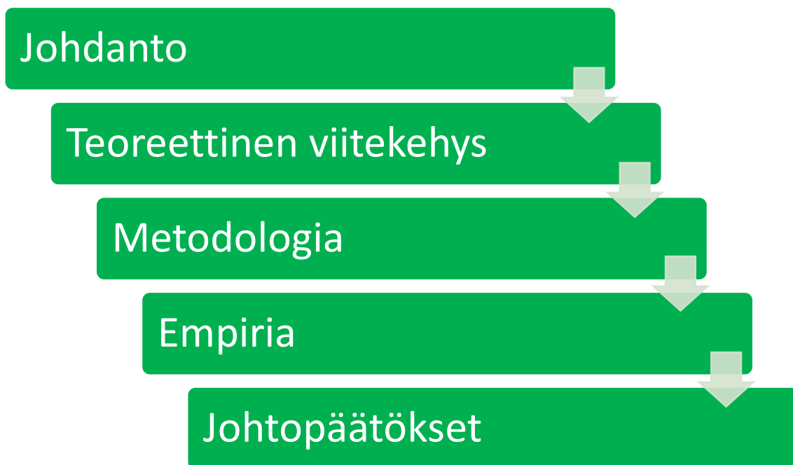
Kuvio 1 Tutkimuksen rakenne

Tämä pro gradu -tutkielma on jaettu viiteen pääluukuun. Ensimmäisessä pääluvussa on johdanto, jossa johdatetaan lukija aiheeseen ja perustellaan tutkimuksen tarve sekä tutkimusaukkoa perustuen aiempaan kirjallisuuteen. Ensimmäisessä pääluvussa määritellään tutkimuksen tarkoitus ja tavoitteet. Johdannossa myös tarkastellaan tutkimusotetta ja tuodaan esille valitut tutkimusmenetelmät. Tutkimuksen rakenne esitellään kuviona, joka on kuvattuna kuviossa 1.