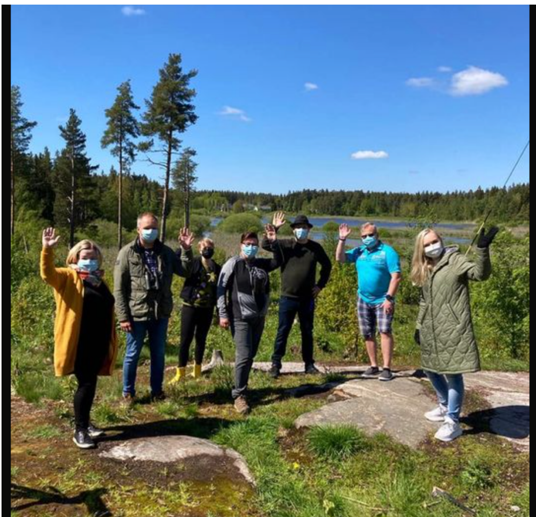
Kuva 8. Johtaja yksi muista (Ohisalo, 29.5.2021).

Retorisia populistisia elementtejä hyödynsi myös Ohisalo, kuten esimerkkikuvasta (8.) on havaittavissa. Ohisalo on kuvattuna luonnossa kallioisella paikalla kuuden muun ihmisen kanssa. Kaikilla kuvan henkilöillä on yhtenevä vaatetus ja asento. Kuvassa paistaa aurinko, mutta henkilöillä on takkeja ja pitkiä housuja yllään, vain yksi kuvan henkilöistä on pukeutunut lyhyisiin housuihin ja lyhyt hihaiseen paitaan. He seisovat kameraan päin suuntautuen ja vilkuttavat yhdellä kädellä kameralle. Kaikilla on yllään maskit, mikä kertoo kuvan olevan otettu koronapandemian aikaan.