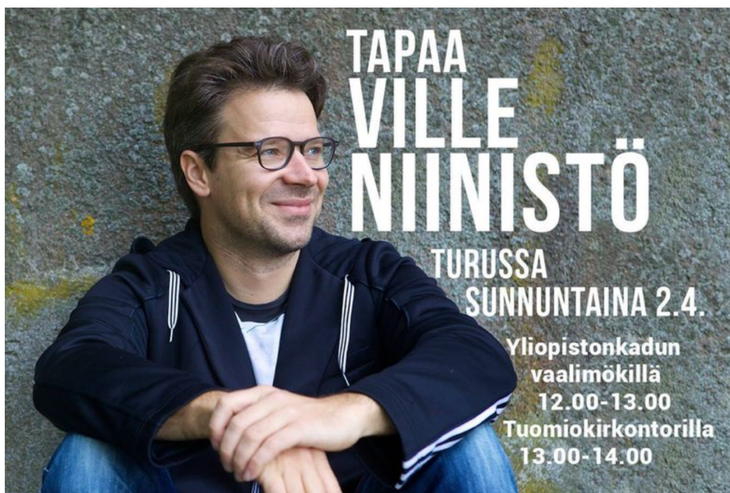
Kuva 2. Rento ja lähestyttävä johtaja (Niinistö, 31.3.2017).

Toinen esimerkki populistisen argumentin ajamisesta aineiston kuvissa ja videoissa on Niinistön 31.3.2017 julkaisema kuva (2.), jossa hän on itse kuvattuna istumassa selkä osittain sammaloitunutta kiviseinää vasten. Yllään Niinistöllä on farkut ja hupullinen kangastakki. Hän istuu rennosti nojaten käsiään kohotettuihin polviinsa. Hän katsoo sivulle ja hymyilee. Kuvassa Niinistö vaikuttaa rennolta ja lähestyttävältä. Niinistön olkavartta myötäilee teksti, joka kehottaa katsojan tulemaan tapaamaan Niinistöä jommallakummalla kahdesta eri paikasta Turussa.