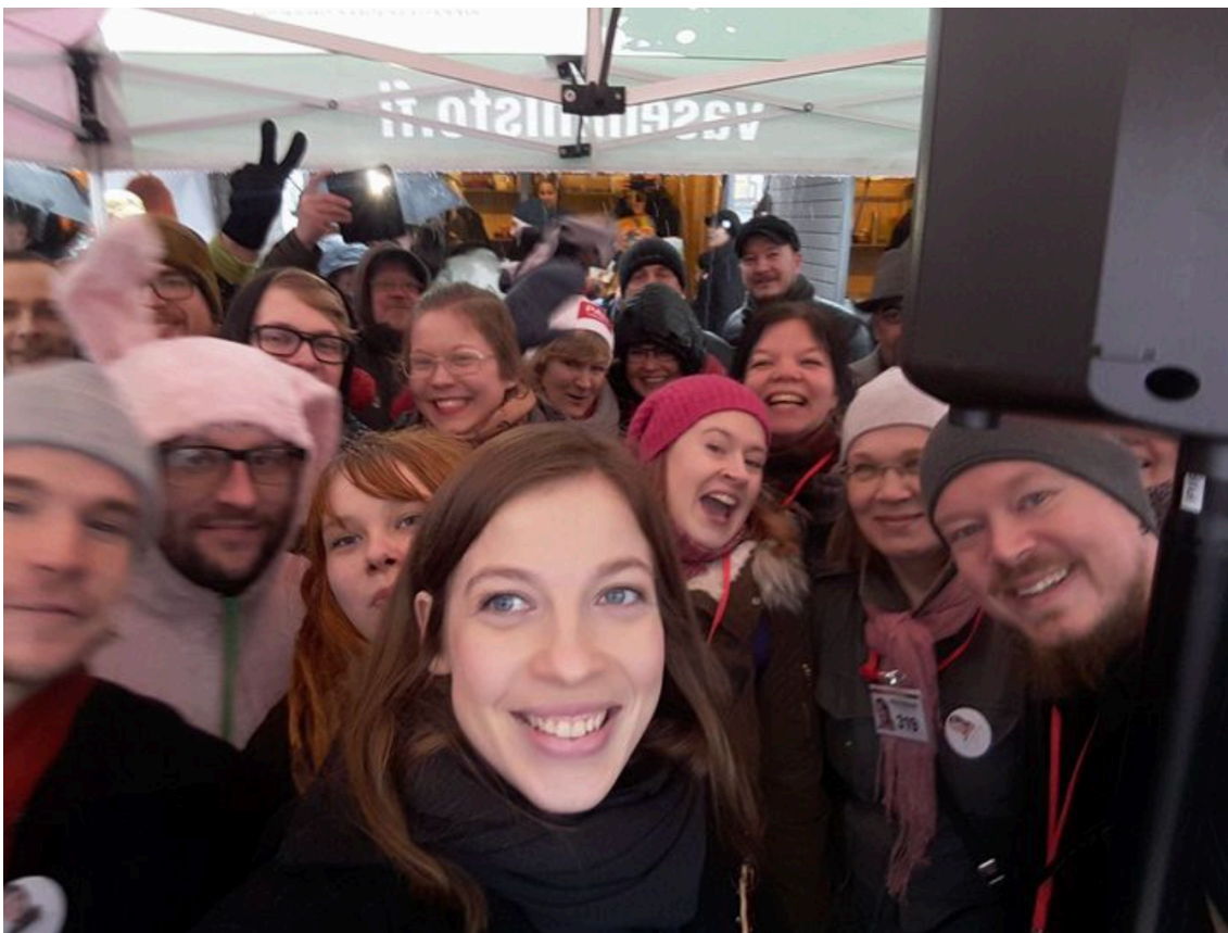
Kuva 4. Yhdessä olon riemu (Andersson, 1.4.2017).

Niinistö vetosi lukijan tunteisiin nostamalla ylös meidän lapsemme tekstissä. Samaa näkyi kuvissa, kuten Niinistön 8.4.2017 julkaisemassa vaalimainoksessa (kuva 5.). Tässä kuvassa Niinistö on kuvattuna luonnossa villapaita yllään yhdessä kolmen lapsen kanssa. Lapset ovat eri ikäisiä, mutta kuitenkin hyvin nuoria, enintään alakouluikäisiä. Niinistöllä ja yhdellä lapsista (lähimpänä Niinistöä) on katse oikealle, tulevaan. Oikeanpuoleisin lapsi katsoo Niinistöä, mutta osoittaa oikealle. Tämä luo vaikutelman, että lapsi kysyy Niinistöltä opastusta tulevan suhteen. Vasemmanpuoleisin lapsi on kaikista nuorin ja katsoo vasemmalle, kohti mainoksen kohtaa, jossa on esillä Niinistön äänestysnumero. Lapsen käsi on ojennettuna numeron suuntaan ja jää sen peittoon.