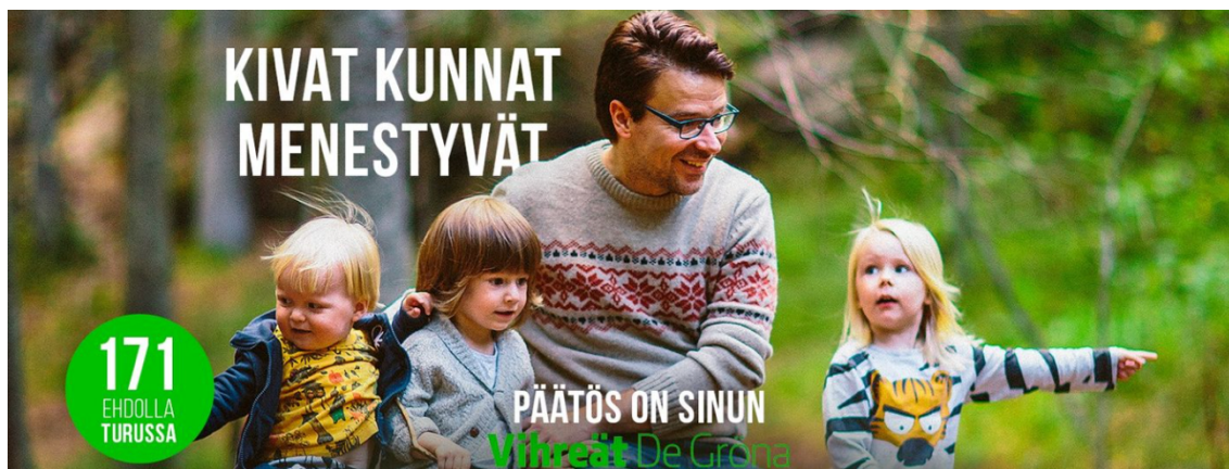
Kuva 5. Lapsiemme tulevaisuus (Niinistö, 8.4.2017).

Kuvalla (5.) Niinistö vahvistaa katsojan tunnetta siitä, että Niinistö välittää luonnosta, lapsista ja tulevaisuudesta. Kuvassa (5.) on tekstit Kivat kunnat menestyvät ja Päätös on sinun . Nämä tekstit luovat katsojalle tunteen, että saavuttaakseen iloisen tulevaisuuden, jota Niinistö lapsille kuvassa lupaa, tulee katsojan päättää äänestää vihreitä. Niinistö on se johtaja, joka takaa kansan lasten tulevaisuuden. Lapset edustavat kansan lapsia, ja tämä sitoo lukijan tunteet kuvaan. Kuvan lapset eivät ole Niinistön omia, vaan kuvaa varten valittuja esiintyjiä. Niinistö on johtaja, jolle kansan yhteiset lapset ovat tärkeä asia. Kuvassa kansaa luodaan emotionaalisesti juuri lasten kautta.