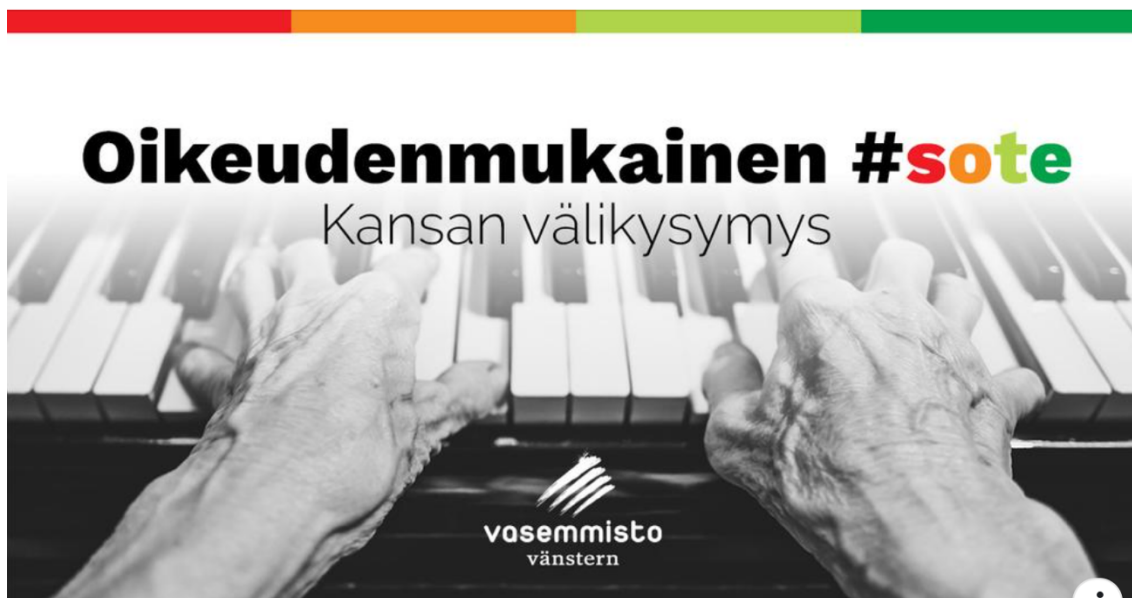
Kuva 7. Kansan kädet. (Andersson, 8.4.2017).

kuvattuna henkilöstä itsestään päin. Kädet ovat vanhuksen, mikä ilmenee niiden rypyisistä ihosta ja ulkonevista suonista. Kädet soittavat pianoa. Kuva on muuten mustavalkoisen sävyinen, mutta ylälaudassa on ohut värikäs viiva. Nämä samat värit toistuvat kuvaan sisälletyssä tekstissä sote . Muu kuvan teksti on mustavalkoissävyistä.