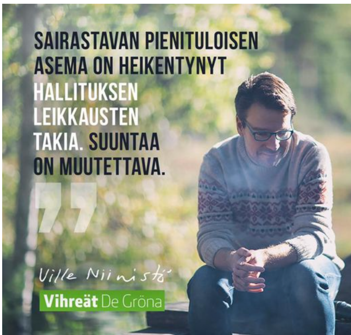
Kuva 12. Vaihtoehtoinen suunta (Niinistö, 6.4.2017).

Useissa aineiston kuvissa oli mukana tekstiä. Myös Niinistö on 6.4.2017 julkaisemassaan kuvassa (12.) liittänyt kuvaan tekstiä. Kuvan teksti on hänen oma sitaattinsa. Teksti on kuvassa vasemmalla ja Niinistö on kuvattuna kuvassa oikealla. Hän istuu puisella penkillä. Taustalla on kasvillisuutta ja kuva on otettu ulkona.