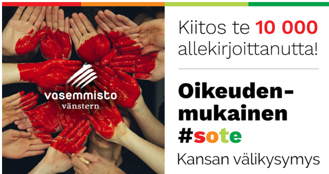
Kuva 9. Populistinen tarina (Andersson, 1.4.2017).

Kuva rakentaa populistista tarinaa niin visuaalisesti kuin tekstinkin kautta. Tekstissä kiitetään kymmentä tuhatta allekirjoittanutta . Tämä kertoo populistisesta tarinasta. Kansan välikysymyksen allekirjoittaneet nimetään kansaksi välikysymyksen otsikoinnissa. Nämä kymmenen tuhatta ihmistä ovat edustaneet kansaa allekirjoittamalla välikysymyksen. Visuaalisesti populistista tarinaa rakennetaan maalatulla kämmenillä. Se, että kuvanottohetkellä sydän ei ole valmis ja siihen liittyneitä käsiä maalataan edelleen, kertoo, että kansaan ja välikysymykseen liittyy edelleen lisää ihmisiä. Kansa ei siis rajoitu tuohon kymmeneen tuhanteen jo allekirjoittaneeseen. Kädet, luku ja teksti Kansan välikysymys koostavat kaikki yhdessä populistista tarinaa.