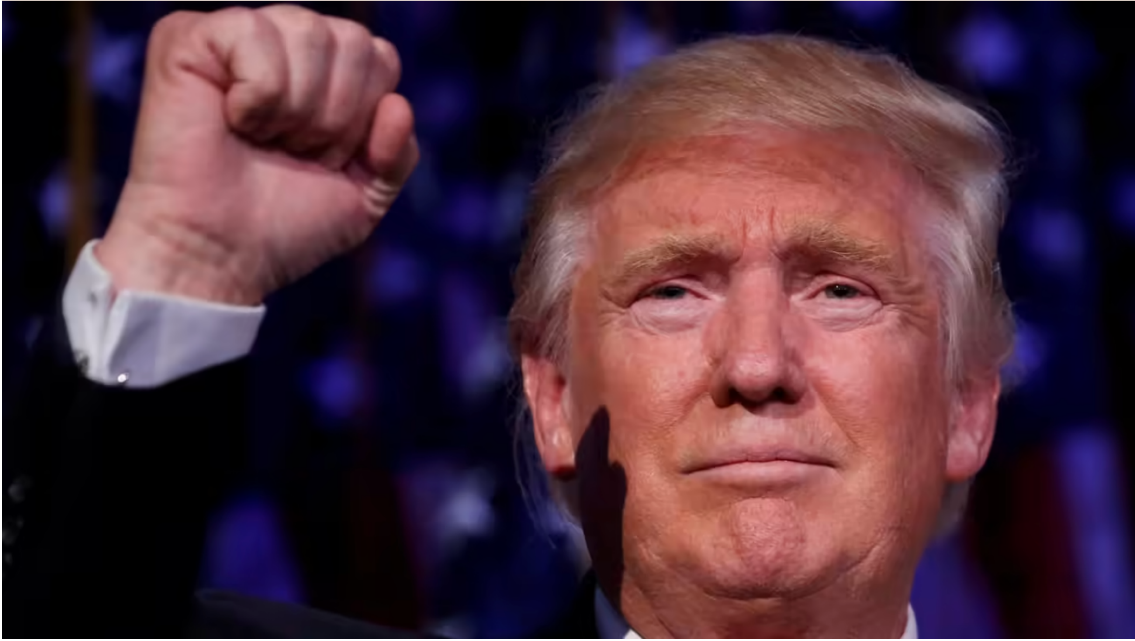
Kuva 13. Trumpin voitonjuhlinta (, 9.10.2016).