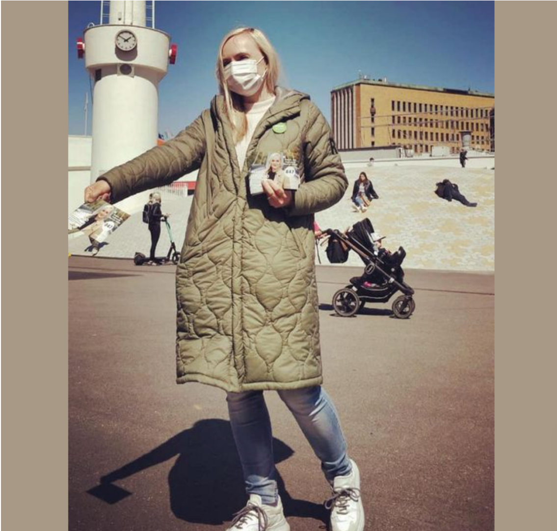
Kuva 3. Ei liian hieno tekemään katutason vaalityötä (Ohisalo, 30.5.2021).

Myös Ohisalo (kuva 3.) hyödyntää kuvissaan populistisen argumentin ajamista.