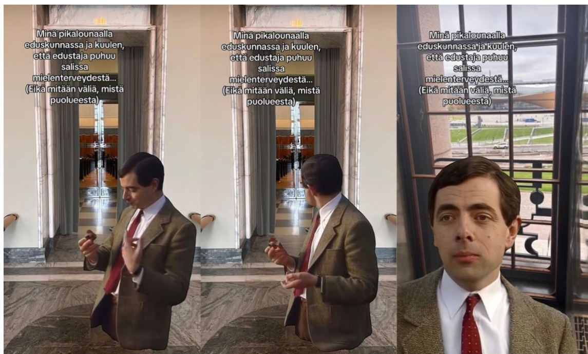
Kuva 6. Kuvakaappauksia videosta V9 (@terapeuttille, 11.11.2023).

Aineistossa popkulttuuriviittaukset näyttäytyvät erityisesti keinoina kehystää poliittisia tilanteita viihteellisempään muotoon. Tätä havainnollistaa video (V9), jossa poliitikko kuvaa eduskunnan tiloja ja lisää videon päälle green screen -toiminnolla Mr Bean -hahmon (kuva 6). Videon tekstissä viitataan tilanteeseen, jossa eduskunnassa käydään keskustelua mielenterveydestä, mutta visuaalinen huomio kohdistuu Mr Beanin reaktioon. Huomion siirtyminen varsinaisesta asiasta hahmon reaktioon muuttaa sitä, miten tilannetta jäsennetään katsojan näkökulmasta.