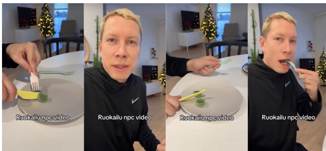
Kuva 5. Kuvakaappauksia videosta V7 (@terapeuttille, 23.12.2023).

Aineistossa tällaisten esitystapojen hyödyntäminen konkretisoituu esimerkiksi NPC-meemiin ( non-playable character ) perustuvassa videossa (V7), jossa esiintyjä jäljittelee pelihahmomaista, mekaanista toimintaa. Videolla poliitikko kuvaa itseään ruokailutilanteessa ja kommentoi toimintaansa ääneen poikkeuksellisen yksinkertaisella ja konemaisella puhetavalla (kuva 5). Puhe etenee vaiheittain ja kuvaa suoraan näkyvää toimintaa, kuten haarukan pudottamista ja uuden käyttöönottamista, mikä korostaa esityksen mekaanisuutta ja ennalta määrättyä rakennetta.