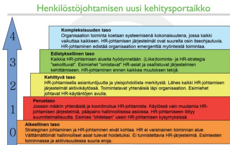
Kuva 1 Henkilöstöjohtamisen uusi kehitysportaikko. (Kauhanen ja muut, n.d., s. 39)

yrityksen strateginen johtaminen ja henkilöstöjohtaminen eivät kytkeydy toisiinsa, eikä kumpaakaan toiminnan aluetta välttämättä ole olemassa. Seuraavilla kolmella tasolla henkilöstöjohtamisen hyödynnettävyys organisaatiossa kasvaa asteittain, ja neljännellä kompleksisuuden tasolla HR-johtaminen edistää organisaation toimintaa edistyksellisesti.