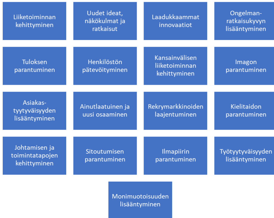
Kuvio 4 Tehokkaan monikulttuurisen johtamisen tuomat hyödyt organisaatiolle