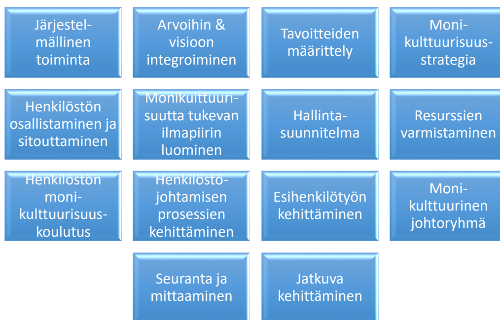
Kuvio 3 Monikulttuurisen johtamisen edistäminen organisaatiossa

Kuviossa 3 on koottuna monikulttuurista johtamista organisaatiossa edistävät tekijät.