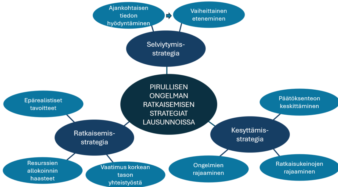
Kuvio 3. Tunnistettut pirullisen ongelman ratkaisemisen strategiat sidosryhmälausunnoissa sekä se, miten ne ilmenivät aineistosta.