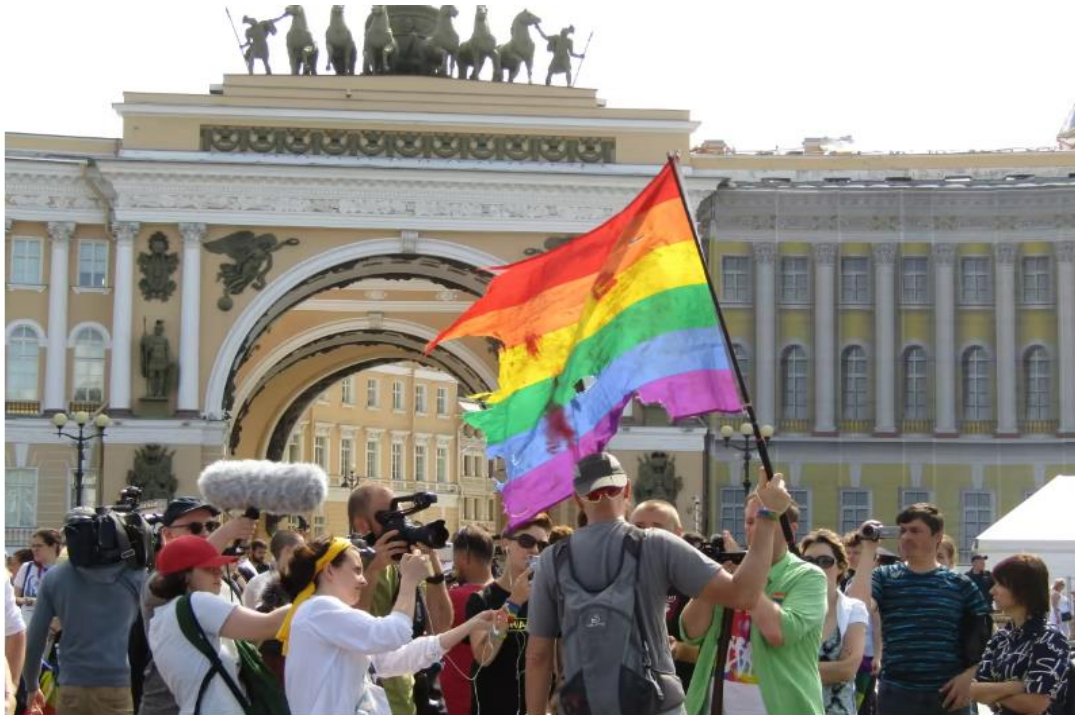
Sateenkaarilippu oli hetken aikaa esillä Pride-mielenosoituksessa Pietarissa elokuussa 2014. Kuva: Yle/Kerstin Kronvall

Kuva 1. Kuva Pride-mielenosoituksesta Pietarissa. (Yle/Kerstin Kronvall, 2014).