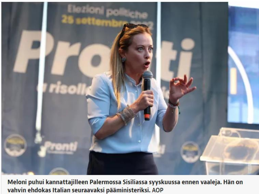
Meloni puhui kannattajilleen Palermossa Sisiliassa syyskuussa ennen vaaleja. Hän on vahvin ehdokas Italian seuraavaksi pääministeriksi.