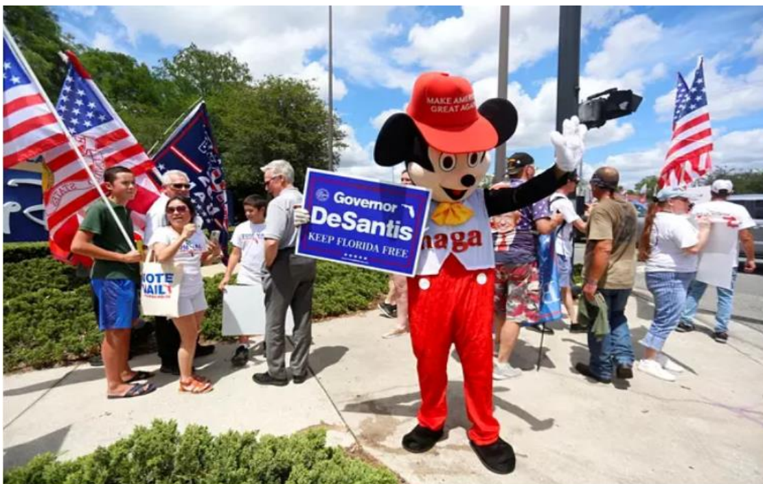
Media- ja viihdejätti Disney on asettunut vastustamaan Floridan Älä sano homo -lakia ja saanut oikeiston vihat niskoilleen.