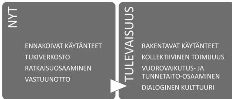
Kuvio 2. Organisaation tekijät konfliktien johtamisessa

konfliktien hallinnassa. Eräs HR-ammattilainen teknologia-alalta puhui konflikteista eriävinä mielipiteinä ja näki niiden rakentavassa käsittelytavassa yhtymäkohtia innovaatioihin ja koki parhaimmillaan ristiriitojen johtavan uusiin ideoihin.