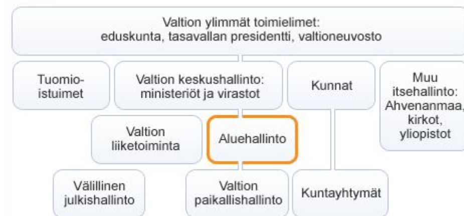
Kuvio 2. Aluehallinnon paikka julkishallinnon rakenteessa (Suomi.fi 2016c)

Kuntien maaseutuhallinto ja Leader-ryhmät, jotka ovat osa ohjelman viestintäverkostoa, toimivat maa- ja metsätalousministeriön organisaatioiden tukemana. Täten ne ovat alueellisia ja toimivat sen tukijoiden alapuolella julkishallinnon rakenteessa. Tämän takia heidän sijaintiaan ei näy kuviossa 2.