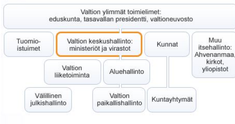
Kuvio 1. Ministeriöiden sijainti julkishallinnon rakenteessa (Suomi.fi 2016a)

Maa- ja metsätalousministeriöllä on omia hallinnonalan organisaatioita. Ohjelman viestintäverkostossa mukana olevat Elinkeino-, liikenne- ja ympäristökeskukset (ELY-keskukset) ja Maaseutuvirasto (Mavi) ovat esimerkkejä näistä organisaatioista. (Suomi.fi 2016b.) Mavi vastaa EU:n maataloustuki- ja maaseuturahaston varojen käytöstä Suomessa (Mavi.fi 2016).