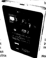
Nokian kännyköitä löytää kohta enää museoista.

Stephen Elop ei näytä amerikkalaisten elokuvien sliipatulta bisnesmieheltä, pikemminkin yläsavalaiselta osuuskaupan hoitajalta. Savolaiseen tyyliin vastuu siirtyi kuulijalle Elopin puheissa. Puheet olivat suuret, mutta Elopin kauden jäljiltä Nokian kännyköitä löytää kohta enää museoista.