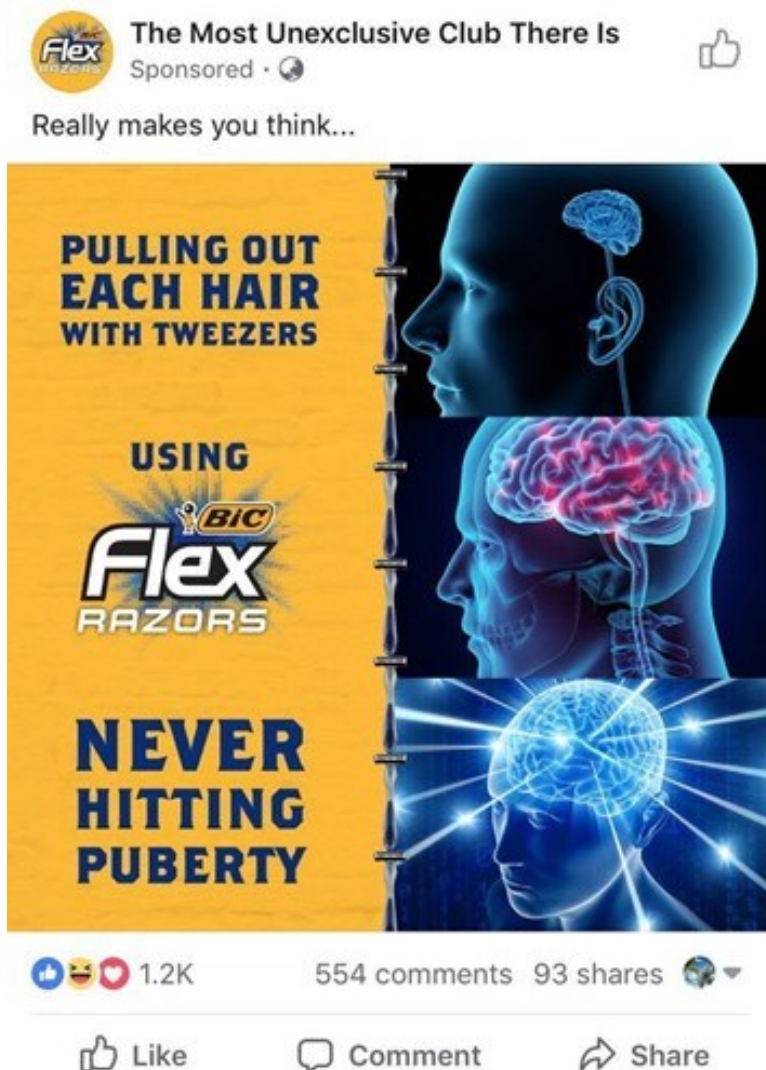
Kuva 16. Bic Razorsin Galaxy Brain -meemin variantti (Turtles_csgo, 2018).

BIC Razorsin variantissa tekstin ja kuvan erottaa toisistaan viiva, joka lähemmällä tarkastelulla paljastuu koostuvan yrityksen tuotteista, partahöylistä. Kyseinen meemi on brändi-ilmeinen lähellä printtimainosta, ja se ei muistuta juurikaan meemien rumaa ja viimeistelemätöntä estetiikkaa. Douglasin (2014, s. 336) mukaan kaupalliset ja poliittiset tahot suosivatkin internetmeemeissä omia intressejään meemien ruman estetiikan kustannuksella hakien hyväksyntää yhteisöltä, johon ne eivät kuulu eivätkä ole sitoutuneet. BIC Razorsin valinta käyttää omaa brändi-ilmettä meemissä saattaa johtua siitä, että pelkistetyn meemin estetiikka ei ehkä ole tuttu ja ymmärrettävä yrityksen kohderyhmälle.