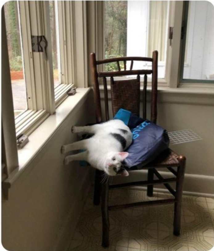
Kuva 9. Hämähäkkiaiheinen Nobody:-meemin variantti (ZakOrpheus, 2020).

Kuvan 9 meemivariantti kommentoi arkipäiväistä ilmiötä eli hämähäkkien normaalia toimintaa, mikä tekee siitä helposti samaistuttavan. Lisäksi kuvan suloinen ja hupsusti käyttäytyvä kissa rakentaa yhteisöllisyyttä, sillä muut kissanomistajat voivat samaistua kissan erikoiseen puuhailuun (ks. Thibault & Marino, 2018, s. 487). Monesta muusta aineiston meemivariantista poiketen kyseinen variantti ei sisällä viittauksia tai vaadi erityistä meemilukutaitoa.