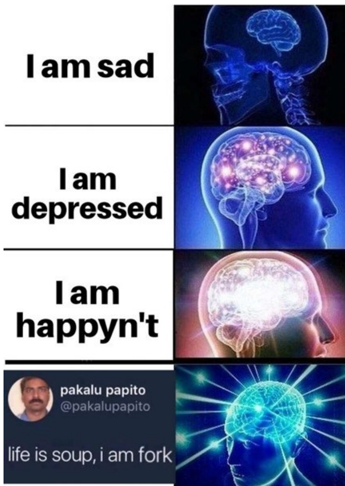
Kuva 6. Mieliäia-aiheinen Galaxy Brain -meemin variantti (Mick-Stape, 2019).

Variantin kolmannen kuvan kirkkaana loistavat aivot on yhdistetty tekstiin "I am happyn't". "Happyn't" on itsessään memeettinen ilmaus, jossa sanan "n't"-päätte merkitsee vastakohtaa. Yksi tunnettu esimerkki vastaavasta "n't"-meemistä on englannin kielen kyllä-sanasta muovattu "yesn't," joka merkitsee ei-sanaa (ks. esim. Know Your Meme 2020d).