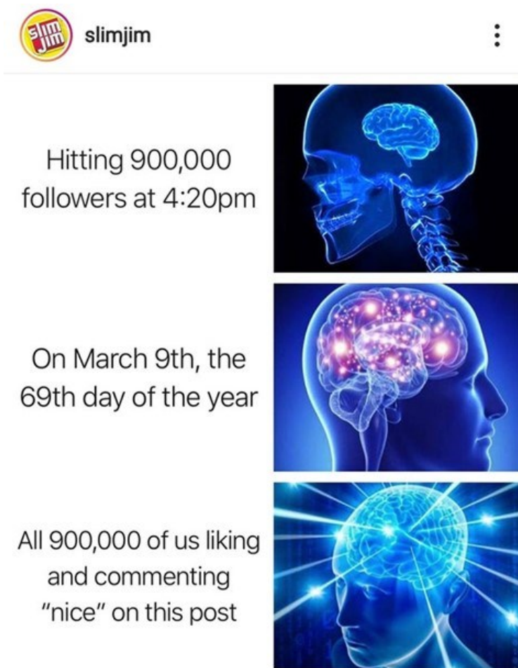
Kuva 14. Slim Jimin Galaxy Brain -meemin variantti (BashfulBass, 2020).

Meemivariantissa pyritään vaikuttamaan lukijaan ja saamaan hänet seuraamaan Slim Jimiä sosiaalisessa mediassa sekä tykkäämään ja kommentoimaan julkaisua eli sitoutumaan siihen. Siinä missä Woerndl ja muut (2008, s. 37) esittävät, että viraalimarkkinointisällön kannattaa olla käyttäjiä kiinnostavaa ja kiehtovaa, Slim Jim tavoittelee meemin viraalia leviämistä ehdottamalla suoraan lukijalle julkaisuun sitoutumista. Kyseinen alun perin Instagramissa julkaistu meemi saa palvelun algoritmien ansiosta sitä enemmän näkyvyyttä, mitä enemmän siihen sitoudutaan (ks. esim. Zote, 2022).