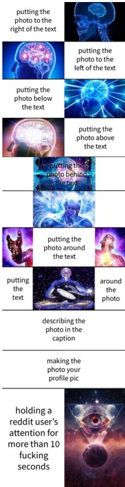
Kuva 7. Meemin muotoa kommentoiva Galaxy Brain -meemin variantti (Potsy9, 2019).