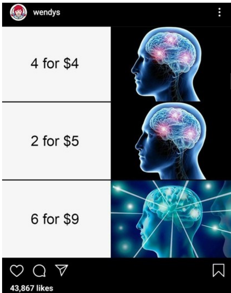
Kuva 15. Wendy'sin Galaxy Brain -meemin variantti (SwagSoap, 2020).

Wendy'sin meemivariantissa ehdotetaan, että kuluttaja hyödyntäisi molemmat kampanjat, jolloin hän saisi 6 tuotetta 9 dollarilla; myös tässä variantissa iskulauseena toimii humoristinen numero 69. Variantti on tuotekeskeinen, mutta se ei käy ilmi suoraan sen denotaatiosta, vaan lukijan on tunnettava Wendy'sin tarjooma.