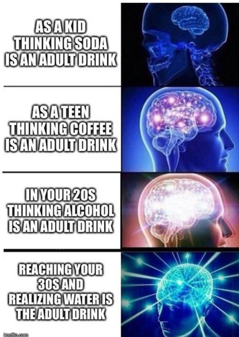
Kuva 5. Juoma-aiheinen Galaxy Brain -meemin variantti (YouKnowYooHoo, 2019).

Kuvan 5 Galaxy Brain -meemin variantti koostuu neljästä kuvan ja tekstin vastinparista. Tekstit noudattavat samaa muotoa vain yhden sanan vaihtuessa. Kyseisessä meemivariantissa kuvataan, miten eri ikäluokat ajattelevat erilaisista juomista ja niiden kohderyhmistä.