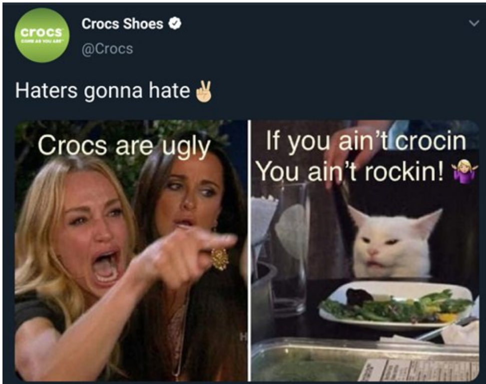
Kuva 11. Crocs Shoesin Woman Yelling at a Cat -meemin variantti (xSquishy, 2019).

Woman Yelling at a Cat -internetmeemin muissa varianteissa kissan päälle on yleensä heijastettu teksti, joka kertoo kissan kuvastavan internetmeemin tekijää ja antaa usein kontekstin sille, miksi kissa on hämmentynyt. Tässä Crocs Shoesin versiossa näin ei ole, vaan kissan päälle on heijastettu sanaleikki ”If you ain’t crocin You ain’t rockin!” (vapaasti suomennettuna ”Jos et croccea, et rokkaa!”) ja olkapäitä välinpitämättömästi kohauttava emoji, joilla kissa vastaa naisen suuttumukseen. Tyypillisissä varianteissa kissa on ihmeissään naisen käytöksestä eikä vastaa naiselle mitään, toisin kuin tässä versiossa. Crocs Shoesin julkaisema variantti siis poikkeaa niin muodoltaan kuin sisällöltäänkin yksityishenkilöiden tavasta soveltaa kyseistä internetmeemiä.