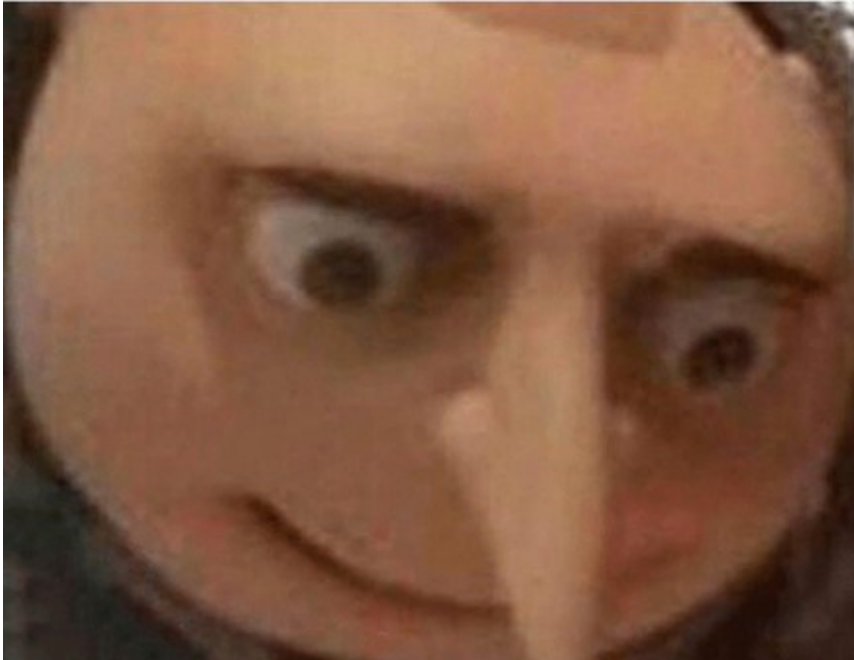
Kuva 10. Maastopaloaiheinen Nobody:-meemin variantti ([Poistettu käyttäjätili], 2020).

Nobody: The Australian who threw his cigarette into the grass: