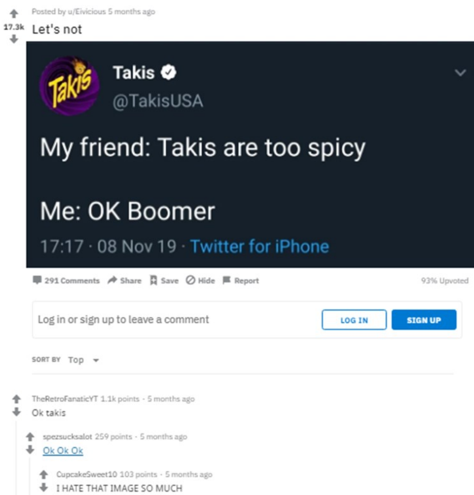
Kuva 1. Esimerkki Reddit-julkaisusta (Eivicious, 2019).

koostuva keskustelualusta, jolla on yli 50 miljoonaa päivittäistä käyttäjää (Reddit, n.d.a). Keskustelualue voi liittyä esimerkiksi ihmissuhteisiin, kuten Relationships , tai olla suunnattu vain tietylle käyttäjäryhmälle, kuten teini-ikäisille tarkoitettu Teenagers . Reddit-julkaisut sisältävät median, kuten tekstin, kuvan, videon tai muun tiedoston; otsikon sekä mediaan liittyvän kommenttiosion (ks. kuva 1). Redditin kommenttiosiot ovat lankamuotoisia, eli kommenttiin liittyvät vastaukset ovat suoraan sen alapuolella, ja kommenttiosiossa voi olla käynnissä samanaikaisesti useita eri keskusteluja eri kommenttien alla.