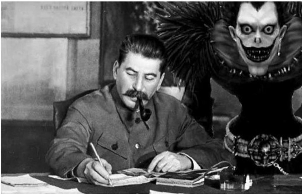
Kuva 8. History Channel -aiheinen Nobody:-meemin variantti (TheMightyBeak376, 2020).

Kuvan 8 meemivariantin muoto koostuu Nobody:-meemeille tyypilliseen tapaan rakenteeltaan litterointia muistuttavasta tekstistä sekä kuvasta. Tekstin mukaan variantin kuva representoi sisältöä, jota History Channel esittää kolmelta aamuyöstä. Kuvassa esiintyy neuvostodiktatori Stalin, joka kirjoittaa paperille, ja Stalinin vieressä seisoo erikoinen, suoraan lukijaa katsova olento.