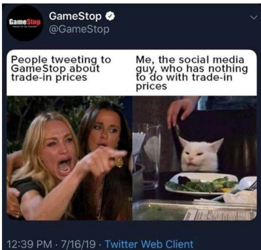
Kuva 12. GameStopin Woman Yelling at a Cat -meemin variantti (SneepSnorping, 2019).

Kuvan 12 GameStopin julkaiseman meemivariantin aiheena on GameStopin saama asiakaspalaute Twitterissä. Vasemmanpuoleiset naiset representoivat ihmisiä, jotka twiittavat GameStopille käytettyjen pelien hyvityshinnoista, ja kissa puolestaan merkitsee GameStopin sosiaalisesta mediasta vastaavaa työntekijää, joka ei voi vaikuttaa kyseisiin hyvityshintoihin.