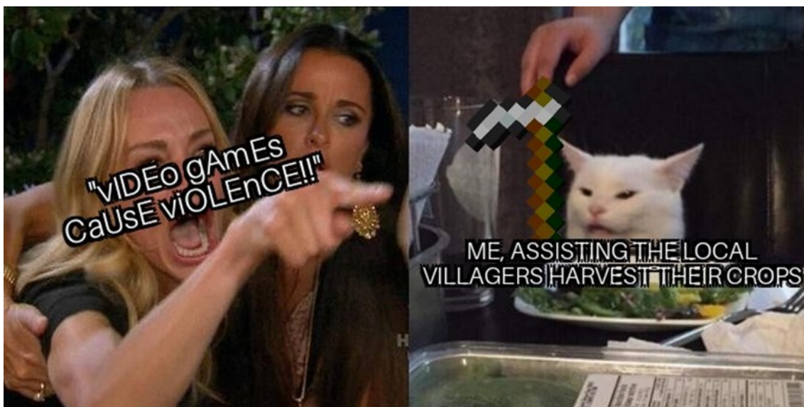
Kuva 2. Videopelii aiheinen Woman Yelling at a Cat -meemin variantti (Serpent101, 2019).

Kuvan 2 meemivariantissa vihaisen naishahmon mielestä videopelit saavat aikaan väkivaltaa, mikä hämmentää ja turhauttaa kissaa. Suur- ja pienaakkosten sekoittaminen sekä kahden huutomerkkin käyttö korostavat naisen kiihtymystä ja suuttumusta saaden hahmon ja samalla hänen argumenttinsa vaikuttamaan irrationaliselta ja heikentäen väitteen uskottavuutta. Tämä liioitellun vihainen naishahmo representoi videopelejä väkivaltaisena pitäviä ihmisiä, jotka pyritään saattamaan naurunalaisiksi.