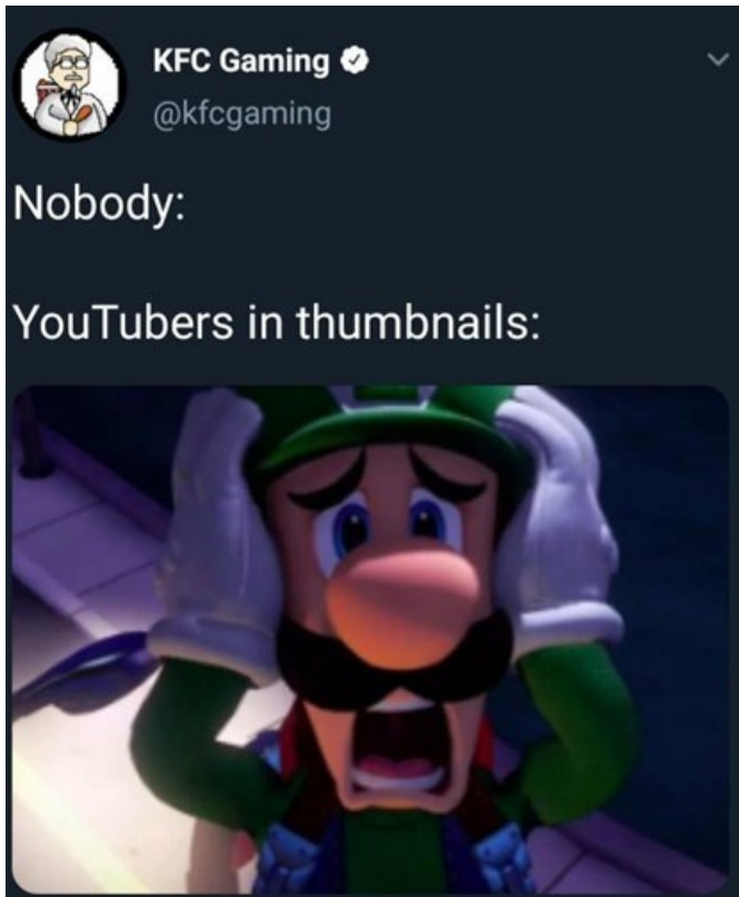
Kuva 18. KFC Gamingin Nobody:-meemin variantti (RealUltimate, 2019).

KFC Gamingin meemivariantin kuvassa esiintyy kauhistuneen näköinen Super Mario -pe- lien Luigi-hahmo; yritys on valinnut varianttiin kuvan, joka lienee tuttu videopelejä har- rastavalle kohdeyleisölle. Variantti on myös samaistuttava, sillä YouTube-kanavien teat- raaliset esikatselukuvat ovat yleinen naurunaihe sosiaalisessa mediassa. KFC Gaming tuottaa YouTube-videoita, joten meemivariantissa sivutaan brändin omaa tarjoomaa.