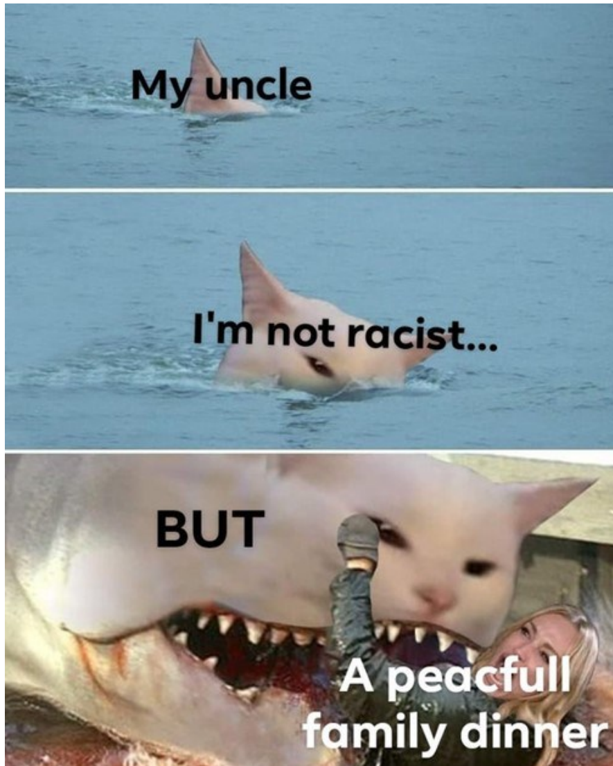
Kuva 4. Illallissaiheinen Woman Yelling at a Cat -meemin variantti (Shark1ra, 2020).

Meemivariantin ensimmäisessä kuvassa näkyy ainoastaan vedestä pilkottava Smudgekissan korva, joka muistuttaa hain evää ja joka meemiin heijastetun tekstin mukaan representoi meemivariantin tekijän setää. Toisessa kuvassa kissasta näkyy osa päästä, jonka päälle on heijastettu teksti "I'm not racist...". Kolmannessa kuvassa esitetään kissan todellinen ulkoasu, sillä se onkin hai, joka hyökkää muissa Woman Yelling at a Cat -meemin varianteissa esiintyvän naisen kimppuun. Kolmannessa kuvassa kissan päälle on heijastettu teksti "BUT", mikä kääntää aiemman väitteen pääläelleen: setä vakuuttaa ensin,