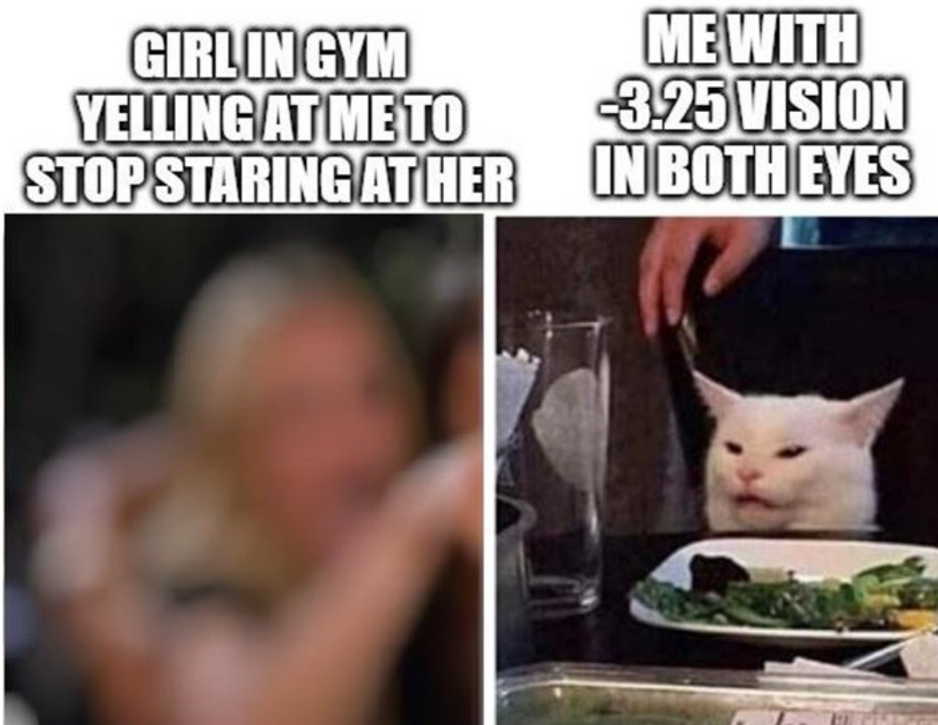
Kuva 3. Kuntosaliaiheinen Woman Yelling at a Cat -meemin variantti (dreams_in_bytecodes, 2019).

Kuvan 3 meemivariantin ymmärtäminen vaatii meemin aiempaa tuntemusta, jotta vasemmanpuoleisen kuvan sisällön voi tunnistaa. Keskeinen samaistumispinta variantissa on edelleen kissa, jolle nainen huutaa ja jonka ilmeen voidaan tulkita olevan hämmennyt tai jopa hieman tilanteeseen turhautunut.