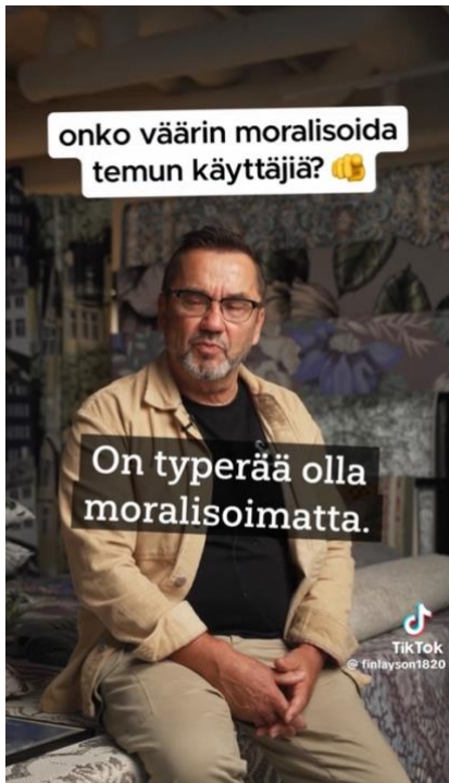
Kuva 4 Osa tekstitystä voidaan korostaa (video 6).

Finlaysonin kaikki TikTok-videot ovat tekstitettyjä. Osa tekstitystä sekä muita tekstejä on korostettu väreillä, eri fonteilla sekä tekstin koolla. Esimerkiksi videolla 6 lause ”on typerää olla moralisoimatta” on korostettu suurentamalla sitä ja erilaisella asettelulla viestin vahvistamiseksi (ks. Kuva 5).