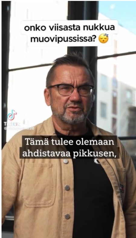
Kuva 6 Videot otsikoidaan mielenkiintoa herättävästi (video 3).

Videoissa on hyödynnetty myös aiempiin videoihin jätettyjä kommentteja, jotka toimivat edellä mainittujen otsikoiden kaltaisina avaavina teksteinä, jolloin niihin ei välttämättä vastata suoraan. Osassa videoista kuitenkin kommentit ovat osa sisältöä ja niihin vastataan suoraan videolla.