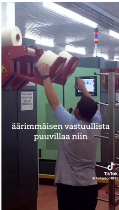
Kuva 2 Videoissa hyödynnetään kuvituskuvaa (video 4).

Finlaysonin videoilla on jonkin verran käytetty erilaisia kuvituskuvia havainnollistamaan videoilla välitettävää viestiä. Yrityksen aiemmista kampanjoista puhuttaessa on hyödynnetty näyttökuvia erilaisista artikkeleista liittyen kampanjoihin. Näillä luodaan kontekstia aiheelle, jos se ei esimerkiksi ole täysin tuttu katsojalle.