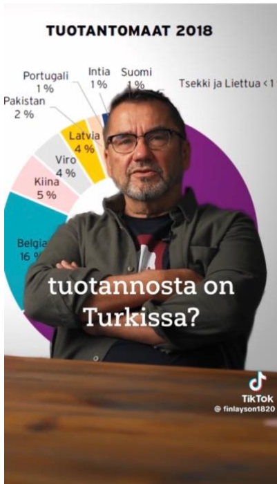
Kuva 3 Finlayson hyödyntää TikTokille ominaista "green screen" -efektiä (video 4).

Kuřaga (2024, s. 224) on todennut, että TikTokissa kiinnitetään katsojan huomio luovilla ratkaisulla, autenttisuudella sekä tunteiden herättämisellä. Ensisijaisen tärkeää nimenomaan TikTokissa on aiheuttaa nämä reaktiot jo ensimmäisten muutamien sekuntien aikana. Finlaysonin TikTok-videoissa leikkausten osalta yksi suurimpia tehosteita on lähentävät ja loittonevat leikkaukset. Kuvaustilanteet ovat muuten hyvin staattisia, ja tätä pyritäänkin poistamaan näillä leikkauksilla mukailen TikTokin nopeatempoista luonnetta. Erityisesti lähennyksillä pyritään rakentamaan dramaattisuutta. Esimerkiksi video 4 alkaa vahvalla taustamusikilla ja lähennyksellä, kun puhuja kehottaa yleisöä miettimään: "miksi mä oon tämmöne kusipää? miksi minä ostan halpaa paskaa ja miksi minä maksimoin tavarann määrää mun kaapissa?". Myös esimerkiksi luettelon yhteydessä kuva hiljalleen loittonee. Luettelointi voi katsojalle tuntua pitkäväteiseltä, jolloin katsoja menettää mielenkiinnon videota kohtaan. Tällaisella kuvan liikkeellä voidaan pyrkiä säilyttämään katsojan huomio.