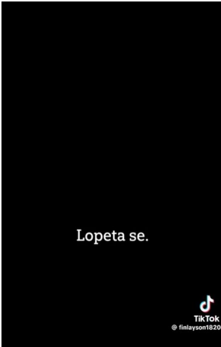
Kuva 5 Videoissa on hyödynnetty erilaisia tehokeinoja (video 6).

Ylikulutuksen diskurssi rakentuu myös puheesta kuluttajien vastuun siirtämisestä esimerkiksi päättäjille. Tällaista vastuun siirtoa voidaan pitää siten perusteluna omien kulutustapojen jatkamiselle (ks. Esimerkki 30).