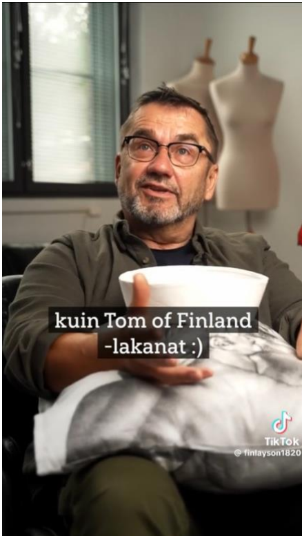
Kuva 1 Puheen sävy tuodaan esiin tekstuaalisesti hymiön avulla (video 2).

Videolla 2 (ks. Kuva 1) nähdään, miten puheen sävyä tuodaan esiin myös tekstuaalisesti hyödyntämällä tekstityksessä hymiötä. Tämän tyyppisten hymynaamojen käyttö yhdistetään nykyään yleensä sarkasmiin.