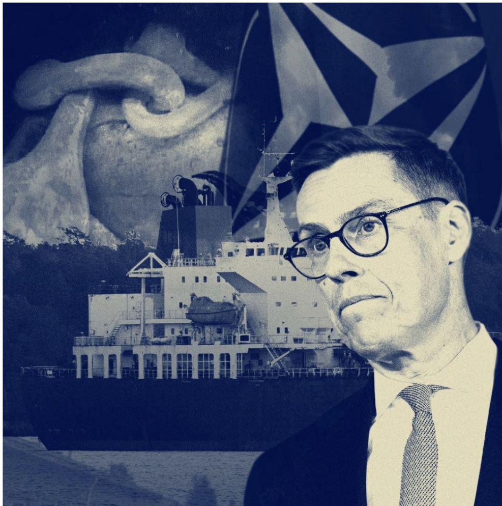
kuvitus: Antti Saloniemi / HS

Kuva 4. Presidentti Stubb hybridivaikuttamisen kompleksisuuden edessä (Hartikainen ja muut, 2025).