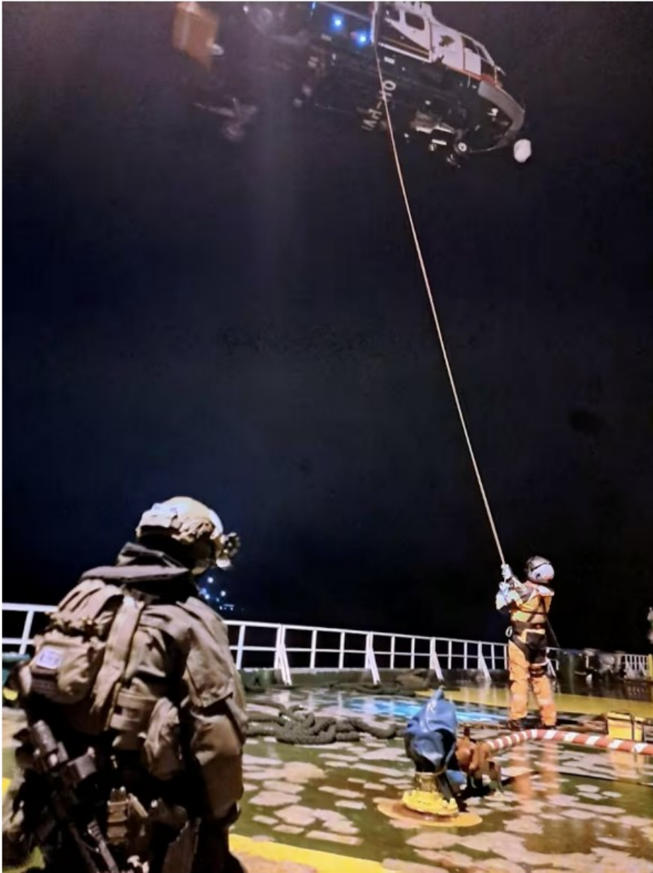
Poliisin ja Rajavartiolaitoksen valmiusjoukot laskeutuivat Eagle S:n kannelle 26. joulukuuta.

Kuva 2. Poliisi ja Rajavartiolaitos Eagle S -laivan kannella (Happonen, 2025).