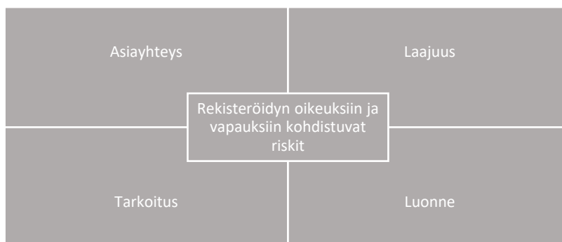
Kuvio 3. Rekisteröidyn oikeuksien ja vapauksien riskialueet 83 .

Rekisterinpitäjän ja henkilötietojen käsittelijän tulee varmistaa henkilötietojen asianmukainen turvallisuustaso, huomioiden uusimmat tekniikat ja toteuttamiskustannukset suhteessa suojeltavien henkilötietojen luonteeseen sekä tietojenkäsittelyn riskeihin. Tietojen suojaamisesta on huolehdittava käsittelyn jokaisessa vaiheessa, tietojen keräämisestä tietojen tuhoamiseen saakka. Yrityksen tulee varmistaa myös henkilötietojen käsittelyn turvallisuus. Henkilötietojen käsittelyn toteutustapaan vaikuttavat läheisesti henkilötietojen laatu sekä käsittelyyn liittyvät riskit 82 .