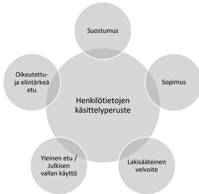
Kuvio 5. Henkilötietojen käsittelyperusteet 129 .

perustuu johonkin muuhun tarkoitukseen, on rekisterinpitäjän varmistettava, että käsittely on yhteensopiva alkuperäisen käsittelytarkoituksen kanssa 128 .