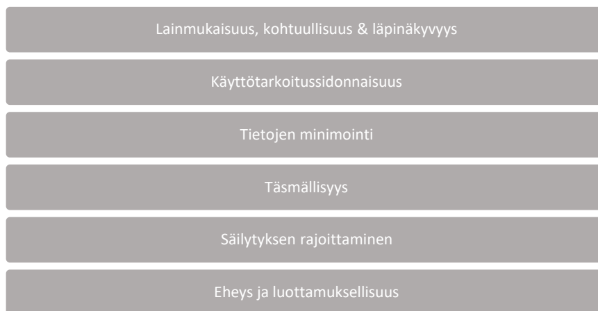
Kuvio 4. Henkilötietojen käsittelyn oikeusperusteet 113 .

Yrityksen arvioidessa henkilötietojen käsittelytapoja eli rekisterinpitäjän päättäessä 1) miten käsittely toteutetaan, 2) tavoista, joilla käsittely tapahtuu sekä 3) mitä toimintaperiaatteita käsittelyyn käytetään, on sisäänrakennettu tietosuoja otettava käyttöön. Tietosuoja on huomioitava jo yrityskauppaprosessin suunnitteluvaiheessa ja tekniset sekä organisatoriset toimet toteuttaa siten, että rekisteröityjen lainsäädännössä turvatut oikeudet ja vapaudet toteutuvat. Yritysten tulee oletusarvoisesti käsitellä ainoastaan tarpeellisia tietoja. Käsittelytapojen määrittäminen ja henkilötietojen käsittely on toteutettava sisäänrakennettuna tietosuoja-asetuksen 5 artiklassa määriteltyjen tietosuojaperiaatteiden mukaisesti: lainmukaisuus, kohtuullisuus ja läpinäkyvyys, käyttötarkoitussidonnaisuus, tietojen minimointi, täsmällisyys, säilytyksen rajoittaminen sekä eheys ja luottamuksellisuus. Toimenpiteet eivät saa olla liian vähäisiä, mutta eivät myöskään ylikuormitettuja 112 .