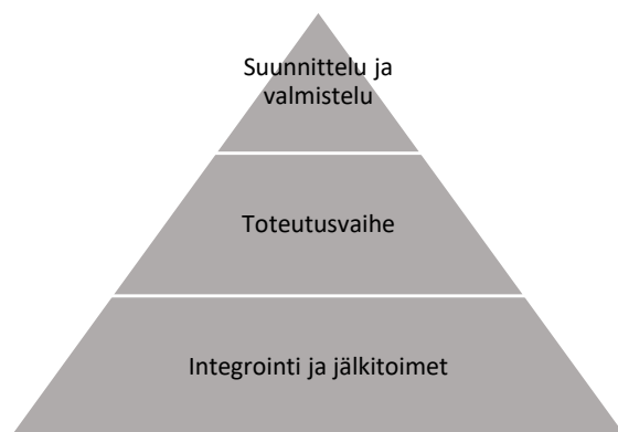
Kuvio 2. Yrityskaupan kolmiportainen vaiheistus.

Yrityskauppa on yleisin keino yrityksen toiminnan tai omistuksen uudelleenjärjestämiseen 49 . Se kattaa kaikki sellaiset sopimusjärjestelyt, jotka kohdistuvat yrityksen omistukseen ja jonka tuloksena määräysvalta siirtyy toiselle yritykselle tai yksityishenkilölle. Se on jakautumisen, fuusion sekä liiketoimintasiirron alkuvaihe, jonka jälkeen kohdeyhtiö otetaan haltuun ja sen omaisuutta tai toimintaa järjestetään uudelleen. Onnistunut yrityskauppa edellyttää ostettavan yrityksen sekä sen liiketoiminnan kokonaisvaltaista ja syvällistä tuntemusta 50 . Jokaisen yrityskaupaprosessin olessa ainutlaatuinen, voidaan sitä tarkastella ja vaiheistaa monella erilaisella tavalla. Prosessin painotus voi riippua tarkasteltavasta tilanteesta tai tarkastelijan mieltymyksistä. Tästä syystä jakoa voidaan pitää valinnaisena. Usein käytetty kolmiportainen vaiheistus on yrityskaupaprosessille tyypillinen: 1) suunnittelu, 2) toteuttaminen ja 3) integrointi eli sopeuttaminen 51 .