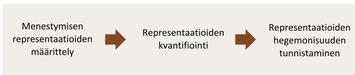
Kuvio 1. Aineiston analyysin vaiheet.