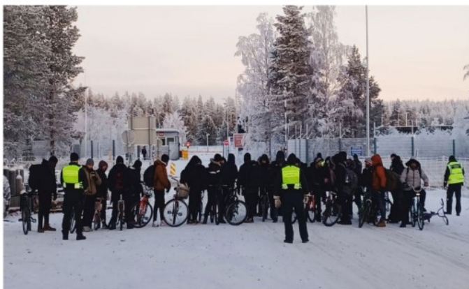
Etelän raja-asemien sulkemisen jälkeen ensimmäinen turvapaikanhakijoiden ryhmä saapui Sallan rajanylityspaikalle maanantaina 20.11.2023.

kollla Sallan vanantaista 5 turvapai- deettiin läm- huttettiin, ja tti vastaan et. Alkutoi- jettiin ra- raston tiloi- itaa viran- t. oneuvosto ista alkaen usamon ra- a-looseppi itti Rajavar- en turvalli- ssa, ja val- en. Päätök- ärjestetyt, n jatkumi-