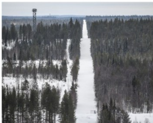
Suomen ja Venäjän välistä rajalinjaa Kuusamon Kortesalmella. Arkistokuva.

Piironen mukaan rajalla varau- kasvanut Kostamuksesta pohjoi- dutaan näin tilanteiden muutok- semmaksi. Iiten Sallankin tilanne