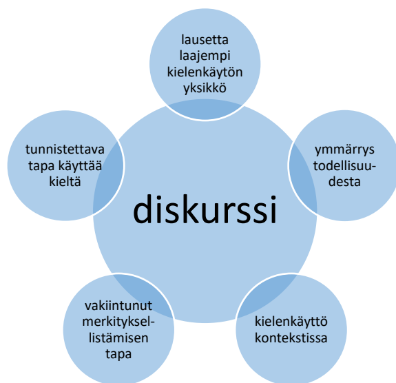
Kuvio 2. Diskurssin käsitteen moniulotteisuus (Pietikäinen & Mäntynen, 2019, luku 1.3).

Diskurssin käsite on tiiviisti myös yhteydessä representaation käsitteeseen. Esimerkiksi Fairclough (2003, s. 124) näkee diskurssit ympäröivän maailman ja sen eri prosessien ja rakenteiden representoinnin tapoina. Samalla ne eivät kuitenkaan ainoastaan representoi maailmaa sellaisena kuin se on, vaan ne myös näyttävät vaihtoehtoisia todellisuuksia. Täten ne kytkeytyvät tapoihin muuttaa maailmaa erilaiseksi. Vaikka diskurssin käsite on moniulotteinen, ovat ne suhteellisen pysyviä. Niiden sosiaalisen luonteen vuoksi ne ymmärretään yhteisöissä samalla tavalla. Fairclough'n (2003, s. 124) mukaan diskurssit eroavat kuitenkin esimerkiksi siinä, miten usein niitä toistetaan, kuinka ne kestävät aikaa ja kuinka laajan representaatioiden kentän ne muodostavat maailmassa.