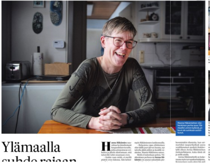
Kuva 4. Esimerkki kuvasta, jossa paikallinen asukas on haastateltavana.

ulkopuolisiksi toisiksi. Kuvassa 4 on esimerkki kuvasta, jossa on paikallinen asukas haastateltavana.