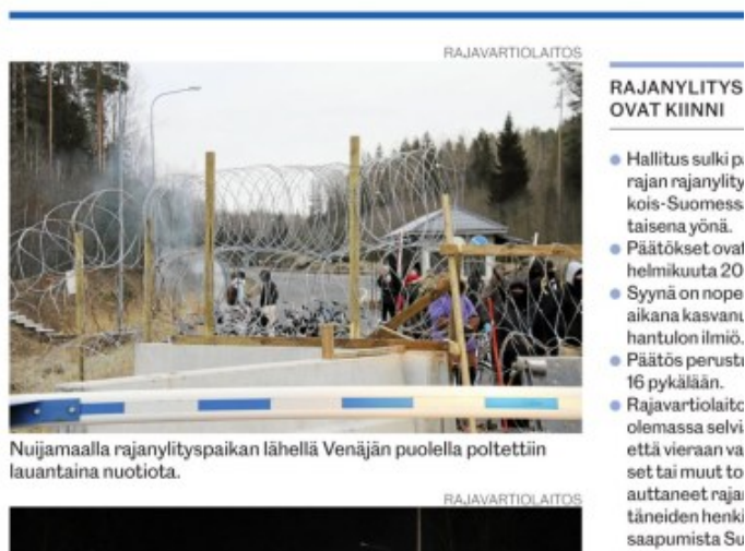
Kuva 2. Esimerkki kuvasta, jossa turvapaikanhakijoita on rajan toisella puolella esteen takana.

Niin kuvassa 1 kuin myös muissa aineiston tämäntyyppisissä kuvissa rajavartijat vahvistavat uhkadiskurssin muodostumista ja toiseuden rakentumista sen kautta. He symboloivat turvaa tuntematonta ja arvaamatonta uhkaa vastaan. Usein he ovatkin sijoittuneet kuvissa joko turvapaikanhakijoiden vierelle tai kuvaajan ja turvapaikanhakijoiden väliin. Muutamassa aineiston kuvassa kuvaajan ja turvapaikanhakijoiden välissä on rajavartijan sijasta selkeä fyysinen este, kuten piikkilangasta muodostettu raja-aita, puomieste tai metalliristikkoaita. Kuvassa 2 on esimerkki tällaisesta kuvasta.