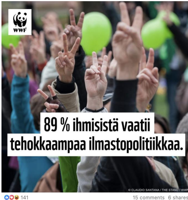
Kuva 4. Toivon kehyyksen julkaisu osallistumisesta (WWF, 16.2.2024).