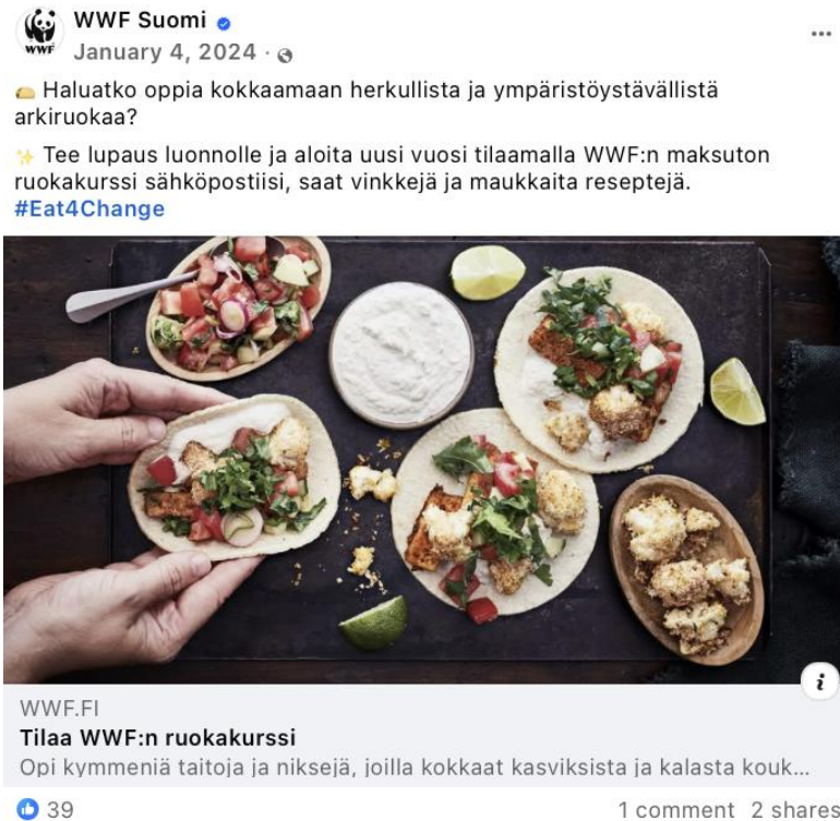
Kuva 5. Toivon kehyksen julkaisu arjen valinnoista (WWF, 4.1.2024).

mikä korostaa ilmastotekojen helppoutta ja nautinnollisuutta. McLoughlinin (2021, s. 9) mukaan erilaiset koulutukset voivatkin olla ympäristöjärjestöille tehokas tapa tarjota yleisöille onnistumisen kokemuksia ilmastonmuutokseen liittyen. WWF on myös koonnut ruokasuositukset kuuden lyhyen peukalosäännön muotoon. Nämä esitetään kuvallisena listana, mikä voi tehdä ilmastoystävällisestä ruuasta helpommin lähestyttävää.