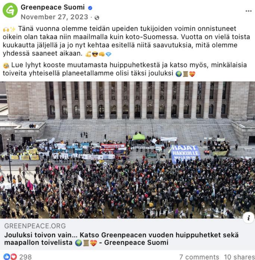
Kuva 2. Toivon kehysten julkaisu saavutuksista (Greenpeace, 27.11.2023).