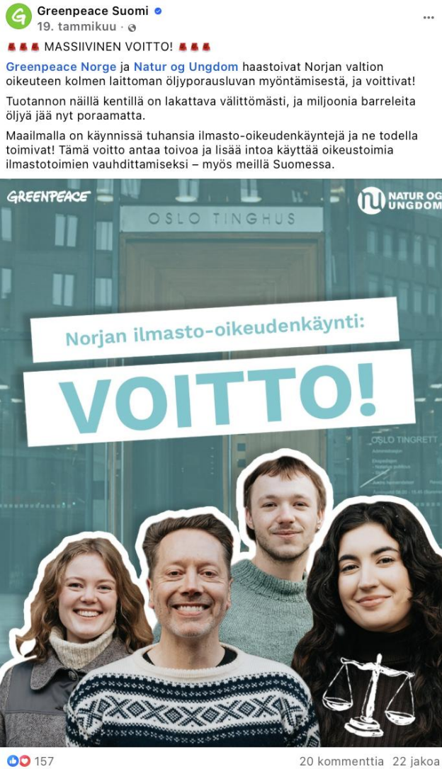
Kuva 3. Toivon kehksen julkaisu oikeustoimista (Greenpeace, 19.1.2024).