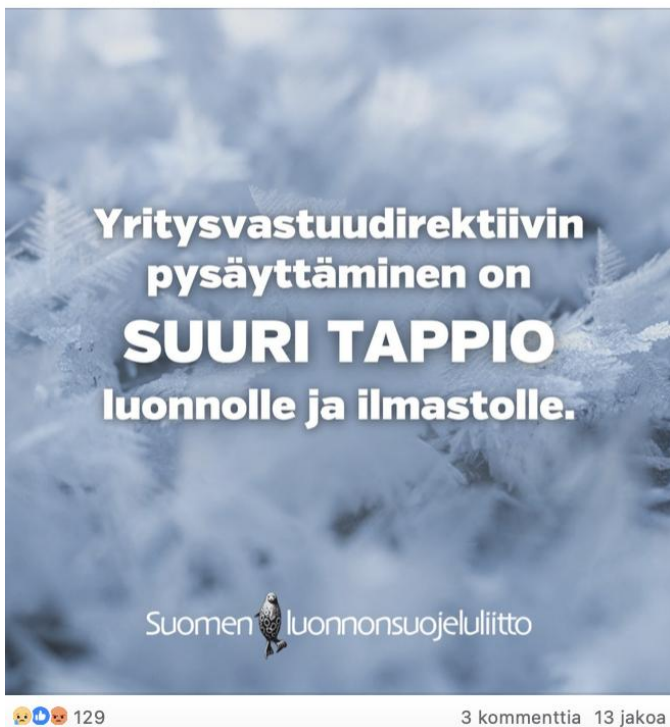
Kuva 10. Kiistojen kehysten julkaisu yritys vastuudirektiivistä (SLL, 28.2.2024).

Kuvan 10 julkaisu asettuu kiistojen kehykseen antamalla esimerkin eri tahojen välisistä vastakkainasetteluista ilmastokriisin hillinnässä. Julkaisussa myös kuvaillaan tilanteen etenemistä ympäristöjärjestön kriittisestä näkökulmasta. Lisäksi kehystä rakentaa visuaalisena elementtinä toimivan talvisen kuvan päälle asetettu teksti, jossa korostetaan