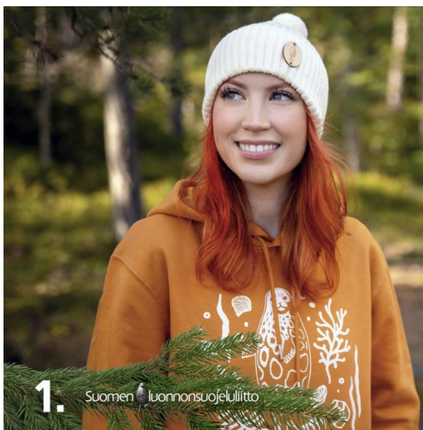
Kuva 1. Toivon kehыksen julkaisu arvonnasta (SLL, 1.12.2023).