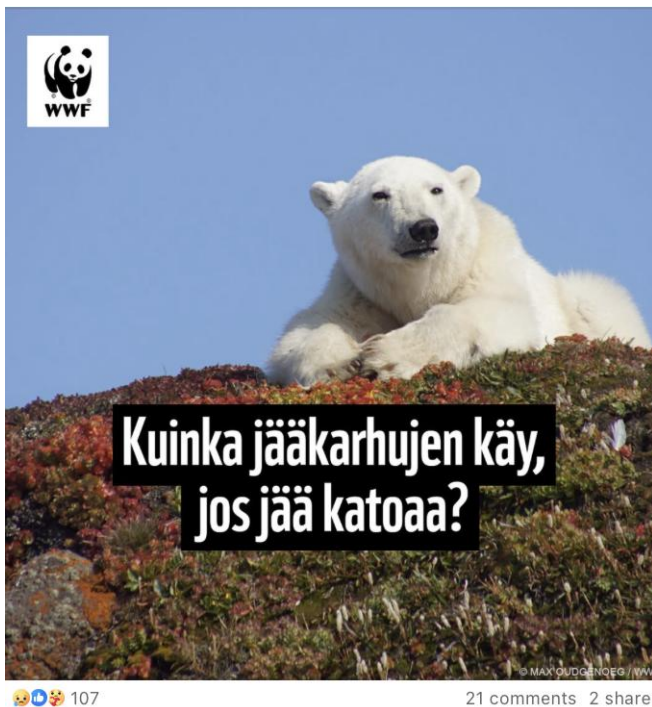
Kuva 6. Uhan kehyksen julkaisu jääkarhuista (WWF, 20.2.2024).