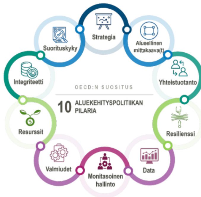
Kuvio 1. OECD:n aluekehittämiss politiikan 10 pilaria (OECD, 2023b)

OECD:n suositusten mukaisesti aluepolitiikka nojaa kymmeneen toisiaan tukevaan pilariin, joilla tähdätään esimerkiksi alueellisen muutoskestävyyden vahvistamiseen, resurssiviisauteen, yhteistyöhön ja yhteistuotantoon (ks. kuvio 1). 2000-luvulla kiihtynyt globalisaatio, maailmanlaajuinen finanssikriisi ja voimistunut kaupungistuminen ovat kuitenkin heijastuneet negatiivisesti taloudellisen kasvun tasa-arvoiseen kehitykseen OECD-maiden piirissä, johtaen usein alueellisten kehityserojen kasvuun (OECD, 2023a, s. 20).