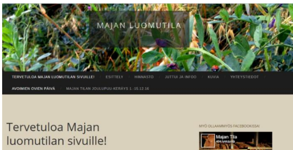
Kuva 2. Majan Luomutilan Wordpress-verkkosivusto (Majan Luomutila 2017)

Valitsin tiedotusvälineiden verkkouutisista koostuvaan aineistoon yle.fi-sivuston verkkouutiset, sillä sivustolla on runsaasti tarjolla uutisia liittyen lähi- ja luomuruokaan. Aineiston verkkouutiset on etsitty hakutoimintoa käyttäen hakusanoilla ”lähiruoka” ja ”luomuruoka”. Lähi- ja luomuruokauutisia oli paljon, mutta rajasin mukaan