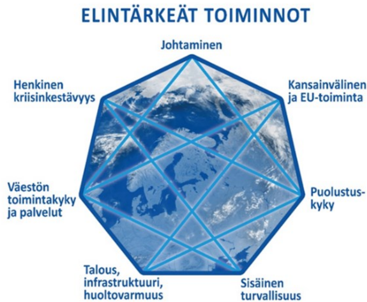
Kuvio 3. Yhteiskunnan elintärkeät toiminnot (Yhteiskunnan turvallisuusstrategia 2017).

Vakavat ja laajat häiriöt ovat äkillisiä tapahtumia, jotka vaativat viranomaisilta ja muilta toimijoilta normaalista poikkeavia toimia. Näihin kuin muihinkin laajoihin uhkatilanteisiin varaudutaan suomalaisen kokonaisturvallisuuden yhteistoimintamallin mukaisesti viranomaisten, elinkeinoelämän ja kolmannen sektorin yhteistyönä. (Valtioneuvosto, 2021, s. 34.) Suomalaisen varautumisen yhteistoimintamalli nähdään liittyvän tiiviisti tai jopa synonyyminä kokonaisturvallisuuden malliin (Wiikinkoski & Ollila 2021, s. 91). Kokonaisturvallisuuteen perustuvassa varautumisajattelussa yhteiskunnan elintärkeät toiminnot turvataan erilaisten toimijoiden ja viranomaisten yhteistoiminnan kautta. Yhteistoiminta rakentuu riskien ennakkoinnin, varautumisen suunnittelun, koulutuksen sekä harjoittelun toiminnan kautta. Tätä kautta rakennetaan toimiva valmius varmistaa yhteiskunnan elintärkeät toiminnot kriisitilanteiden ja häiriöiden tilanteessa. Toimivaan valmiustoimintaan kuuluu eri toimintojen ja viranomaisten vastuutehtävien jako sekä resurssien varmistaminen. (Eskola, 2017, s. 9.)