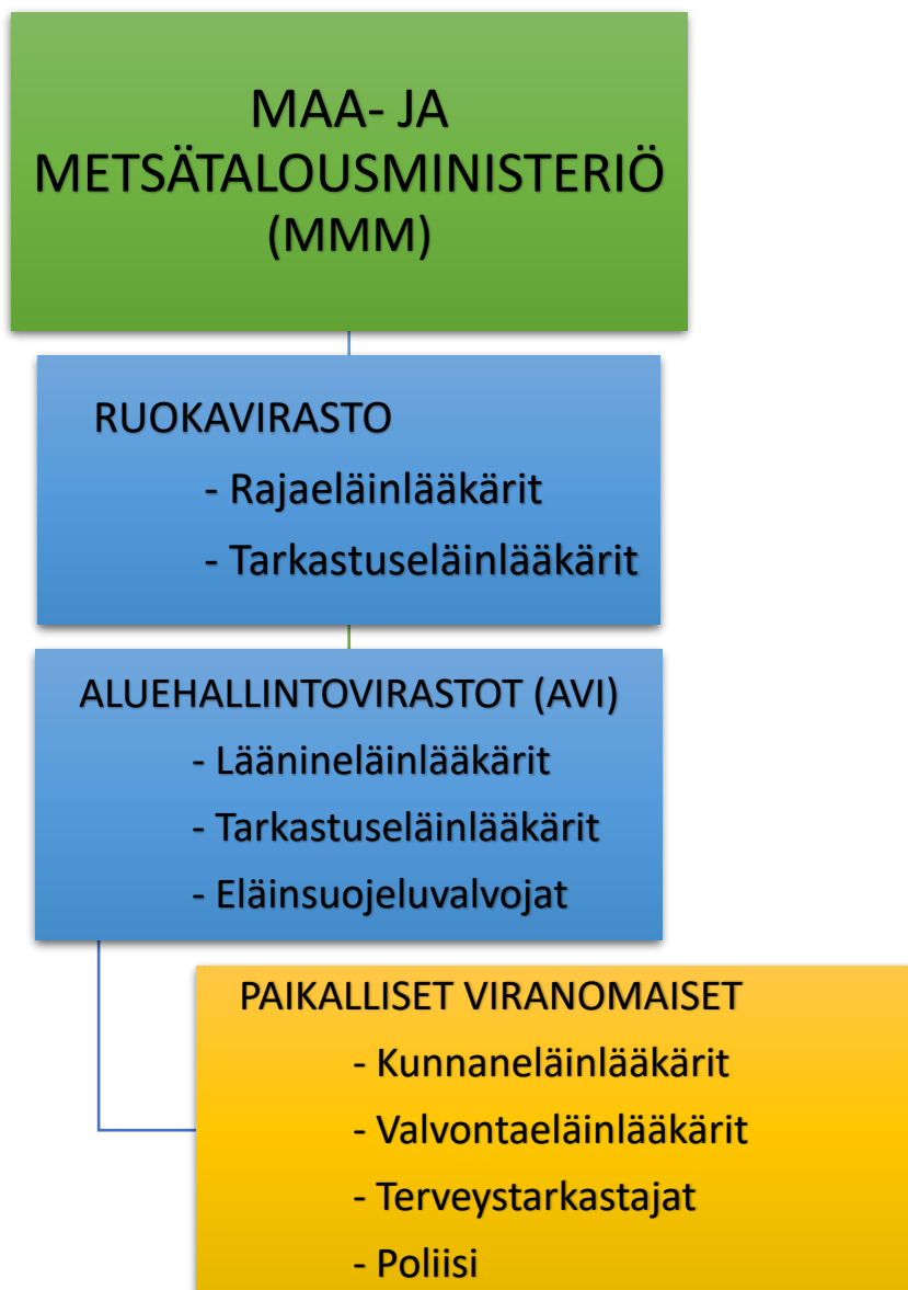
Kuvio 2. Eläinsuojeluviranomaisten hierarkia.