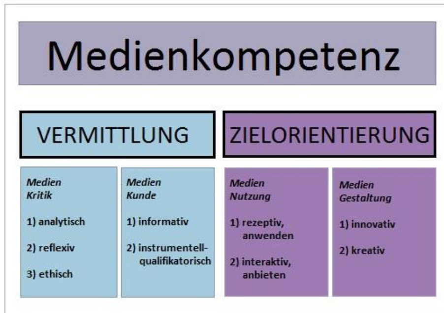
Abb. 3: Medienkompetenz und ihre Dimensionen nach Baacke (Falke 2012)

Abb. 3 oben beschreibt die Medienkompetenz und die verschiedenen Unterdimensionen, wie Baacke sie erfasst hat. Die vier Dimensionen sind in zwei Funktionen oder Formen eingeteilt, und zwar nach Vermittlung und Zielorientierung .