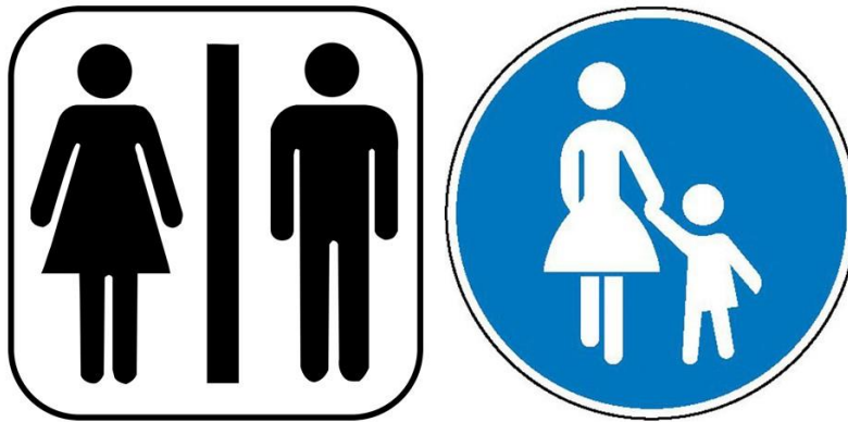
Abb. 2: Toiletten- und Verkehrsschild (Seton 2015; Schilder.com 2015)

Ein gemeinsamer Faktor für Fotos und Verkehrsschilder ist, dass die Interpretation ziemlich schnell durch die Bewegung der Augen über das Bild erfolgt. Man kann z. B. auf einem schönen Gemälde den Blick wandern lassen, um das Gesehene im Kopf zu behalten, aber trotzdem funktioniert das Lesen der Bilder nicht so wie das Lesen eines Textes. Das Lesen der Bilder ist ein Prozess, der simultan-ganzheitlich funktioniert, d. h. gegenwärtig und auf die Ganzheit bezogen. Bilder repräsentieren ikonisch-analoge Vertretungen von unterschiedlichen Objekten oder Zusammenhängen zwischen ihnen, während geschriebene Texte symbolisch-digitale Vertretungen der Objekte oder Zusammenhänge sind. (Frederking et al. 2008: 124)