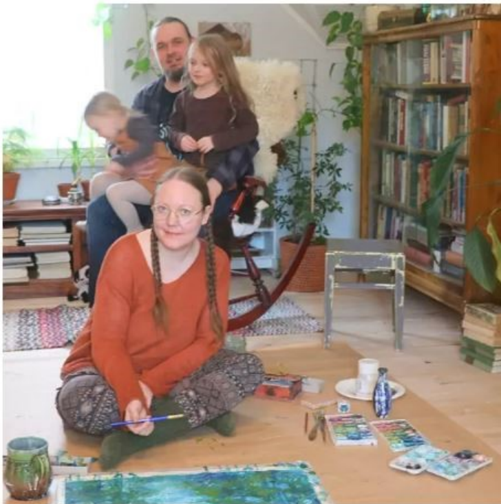
Taiteilijaperhe yhdessä. Kaisa Känällä on viihtyisät työtilat yläkerrassa.

Kuva 3. Helsingistä Merikarvialle muuttanut perhe.