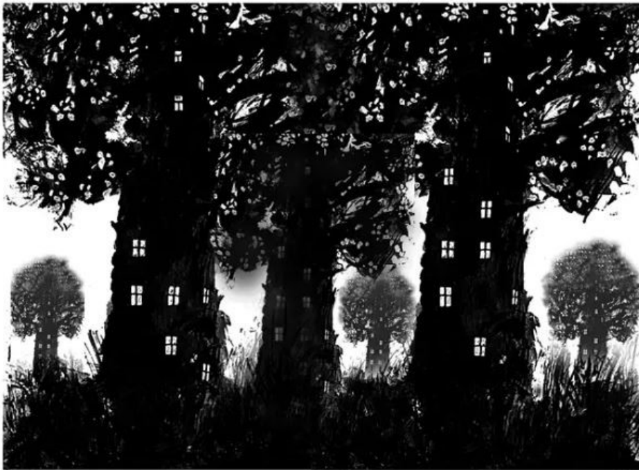
Kuva 4. Kuvituskuva mielipidekirjoitukseen (HS 2.10.2016).

Hajautetun Suomen malli hyödyttää kaikkia.