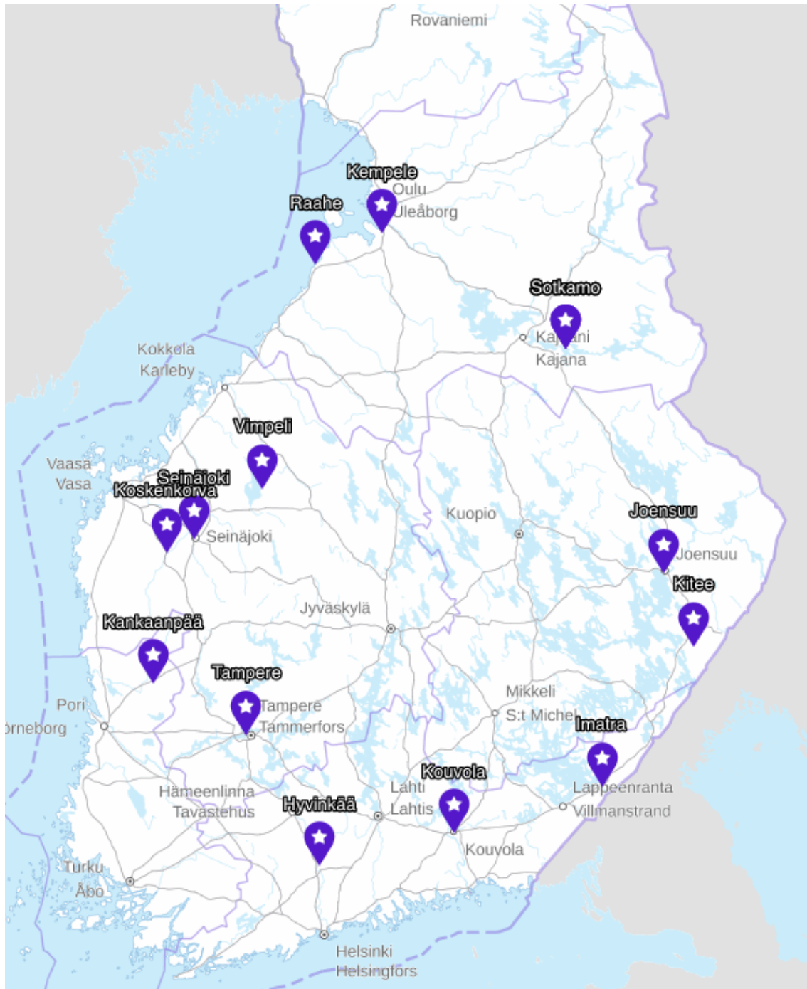
Kuva 1. Superpesiksen paikkakunnat sijoitettuina kartalle (Maanmittauslaitos, 2022).

Pesäpallon kehittäjänä pidetään Tahko Pihkalaa, joka syntyi vuonna 1888. Pihkala otti pesäpalloon vaikutteita niin Yhdysvaltojen baseballista kuin myös Ruotsin långbollista. Pesäpallon edeltäjä oli 1900-luvun alussa kehitetty kuningaspallo, jonka ensimmäinen peli pelattiin vuonna 1901. Vuonna 1915 Pihkala esitti muunnelmansa kuningaspallosta,