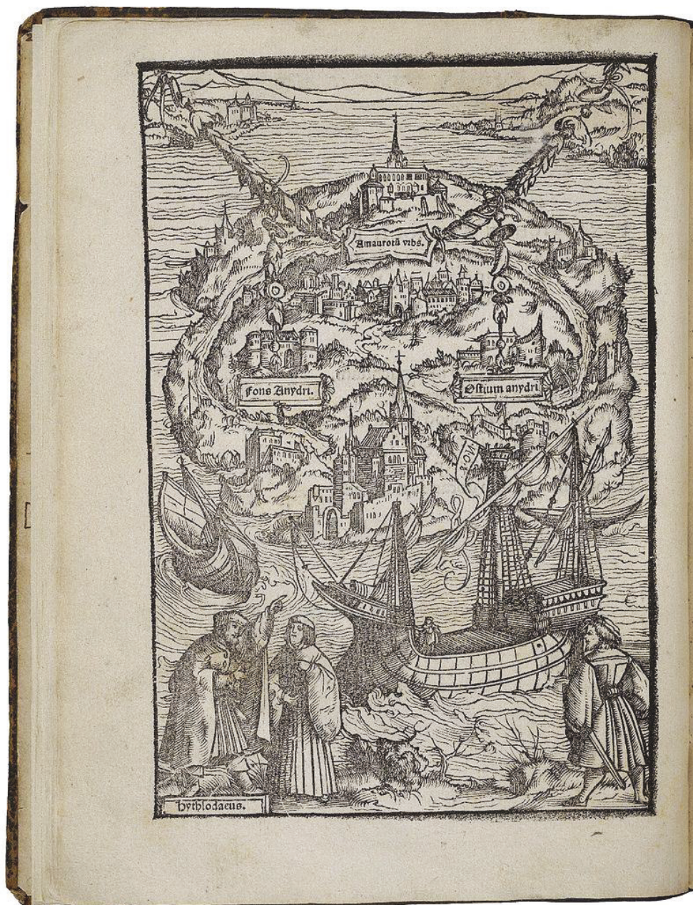
Figure 1. A woodcut map of the Island of Utopia, contributed by Ambrosius Holbein to Froben's edition, published in Basel in 1518.

on cut personal income and profits. The dominant anti-utopian element in Huxley's story is the use of genetic modifying to assimilate citizens into five hierarchical social classes to serve the needs of a consumerist and entertainment-centric society. The happiness of citizens is maintained with a drug called soma. The novel has been characterized as falling into the category of satirical anti-utopian literature (Balasopoulos 2006: 61). The novel ridicules the idea that a good society is an outcome of prevailing political ideologies and