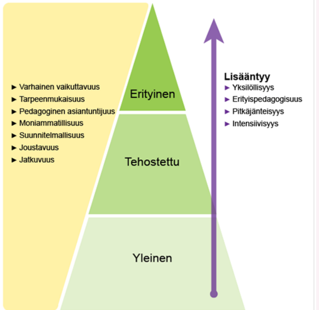
Kuvio 2. Kolmiportainen tuki.

ehkäistä ongelmien syntymistä sekä turvata varhainen tuki tarvitseville (Oppilashuolto-laki, 2 §).