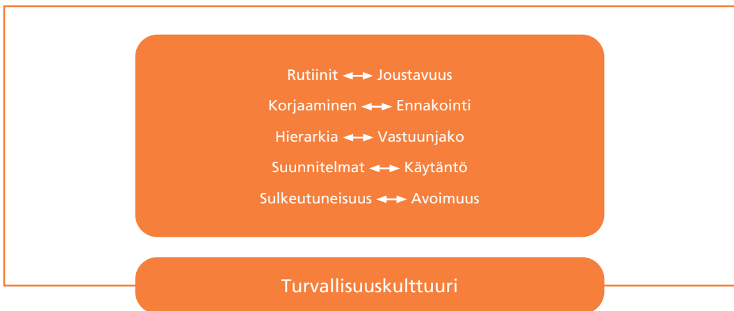
Kuvio 1. Sairaaloiden turvallisuuskulttuuria haastavat jännitteet.

Turvallisuuskulttuurin ristiriitaisuuksia kuvaavat jänniteparit auttavat ymmärtämään, millaisia haasteita sairaaloiden turvallisuuskulttuurin kehittämiseen sisältyy. Keskeistä on se, että jännitteet tunnistetaan ja