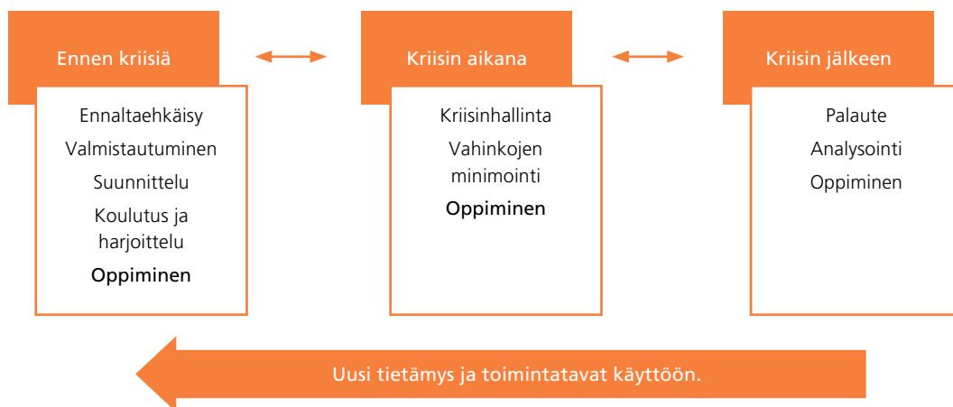
Kuvio 2. Muutosehdotus kolmivaiheiseen kriisisykliin: oppiminen on huomioitava myös ennen kriisiä ja kriisin aikana.

”Yritetään oppia myös muiden kriiseistä. Et se, että ottaa ite vaan turpaan ja oppii niistä, mut pitäis vähän kattoo, et miten naapurilla tapahtuu ja näin ja miksi se ei meillä muka vois tapahtua sitten. [...] Nää ilmiöt kattoo harvoin alueiden rajoja ja organisaation rajoja.” (T2)