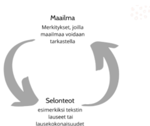
Kuvio 3. Merkitysten ja maailman välinen suhde

Vuorovaikutuksen tuloksena syntyvät selonteot (Suoninen 1999, s. 27). Kontrapunktisessa analyysissä tarkastellaan nimenomaisesti tapaa, jolla selonteot ovat vuorovaikutuksessa toistensa kanssa (Baxter, 2011, s. 162–164). Tässä vuorovaikutuksessa diskurssit syntyvät (Baxter, 2011, s. 162–164). Baxterin (2011, s. 168–170) mukaan diskurssit voivat esiintyä tekstissä ekplisiittisinä tai implisiittisinä. Kun diskurssit ovat ekplisiittisesti esillä tekstissä, ne on helppo löytää (Baxter, 2011, s. 168–170). Kun diskurssit ovat implisiittisiä tekstissä, ne on mahdollista löytää kehumista, tuomitsemista ja arvostelua ilmaisevissa selonteoissa tai selontekojen kokonaisuuksissa (Baxter, 2011, s. 168–170). Kun selontekojen esittäjä on tuominnut jonkun asian, selonteossa on implisiittisesti ilmaistu hyväksyttävänä pidetty diskurssi (Baxter, 2011, s. 168–170). Selontekojen tai selontekojen kokonaisuuksia tarkastelemalla voi saada tekstin piilotettuja tai vaiettuja tekijöitä näkyviin, eli saada implisiittisiä aiheita näkyviin (Mumby & Stohl 1991, s. 319). Selontekojen tarkastelussa myös poissaolevilla ja poisjätetyillä kohdilla on merkitystä.