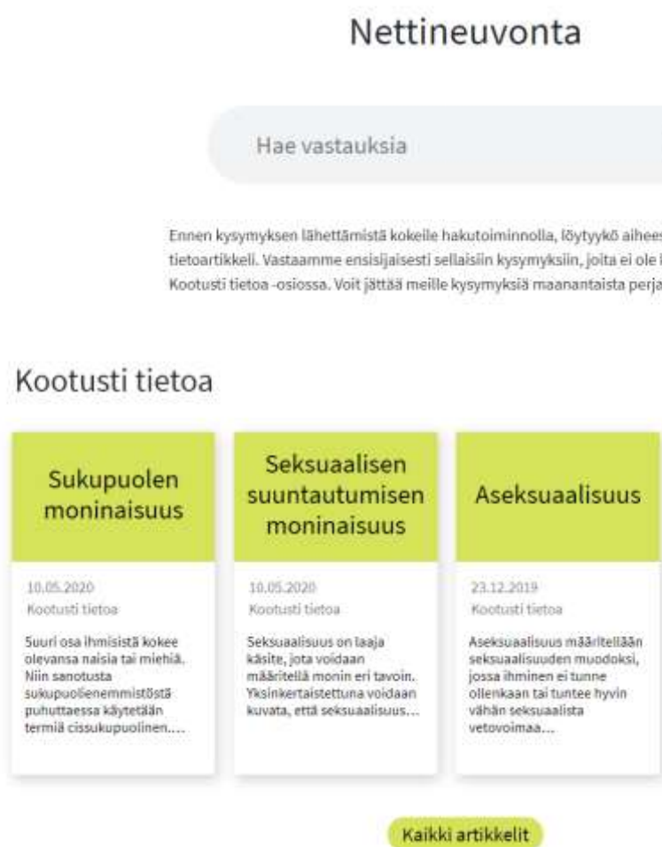
Kuva 2. Kuvakaappaus nettineuvonnan kootusti tietoaosiosta

luottamuksellisesti. Koska Sexpo-säätiön nettineuvontaa hallinnoivat asiantuntijat, sinne lähetetyt kysymykset ovat tarkasti kohdennettuja jo julkaistaessa. Asiantuntijat ovat myös poistaneet kysymyksestä mahdollisia tunnistetietoja anonymiteetin suojaamiseksi. Sexpo-säätiön nettineuvontaan kirjoittajat saavat apua seksuaalisuuden, seksin, sukupuolisuuden ja ihmissuhteiden kysymyksiin kirjoittaessaan Sexpo-säätiön nettineuvontaan (Sexpo, 2019b).