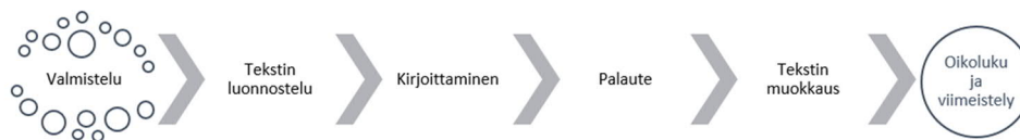
Kuvio 1. Tieteellisen kirjoittamisen prosessi.

Tieteellisessä kirjoittamisessa terminäkökulma nousee esiin eri tavoin tekstin laadinnan eri vaiheissa. Kuviossa 1 on kuvattu tieteellisen kirjoittamisen prosessin vaiheet yleisellä tasolla.