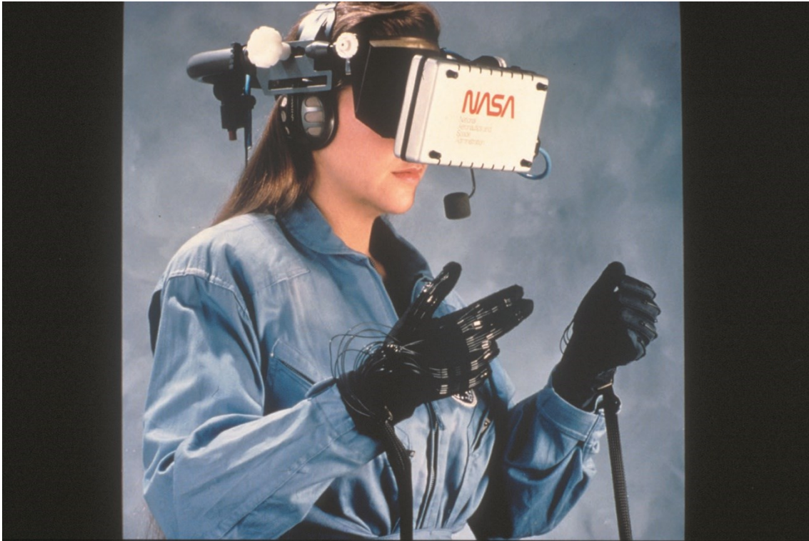
Kuva 1. The Virtual Interface Environment Workstation (VIEW), 1990. (NASA, 2014)