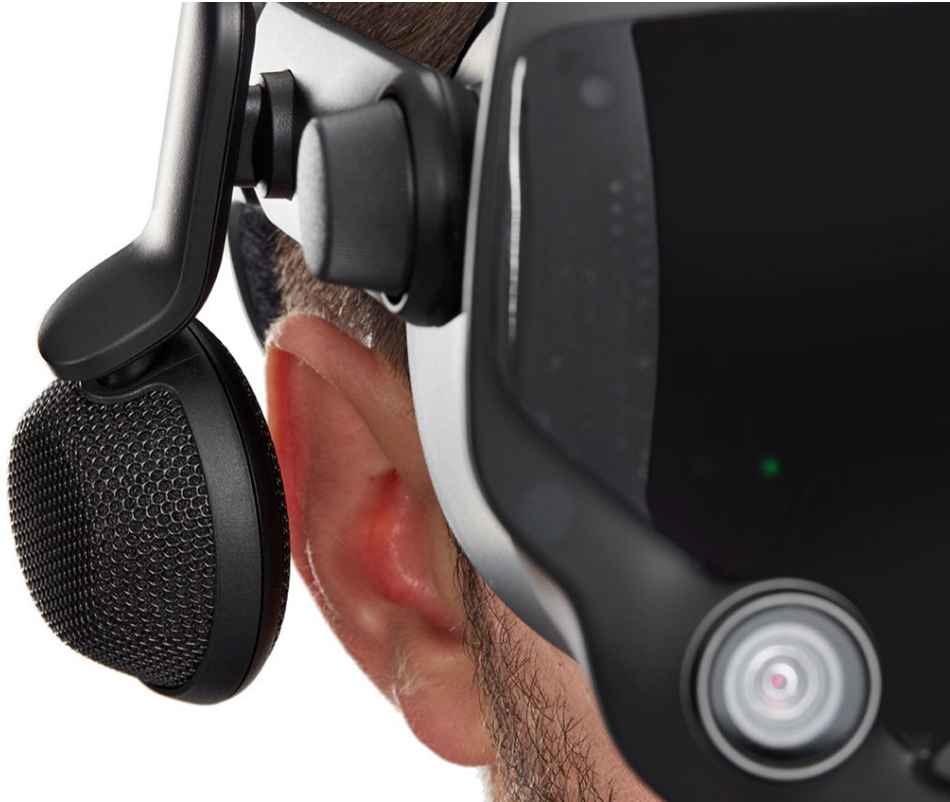
Kuva 4. Off-ear kuuloke Valven Index virtuaalitodellisuusjärjestelmässä. (Valve, 2020)