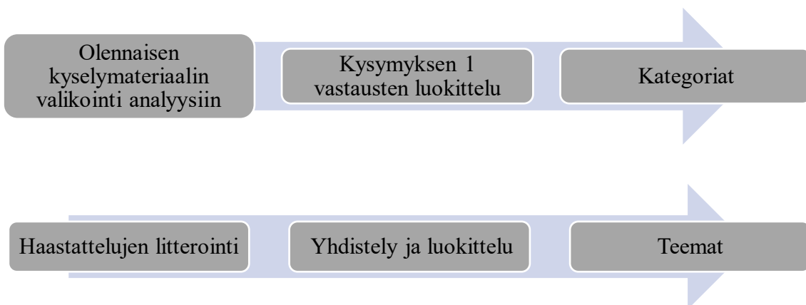
Kuvio 1. Aineiston analyysin eteneminen.

Kun sekä kyselyvastauksista että haastatteluista oli hahmoteltu kategoriat ja teemat, etsittiin näistä yhteneväisyyksiä tutkimuskysymyksiin peilaten. Analyysissa hyödynnettiin myös muita kyselytutkimuksessa kerättyjä vastauksia, joista muodostettujen taulukoiden avulla joitakin havaittuja ilmiöitä voitiin tarkentaa tai selittää. Muiden kyselyn kysymysten avoimia vastauksia ei kuitenkaan analysoitu tätä tutkimusta varten. Aineiston analyysin etenemistä kuvaa Kuvio 1.