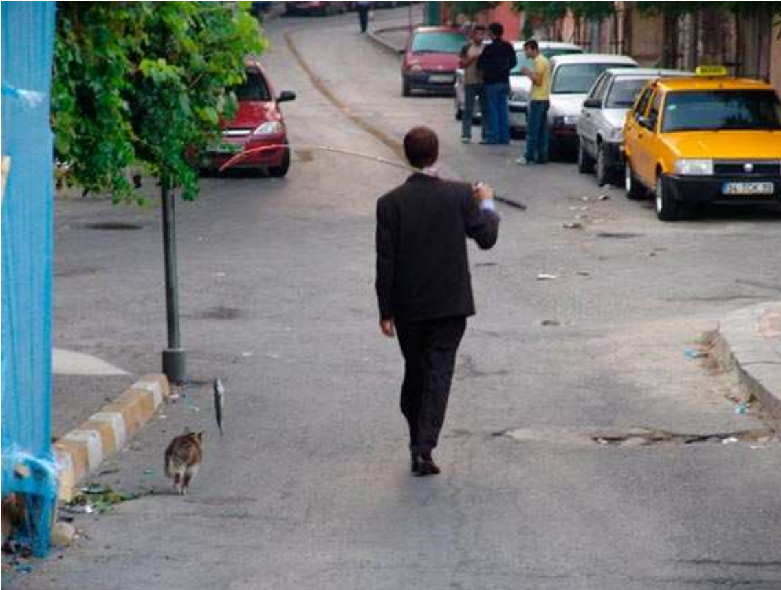
Morning Walk, 2005

tilannesidonnaista sekä harvoin pysyvää. Hän ei tee lainkaan varsinaista maalaustaidetta. Päätoimisena taiteilijana hän on toiminut noin vuoden. Hän on käynyt Karjaan Kansanopiston kuvataidelinjan, opiskellut kaksi vuotta Pohjoismaisessa taidekoulussa ja valmistunut vuonna 2006 taiteen maisteriksi Kuvataideakatemiasta. Hän on osallistunut lukuisiin ryhmänäyttelyihin ja biennaaleihin, kuten Venetsian biennaaliin 2003 ja Istanbulin biennaaliin 2005. (Hans Rosenström 2008.)