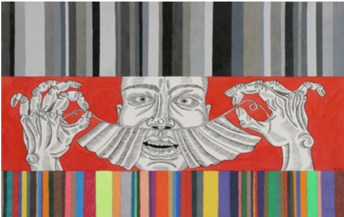
The Curtain. Mixed media on paper. 2004.