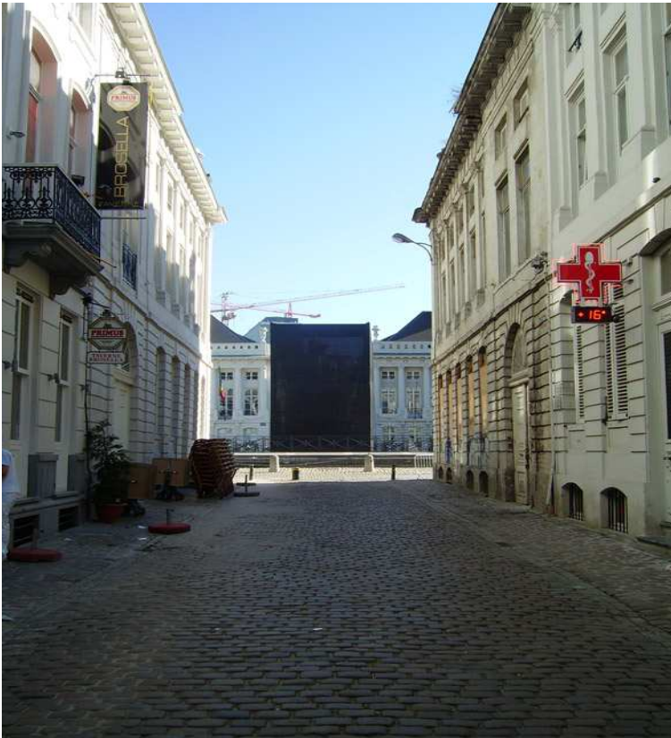
Hit of Drum. Brysselissä 2007. Belgian itsenäisyyden monumentti peitettynä mustaan laatikkoon.