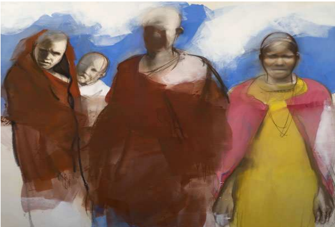
Naisryhmä, 2003–2006. Guassi paperille.