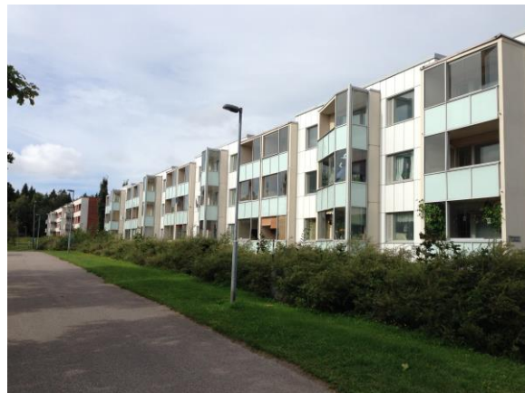
Kuva 13. Ristinummi, kerrostaloja Kappelinmäntien varressa.

Asuinkerrostalot kuvissa 10–13 eivät muodosta mielestäni itsessään yksittäisinä rakennuksina kaupunkitilaa, vaan ovat osia suuremmasta massasta. Kerrostalot hukkuvat raskaine rakennusmassoineen toisiinsa, eikä erotteluja eri talojen välillä ole helppoa tehdä. Toisin sanoen, mielestäni kuvien 10–13 kerrostalot eivät määrittele uutta kaupunkitilaa alueella, vaan tila määrittää niiden olemista. Rakennuksien arkkitehtoninen yleisilme on hyvin homogeeninen. Pelkistetty modernistinen arkkitehtuurityyli ei välttämättä aina tuota monipuolista ja virikkeellistä kaupunkitilaa.