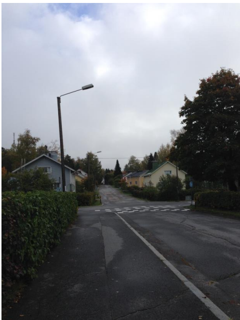
Kuva 42. Asevelikylä.

Merkittäväksi tekijäksi ja teemaksi Asevelikylän yleisessä profiilissa muodostuvat tasarvoisuuden ja tasaisuuden käsitteet. Tämä on nähdäkseni yksi tärkeimmistä huomioista suhteessa alueen yleiseen profiiliin. Poikkeamia alueella on esimerkiksi rakennusten värimaailmassa. Rintamiamiestalo-tyyppi tasapäistää kuitenkin alueen fyysistä olemusta. Alueella ei ole ruutukaavaa, vaan rakennukset ovat ryhmittyneet mutkaisten teiden varalle. Tämä seikka korostaa nähdäkseni osaltaan Asevelikylän kylämäisen tiivistä rakentumista.