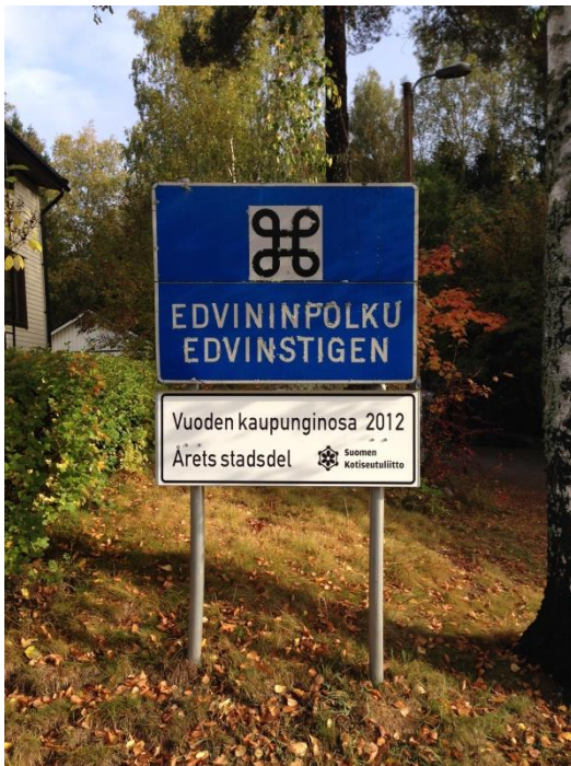
Kuva 48. Asevelikylä, Edvininpolku.