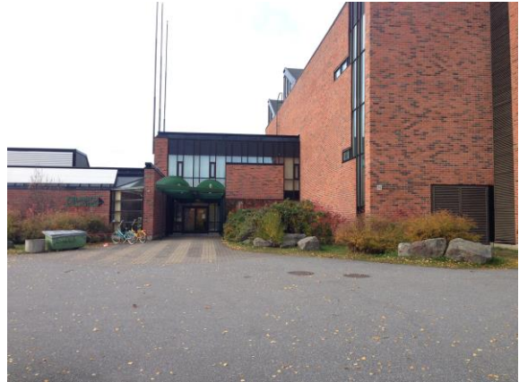
Kuva 15. Ristinummi, Variskan yläkoulu.