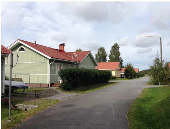
Kuva 16. Ristinummi, uudempi omakotitaloalue.