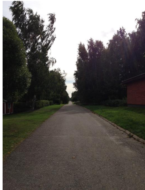
Kuva 19. Ristinummi, Ristinummenraitti.

Kuvien 18 ja 19 pitkät kevyenliikenteenväylät tuovat esiin Ristinummen infrastruktuurin rakentumista. Tiet on vedetty keskelle luontoa suorina ja pitkinä. Rakennukset ovat