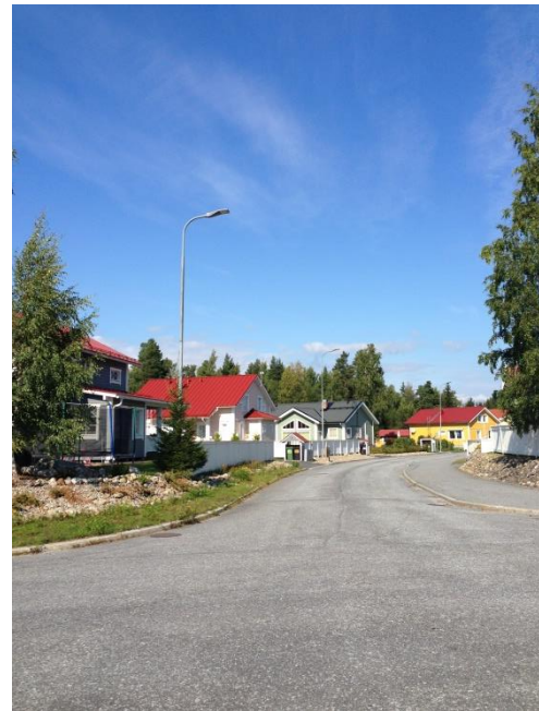
Kuva 34. Västervik, omakotitaloalue.