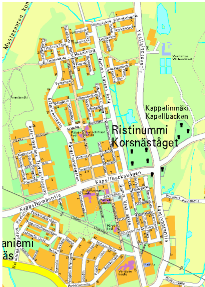
Kuva 2. Ristinummi, yleisprofiili (Vaasan kaupungin karttapalvelu 2013).

Valokuvien tulkitsemisen sekä visuaalisten metodien avulla on mahdollista pyrkiä näyttämään ympäröivästä maailmasta sekä yhteiskunnasta jotain uutta, mitä ei aikaisemmin ole tullut nähtyä tai huomattua. Vaikka valokuvat asuinalueiden fyysisestä ympäristöstä ovatkin tämän tutkimuksen pääasiallinen tutkimuskohde, voidaan asian tarkastelu aloittaa laajemmasta näkökulmasta käsin. Miltä aluerakenteet näyttäivät kartalla, yläilmoista käsin tarkastellulta?