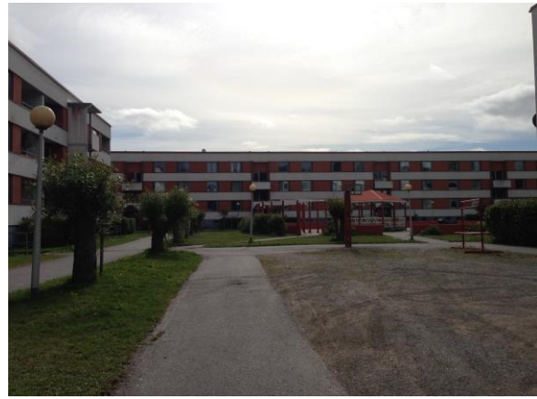
Kuva 11. Ristinummi, pihapiiri.

Kuvissa 10–12 on kuvattuna tyypillinen ristinummainen kerrostalojen muodostama pihapiiri. Suhteellisten pitkien kerrostalojen väliin jäävällä alueella on lasten leikkikenttä, sekä yleistä puistoaluetta. Pihapiirin yleisilme on hyvin hoidettu sekä siisti. Tulkin-tani kuvasta liittyy vahvasti pihapiirin mahdollistamaan sosiaaliseen kanssakäymiseen