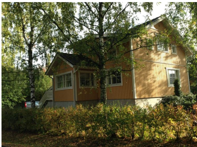
Kuva 44. Asevelikylä.