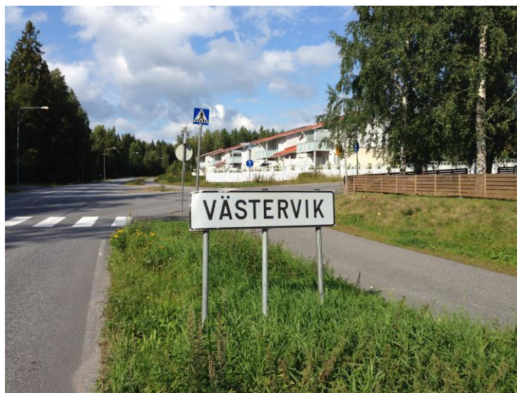
Kuva 24. Västervik, sisääntulo Gerbyn Rantatietä pitkin.

Tarkoitukseni oli kolmella Västervikissä suoritettavalla kuvauskerralla saada alueesta muodostettua kokonaisvaltaista kuvaa, joka ottaisi huomioon alueen laajan pinta-alan, sekä oletetun monimuotoisuuden. Kuvaamisen motiivina oli Västervikissäkin pohtia, mitkä tekijät parhaiten kuvaavat alueen rakenteita sekä ominaisuuksia. Tiesin alueen koostuvan suhteellisen laajasta maaseutumaisesta alueesta, venesatama-alueesta, sekä uudemmissa omakotitaloista. Alueen systemaattinen kuvaaminen edellytti näiden kaikkien osatekijöiden huomioonottamista. Alueeseen liittyy tiettyjä vahvoja stereotypioita, jotka ovat kytköksissä esimerkiksi suomenruotsalaisuuteen, meren läheisyyteen sekä yleiseen hyvinvointiin. Onnistunut alueen kartoittaminen ottaa mielestäni huomioon nämä seikat. Samalla kuvaajan tulee kuitenkin pitää mieli avoimena.