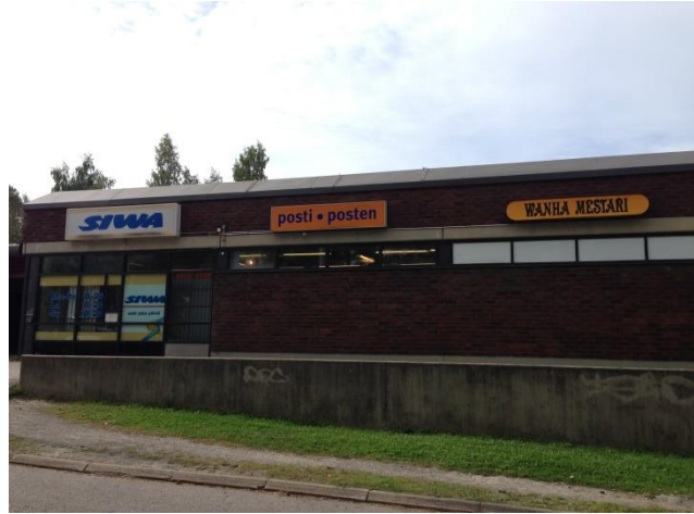
Kuva 7. Ristinummi, ostoskeskus ulkoapäin.

Kuvan 7 mainostaulut kertovat omalta osaltaan palvelujen olemassaolosta Ristinummella. Kauppa sekä samassa kiinteistössä sijaitseva postin toimisto helpottavat osaltaan asukkaiden arkielämää. Ostoskeskuksessa sijaitsevat myös kappeli, parturi-kampaamo, pizzeria sekä pubi.