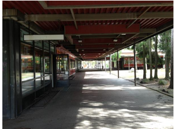
Kuva 9. Ristinummi, ostoskeskus sisältä.