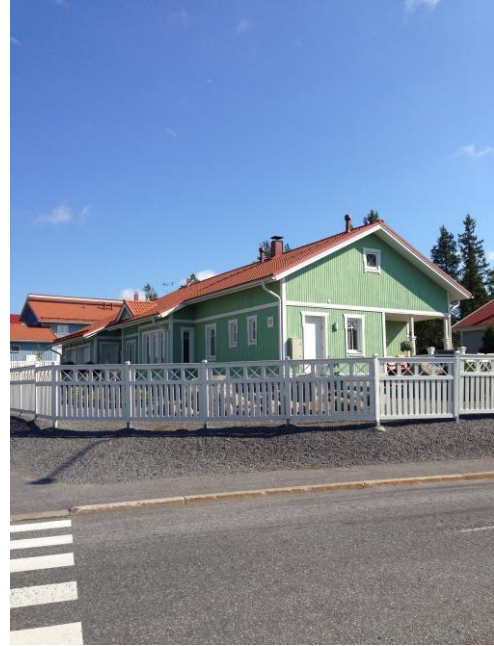
Kuva 32. Västervik, omakotitaloalue.