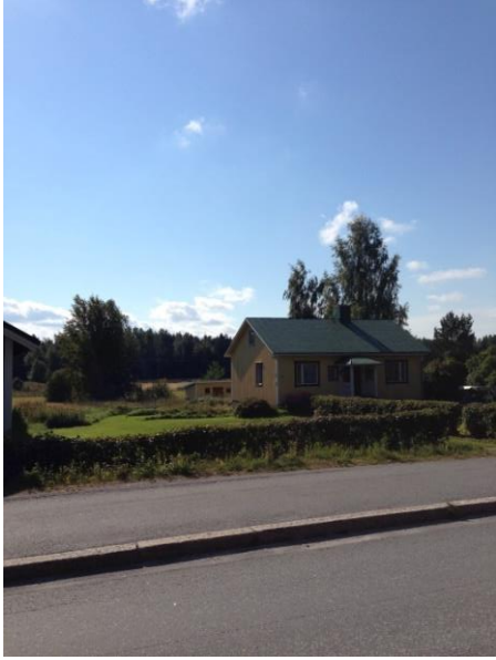
Kuva 25. Västervik, Västervikintie.

tonttien suhteellisen suuret koot, sekä rakennusten ryhmittyminen kylämäiseen tapaan nauhamaisesti tien varrelle.