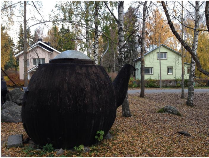
Kuva 52. Asevelikylä, Jukolanpuisto.