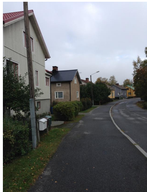
Kuva 43. Asevelikylä.