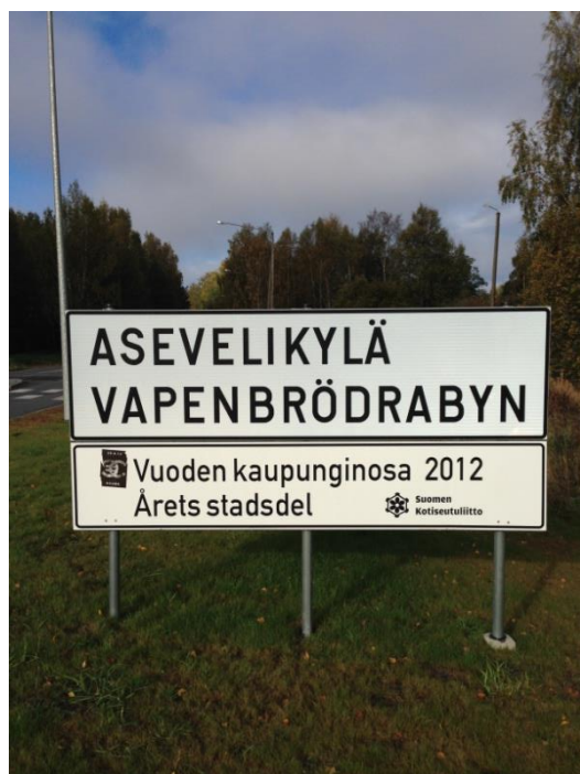
Kuva 41: Asevelikylä, sisääntulo Sepänkyläntietä pitkin.

Asevelikylän kohdalla kuvausprosessi muodostui selkeämmäksi, kuin tutkimuksessa mukana olevilla muilla asuinalueilla. Alueen suhteellisen pieni pinta-ala helpotti osaltaan kuvausprosessin tekemistä, sillä välinmatkat kohteiden välillä olivat lyhyet. Tarkoitukseni oli jälleen ottaa huomioon niitä tekijöitä ja rakenteita, jotka parhaiten kuvaavat aluetta sekä sen profiilia mahdollisimman hyvin. Lisäksi pyrin ottamaan Aseveliky- lään liitettyjä mielikuvia huomioon, joista sosiaalisuus, sosiaalinen pääoma ja kylämäi- nen ympäristö nousevat yhdeksi pääteemoista. Oma positioni suhteessa tutkimuskohtee- seen nojaa luonnollisesti myös vahvasti näihin teemoihin. Toisin sanoen, tarkastelin Asevelikylää vahvasti sosiaalisen pääoman ja yhteisöllisyyden värittämien lasien lävit- se.