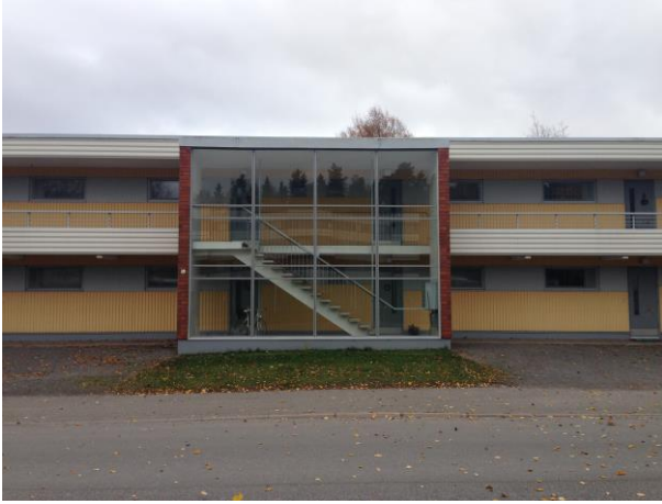
Kuva 20. Ristinummi, asuntomessualue.