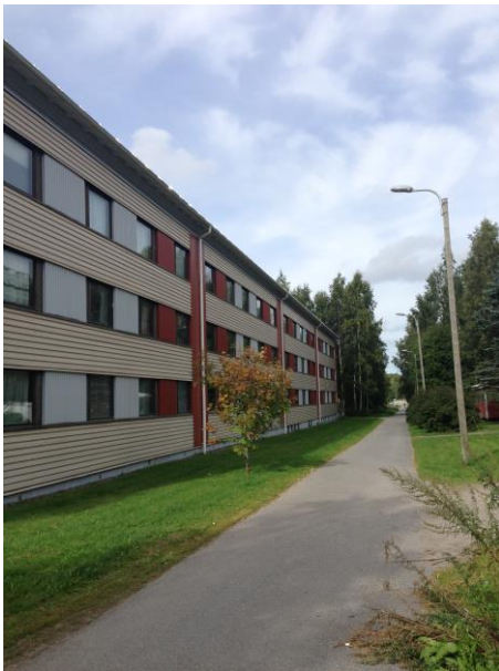
Kuva 18. Ristinummi, Pikkupiianpolku.

Kuvan 16 omakotitalot kuvastavat tyypillistä suomalaista 2000-luvun alussa rakennettua lähiötä kirkkaasti väritettyine omakotitaloineen, sekä suhteellisen kapeine liikenneväylineen. Kevyen liikenteen tarpeet on otettu hyvin huomioon. Kuvan 17 vanhempi omakotitaloalue edustaa ympäröivältä infrastruktuuriltaan hyvin paljon muuta Ristinummaa pitkin sekä leveine katuineen. Kuvien 16 ja 17 omakotitaloalueet ovat arkkitehtuuriselta ilmeeltään hyvin yhteneväiset. Poikkeuksia esiintyy lähinnä talojen värimailmoissa. Verrattuna kuvien 10–13 kerrostaloalueeseen, muodostaa alue selkeämpää kaupunkitilaa ja -kuvaa.