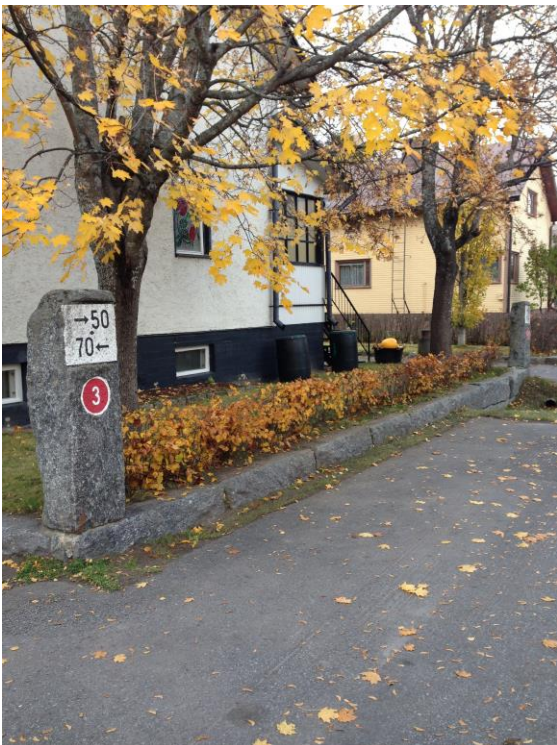
Kuva 54. Asevelikylä.