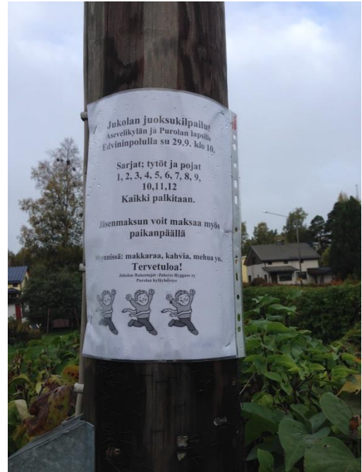
Kuva 47. Asevelikylä, ilmoitus juoksukisoista.