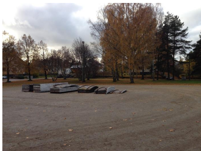
Kuva 51. Asevelikylä, Jukolanpuisto.