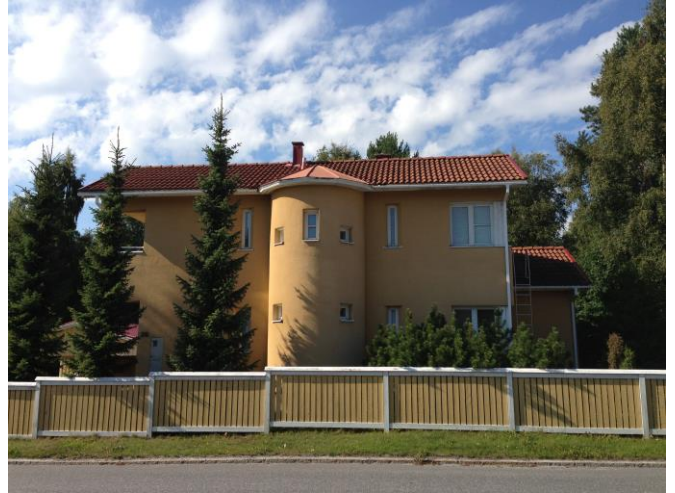
Kuva 36. Västervik, omakotitaloalue.