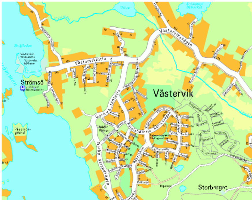
Kuva 3. Västerвик, yleisprofiili (Vaasan kaupungin karttapalvelu 2013).

Ristinummi levittäytyy kartalle pinta-alaltaan laajana kokonaisuutena. Aluetta halkoo kaksi pääväylää, joiden ympärille suurin osa asutuksesta on muodostunut. Tiet ovat suoria ja pitkiä, kuten esimerkiksi itäreunalla kulkeva Vanhan Vaasan katu, joka on yli kilometrin pitkä. Kartassa myös runsaasti vihreää väriä, mikä kertoo puistojen sekä metsien suuresta määrästä. Erikoisena piirteenä on vuoden 1975 asuntomessualueen erottaminen puustolla muusta alueesta. Asemakaava on tyypillisen modernin ajan funktionalistisen ihanteiden mukainen. Ristinummella on nähtävissä merkkejä ruutukaavasta, jonka muotoa on osittain rikottu esimerkiksi suosimalla pitkiä ja leveitä pääväyliä, joiden ympärille rakennukset ja asutus sijoittuvat.