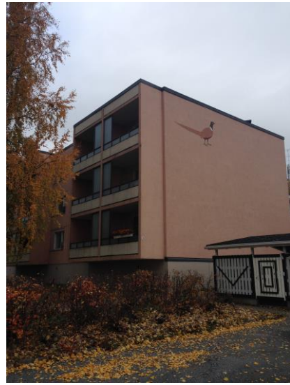
Kuva 21. Ristinummi, asuntomessu- alue.