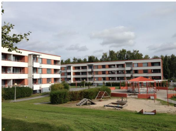
Kuva 12. Ristinummi, pihapiiri.

ihmisten välillä. Hyvin hoidettu pihapiiri voi kertoa siitä, että aluetta arvostetaan, toisin sanoen sillä on tällöin merkitystä ihmisten keskuudessa.