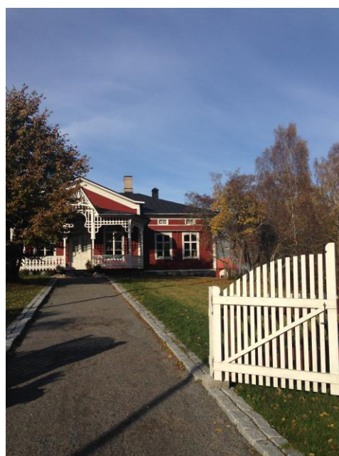
Kuva 40. Västervik, Strömsö.