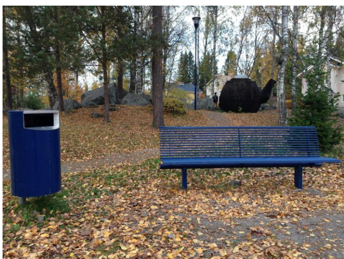
Kuva 50. Asevelikylä, Jukolanpuisto.

Kuvissa 50–55 on kuvattuna tekijöitä ja kohteita, jotka ovat omalta osaltaan määrittelemässä Asevelikylän persoonallista yleispiirrettä, sekä yleistä ilmettä. Kuvat 50–53 ovat Asevelikylän keskellä sijaitsevasta Jukolanpuistosta, jonka yhteydessä sijaitsee myös Asevelikylän koulun leikkipuisto, sekä urheilukentät. Puiston sijainti, sekä puistossa sijaitsevat taideteokset korostavat nähdäkseni Jukonpuiston merkitystä alueen asukkaille. Alue on hyvin hoidettu ja siisti. Persoonallinen yleisilme lisää nähdäkseni alueen keskinäistä yhteenkuuluvuutta, sillä taideteokset sitovat alueen liitettäväksi mielikuvissa Asevelikylään. Kuva 54 kuvaa Asevelikyläläisen talon pihaa persoonallisena sisäänkäynnillään. Vastaavia asuintalojen edustojen koristeluita on Asevelikylän alueella runsaasti.