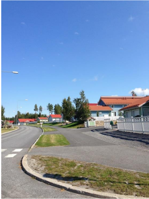
Kuva 31. Västervik, omakotitaloalue.

Kuvat 31–34 ilmentävät Västervikin tiheimmin rakennettua omakotitaloaluetta, jota kutsutaan myös Rajarinteeksi. Alue on tiivis ja rakennuskannaltaan hyvin yhtenäinen kokonaisuus ja se edustaa samalla Västervikin alueen ainoaa perinteistä kaupunkimaista tiivistä omakotitaloaltaista lähiöaluetta. Tässä suhteessa se poikkeaa paljon maaseutu- maisesta ympäristöstään.