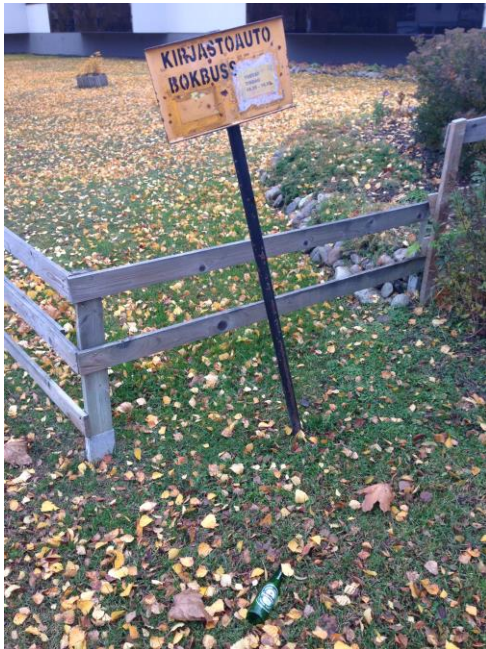
Kuva 22. Ristinummi, asuntomessualue.