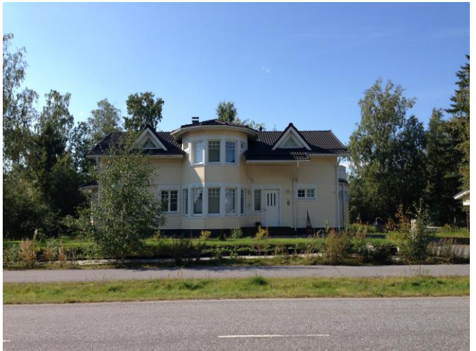
Kuva 38. Västervik, omakotitaloalue.