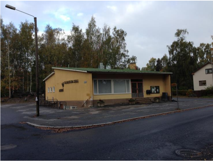
Kuva 46. Asevelikylä, talkootöin rakennettu koulu.