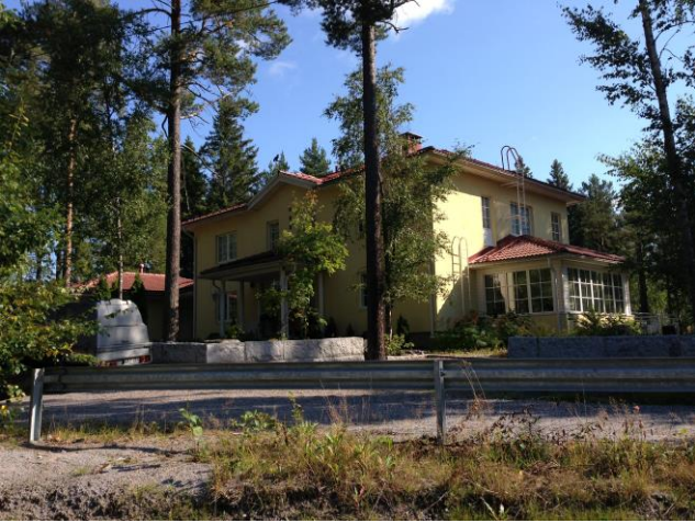
Kuva 35. Västervik, omakotitaloalue.