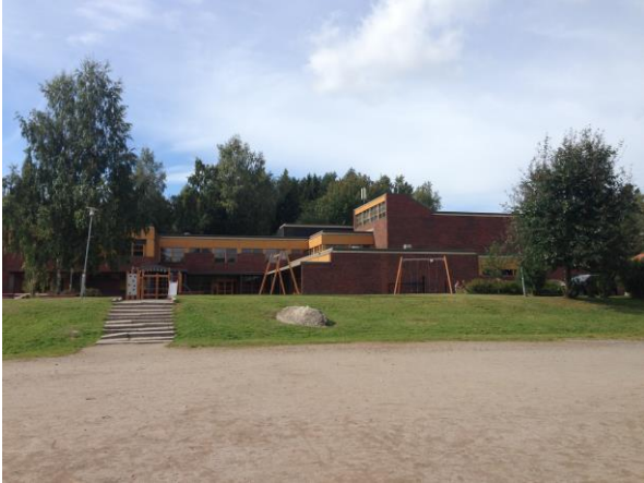
Kuva 14. Ristinummi, Nummen koulu.

kokoontumispaikoilla saattaa olla sosiaalisuutta ja sosiaalista pääomaa vahvistavaa vaikutusta, liittyvät niiden teemat sitten kulttuuriin tai urheiluun.