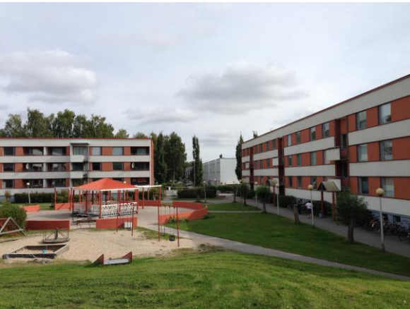
Kuva 10. Ristinummi, pihapiiri.