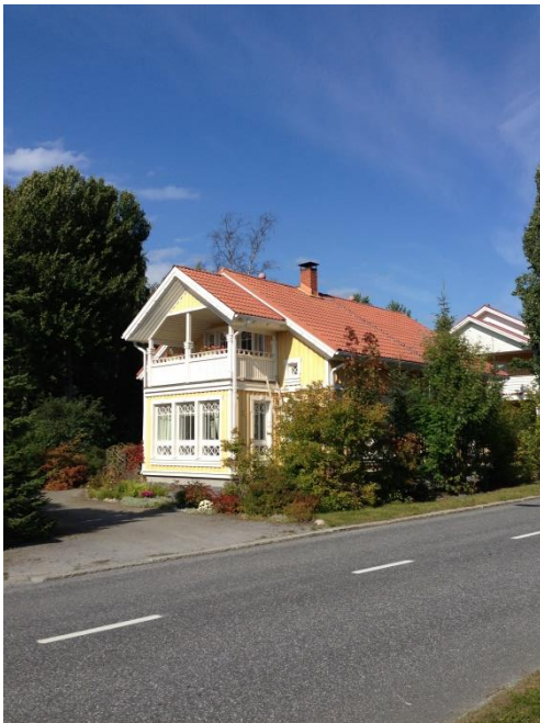
Kuva 37. Västervik, omakotitaloalue.