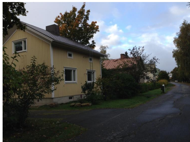
Kuva 45. Asevelikylä.

Kuvat 46–49 pyrkivät tuomaan esiin perusteita ja näkökulmia ensinnäkin alueen valintaan vuoden kaupunginosaksi ja toiseksi alueen kylämäisen ympäristön tarjoamiin mahdollisuuksiin. Sosiaalisen pääoman käsite nousee tässä suhteessa tarkastelua oleellisiksi. Asevelikylän alueella on nähtävissä lukuisia esimerkkejä yhteisöllisyydestä, sekä alueen asukkaiden omasta aktiivisuudesta. Tätä näkökulmaa vahvistaa nähdäkseni esimerkiksi kuvan 46 asukkaiden talkootyöllä rakentama kyläkoulu, tai pienemmässä mitakaavassa mikrotasolla kuvan 47 lapsille järjestetty juoksukilpailu.