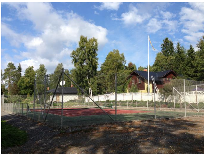
Kuva 39. Västervik, Strömsö.

Tarkasteltaessa aluetta sellaisena, kuin se ohikulkijalle ilmenee, nousee esiin tiettyjä Västervikiä kuvaavia tekijöitä. Maaseutumaisen ympäristön sekoittuminen modernimpaan omakotitaloasumiseen on yksi tekijä. Toiseksi, tonttien ja talojen koot ovat suuria verrattuna esimerkiksi Rajarinteen alueeseen.