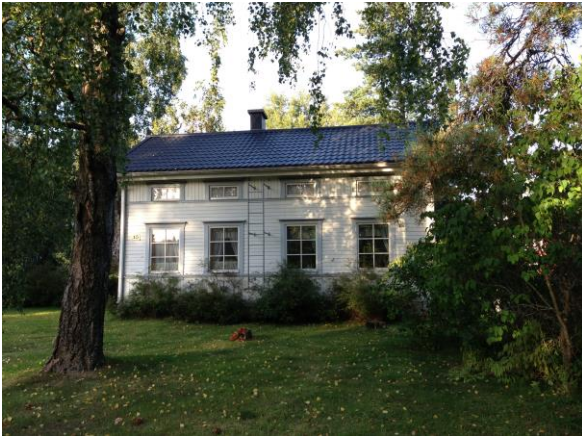
Kuva 27. Västervik, Västervikintie.