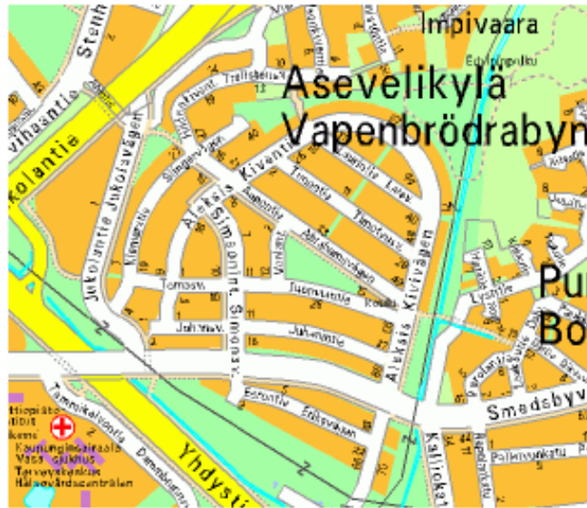
Kuva 4. Asevelikylä, yleisprofiili (Vaasan kaupungin karttapalvelu 2013).

teemaa on uudella omakotitaloalueella myöhemmin jatkettu. Puustoa sekä viljelyksessä olevaa peltoa on alueella runsaasti, vaikka uudempi omakotitaloalue onkin vanhaa, kylätien varrella olevaa asutusta tiiviimmin rakennettu.