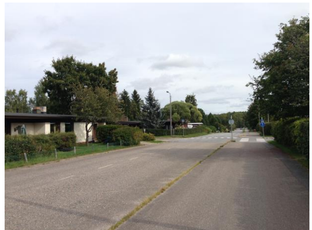
Kuva 17. Ristinummi, omakotitaloalue.

Kuvat 16 ja 17 kuvaavat Ristinummen pohjoispuolella olevaa pinta-alaltaan suhteellisen suurta omakotitalojen keskittymää. Joukossa on sekä uudempia, että vanhempia omakotitaloja. Alue sijaitsee hieman syrjässä alueen pääliikenneväylistä, sekä keskusalueesta,