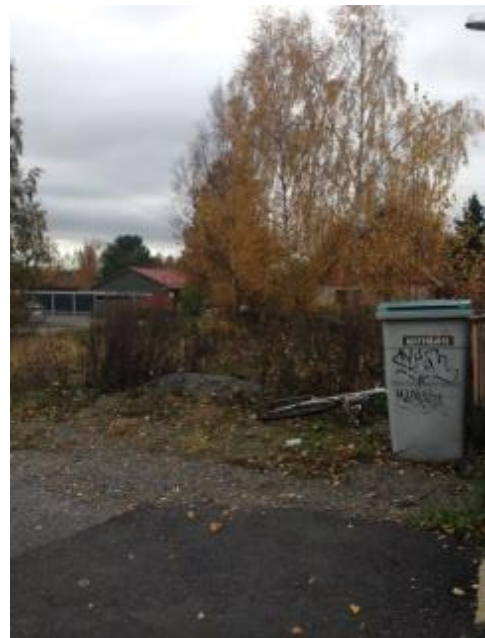
Kuva 23. Ristinummi, asuntomessualue.