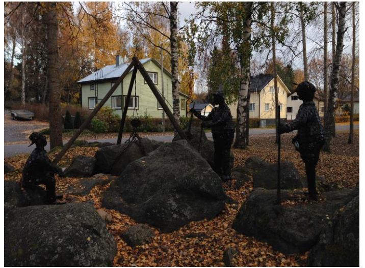
Kuva 53. Asevelikylä, Jukolanpuisto.