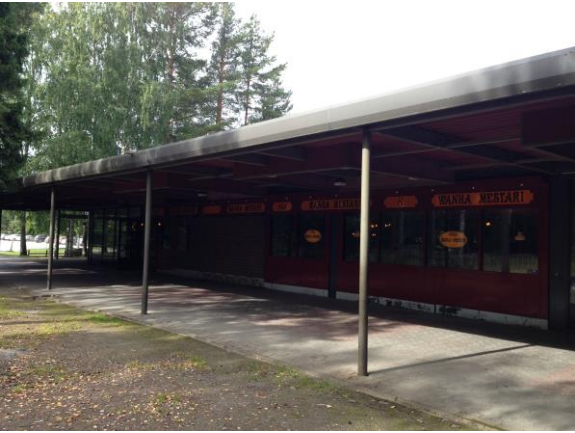
Kuva 8. Ristinummi, ostoskeskus sisältä.