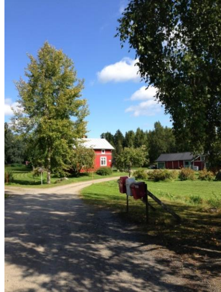
Kuva 26. Västervik, Västervikintie.