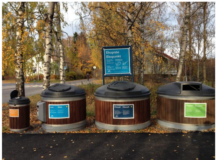
Kuva 55. Asevelikylä, Aleksis Kiventie.