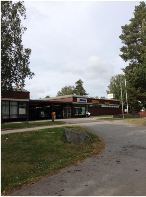
Kuva 6. Ristinummi, ostoskeskus ulkoapäin.