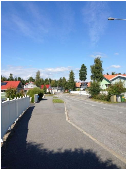
Kuva 33. Västervik, omakotitaloalue.