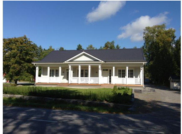
Kuva 28. Västervik, Västervikintie.