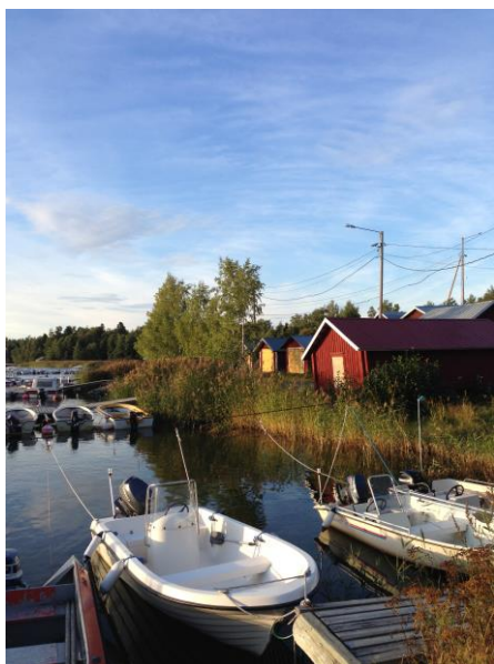
Kuva 29. Västervik, venesatama.

Veneiden suuresta määrästä päätellen esimerkiksi kalastuksella ja purjehtimisella voidaan nähdä olevan arvoa alueen asukkaiden keskuudessa. Sen lisäksi, että veneily- ja purjehduskulttuuri saattaa vahvistaa tiettyjä mielikuvia esimerkiksi suomenruotsalaisuudesta, se voi osaltaan nostaa esiin tiettyjä taloudelliseen pääomaan liittyviä seikkoja.