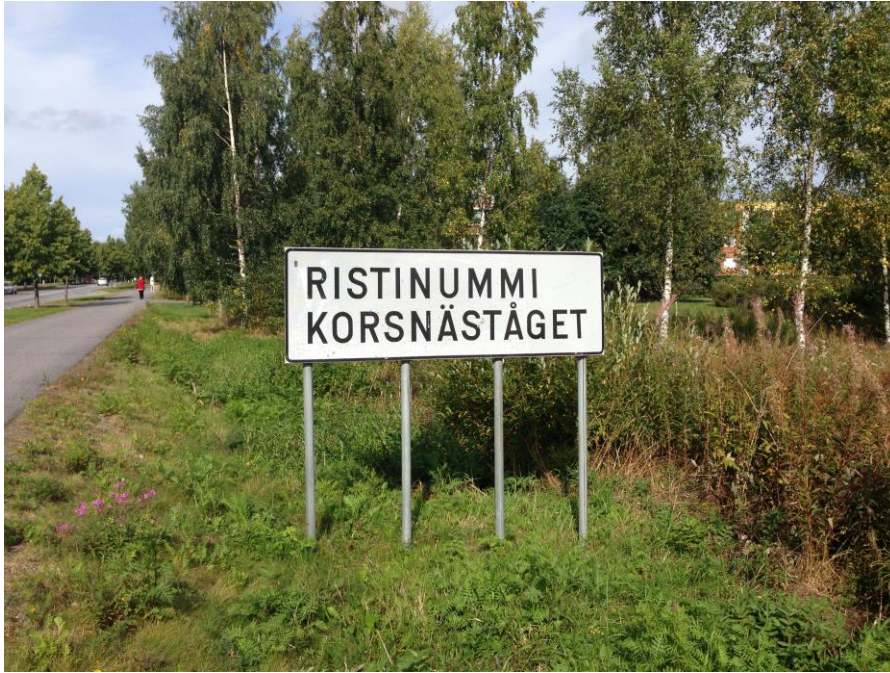
Kuva 5. Ristinummi, sisääntulo etelästä Vanhan Vaasan katua pitkin.

Aloitin kuvaamisprosessin Ristinummen keskusalueesta, missä sijaitsevat alueen tärkeimmät palvelut, kuten esimerkiksi posti, kirkko ja kauppa. Keskusalue on rakenteeltaan ja kokonaisuudeltaan hyvin tiivisti rakennettu, ja se muistuttaa paljon aikakautensa muita lähiöissä sijaitsevia ostoskeskuksia, kuten esimerkiksi Vaasan Suvilahden tai Helsingin Munkkivuoren vastaavia.