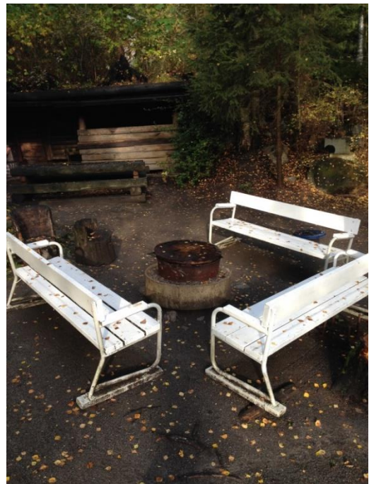
Kuva 49. Asevelikylä, Edvininpolku.