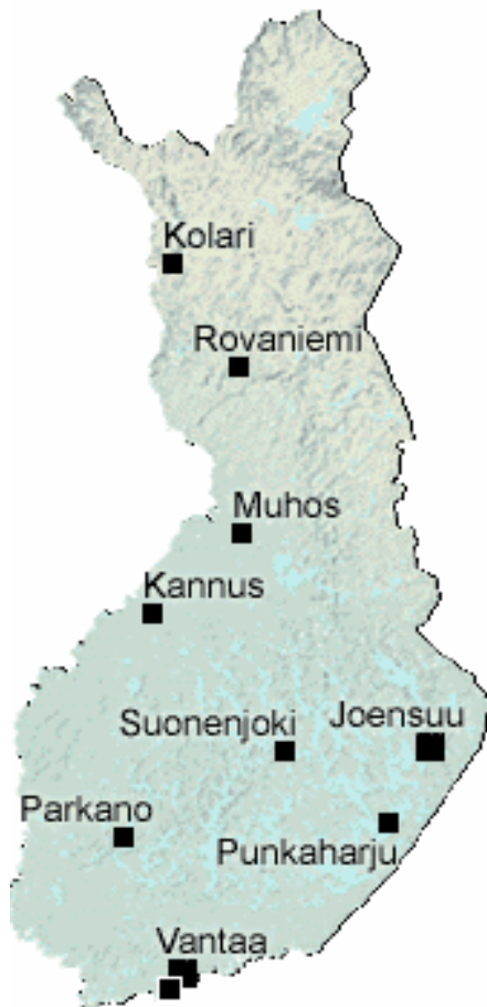
Kuva 1 Metlan toimintayksiköt (Metsäntutkimuslaitos 2008).

Metlan tutkimustoiminta on jakautunut eri puolella Suomea sijaitseviin toimintayksiköihin, jotka on sijoitettu kuvassa 1 Suomen kartalle.