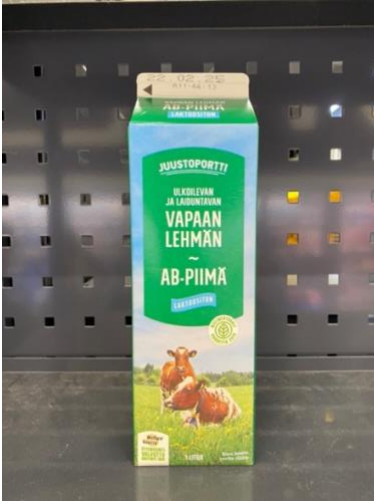
Kuva 2. Juustoportin Vapaan lehmän AB-piimä -pakkauksessa vihreää väritystä on tekstin taustaväriinä sekä kuvan nurmessa ja etuetiketin sertifikaatissa ja merkissä.

Vihreää väriä oli myös monissa vastuullisuudesta kertovissa merkeissä, kuten luomumerkissä, erilaisissa kierrätysmerkeissä, "Arla Tuottajat" -merkissä ja Juustoportin "Hiilineutraali vuodesta 2019" -merkissä. Valion punaisessa täysmaitopakkauksessa vihreää väriä oli ainoastaan korkin ympärillä olevan kierrätysmateriaalista kertovan tekstin taustaväriinä, mutta näin väri ja teksti erottui punaisesta pakkauksesta hyvin.