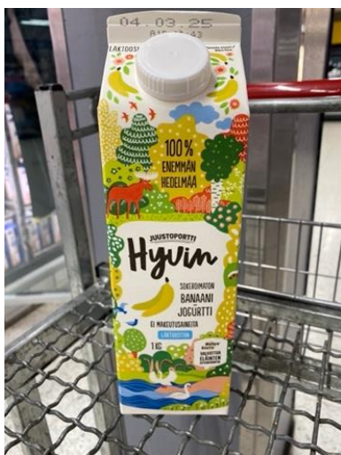
Kuva 8. Pakkauksissa oli runsaasti luontoaiheista kuvitusta.

tai vesistöön. Pakkausten grafiikat liittyivät pääosin luontoteemoihin, kuten puihin, puun lehtiin, marjoihin, hedelmiin, metsän eläimiin tai ylipäänsä maapalloon ja biodiversiteettiin (kuva 8).