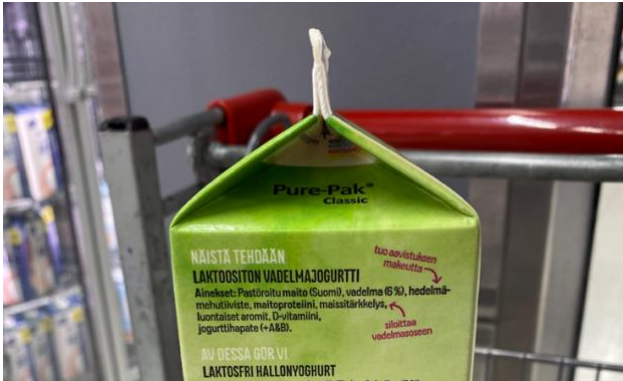
Kuva 1. Esimerkki Arlan Luonto+-jogurtin ainesosaluettelon selitteistä.

Arla puolestaan on lisännyt Luonto+ -vadelmajogurtin ainesosaluetteloon selitteitä siitä, miksi tietty ainesosa on tarpeellinen. Esimerkiksi maissitärkkelyksen kohdalla lukee ”silottaa vadelmasoseen” (kuva 1). Tällaisilla selitteillä yritys viestii läpinäkyvyydestä ja pyrkii luomaan kuluttajalle mielikuvan luonnollisesta ja ymmärrettävästä tuotesisällöstä.