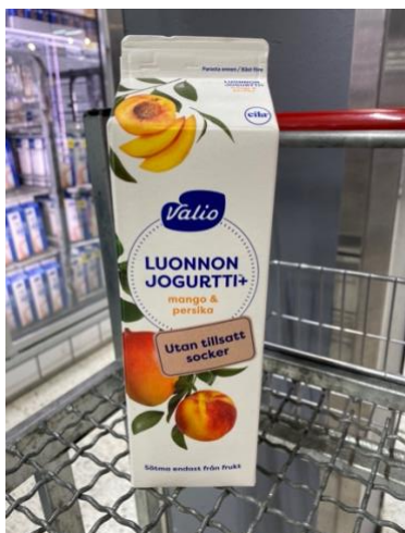
Kuva 10. Valion Luonnonjogurtti+-pakkauksen valkoinen väritys voi luoda mielikuvan puhtaasta ja turvallisesta tuotteesta. Tässä pakkauksessa myös toisen etuetikettipinnan teksti oli käännetty ruotsiksi.

Sosiaalinen vastuullisuus korostui myös sanallisessa viestinnässä. Usein pakkauksissa osa teksteistä oli myös ruotsiksi, vaikka se ei ole yksikielisissä kunnissa pakollista (Ruokavirasto 2025d). Toisaalta kaksikielisillä pakkauksilla valmistaja varmistaa sen, ettei sen tarvitse suunnitella kahta eri kielillä olevaa pakkausta, vaan yksi pakkaus sopii molemmille kielialueille. Pakkauksen takapinnan pakolliset merkinnät, kuten ravintosisältö ja ainesosaluettelo olivat kaikissa pakkauksissa suomeksi ja ruotsiksi. Sen lisäksi muutamissa tuotteissa myös tuotenimi, kuten ”kevytmaito” oli ruotsiksi vähintäänkin pakkauksen yläosan kaltevassa pinnassa. Muutamassa pakkauksessa myös markkinointipinnan tekstit oli käännetty ruotsiksi, kuten esimerkiksi Valion Gefilus AB-piimä -pakkauksessa.