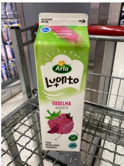
Kuva 4. Arlan tuotteissa suosittiin lintuaiheista kuvitusta.

Lintuaiheinen kuvitus vaikutti olevan Arlan tämänhetkinen tapa kuvittaa muitakin tuotteitaan. Esimerkiksi Luonto+ -vadelmajogurtin pääkuvana on vadelma, jolle on piirretty linnun nokka, siivet ja jalat (kuva 4). Pakkauksen markkinointipinnalla Kamut-pelin yhteydessä on samanlainen lintumainen kuvitus banaanista ja mustikasta. Tässä pakkauksessa ei kuitenkaan mainita BirdLife-yhteistyöstä mitään. Takapinnan kierrätyskuvion päällä istuu pieni orava. Tällaisilla eläin-, marja- ja hedelmäaiheisella kuvituksellaan Arla haluaa mahdollisesti viedä kuluttajan huomiota pois lehmistä. Muidenkin tarkasteltujen jogurttipakkausten kuvitus oli ilman lehmän kuvia ja koostui luontoon liittyvästä kuvituksesta, tarjoiluehdotuksesta tai jogurttimakuun viittaavasta kuvasta. Esimerkiksi Juustoportin Hyvin -banaanijogurttipakkauksen kuvituksena oli runsas ja värikäs metsäaiheinen grafiikka. Metsässä kävelee hirvi, linnut lentävät taivaalla ja joutsenet uivat lammessa. Juustoportin maustamattoman AB-jogurtin etuetiketissä on puolestaan kulhollinen jogurttia, jonka päällä on vadelmia ja myslä. Arlan mustikkajogurtin pakkaukuvituksena on mustikoita. Tuotepakkausten kuvat saattavat välittää kuluttajalle mielikuvaa kasviperäisestä tuotteesta ja terveyttä tukevasta ravinnosta.