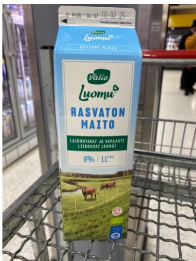
Kuva 3. Valion sininen logo vaihtui luomutuotteissa vihreäksi.

Maitopurkit ovat Suomessa olleet tyypillisesti sinivalkoisia väritykseltään. Värityksellä on pitkät perinteet ja se tuo mieleen suomalaisen, puhtaan ja raikkaan maidon. Sinisen sävyt vaihtelevat purkeissa rasvapitoisuuden mukaan. Sinistä väriä oli kaikissa tutkimuksessa mukana olleissa pakkauksissa. Maitopurkeissa sininen väri oli hallitsevin. Vaikka joidenkin pakkausten, kuten Arlan AB-piimäpakkauksen, pääväriytyys oli vihreä, löytyi sinistä kuitenkin yksityiskohdista kuten Hyvää Suomesta-merkistä ja pakkauskuvituksen yksityiskohdista, kuten linnusta.