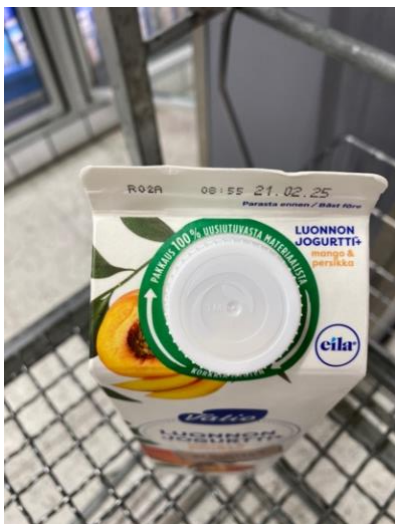
Kuva 7. Valio kertoi pakkauksen olevan ”100 % uusiutuvasta materiaalista korkkia myöten”.

Juustoportin pakkauksissa oli lisäksi ”10 % vähemmän puuta” -merkintä. Kuluttajan on kuitenkin vaikea merkin perusteella tietää, mihin merkillä tarkalleen ottaen viitataan, eli mikä on vertailukohde tai -ajankohta. Siitä huolimatta tällainen merkintä voi luoda kuluttajalle mielikuvan, että yritys pyrkii toimimaan vastuullisesti.