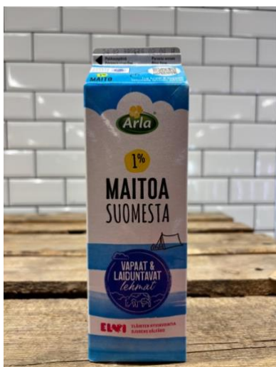
Kuva 11. Arlan tuotteissa suomalaisuutta korostettiin usein jo tuotenimen yhteydessä.

ympärillä oli teksti, että ”valmistettu Sipoossa”. Muutamissa Arlan tuotteissa on myös Hämeenlinnan osuusmeijerin logo. Suomalaisuutta korostamalla yhtiö kertoo, että se tuottaa taloudellista hyötyä nimenomaan Suomeen esimerkiksi veronmaksun ja työpaikkojen muodossa.