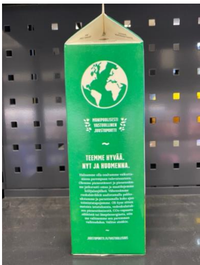
Kuva 5. Juustoportin Vapaan lehmän AB-piimä -pakkauksen markkinointipinnan kuvituksena oli maapallo.

Pakkauksissa oli paljon myös yksittäisiä pieniä graafisia elementtejä, jotka voivat luoda tietynlaisia mielikuvia tuotteesta. Esimerkiksi Arlan mustikkajogurtissa merkintä ”1 kg” oli kirjoitettu maitotonkkaa muistuttavan grafiikan sisälle ja Valion luomumaidossa sanan ”luomu” jälkeen oli sydän. Arlan Luonto+ -jogurtin takapinnan info-osion alakulmassa on kuva metsästä, jonka keskellä on maitopurkin muotoinen talo, ja vierellä kerrotaan, että pakkaus on täysin puupohjainen. Valion Hyvä suomalainen arkijogurtti vanilja -pakkauksessa oli yhtenä graafisena elementtinä myös Suomen lippu. Muutamissa Juustoportin pakkauksissa oli myös kuvalliset ohjeet pakkauksen litistämisestä. Pakkauksissa oli grafiikkaa myös erilaisina sertifikaatteina, logoina ja merkkeinä. Näistä kerrotaan lisää luvussa 4.1.4.