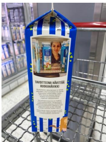
Kuva 9. Juustoportin kevytmaitopakkauksessa viestittiin yrityksen teoista ruokahävikin vähentämiseksi.

9). Ympäristövastuuseen viittasi myös osa tuotenimistä itsessään, kuten Luonnonjogurtti+ ja Luonto+. Luonto tuo jo itsessään kuluttajan mieleen ympäristön, ja plusmerkki saattaa vielä vahvistaa mielikuvaa, että kyseessä on jokin ympäristön kannalta poikkeavan hyvä tuote.