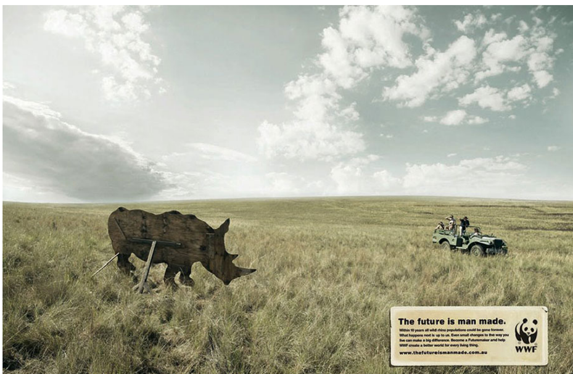
Kuva 1. Mainoskuva eläinten suojelusta.

Katsoessa mainoskuvaa 1 denotatiivisella tasolla eli tarkastellen objektiivisesti, mitä kuva esittää ja näyttää, katseeni kiinnittyy ensimmäisenä sarvikuonon ulkomuotoa muistuttavaan puiseen siluettiin, joka on kuivan näköisellä ruohoalueella. Kuvan miljöönä näyttää hyvin kuivalta, ankealta ja elottomalta. Ainoa elämän merkkiä kuvastaa ihmiset, jotka tarkkailevat taustalla puista sarvikuonoa safarityyllisestä ajoneuvostaan. Ruohikko peittää puolet kuvasta horisonttiin asti ja kuvan yläpuolisko kuvaa harmahtava taivas, jossa on paljon pilviä. Kuvan värimaailma on hyvin laimea ja mitään räikeämpiä värejä ei kuvassa esiinny ollenkaan ja näin katsojassa herätetään mielikuvia elottomuudesta. Elottomuus ruohikkoalueen ympäristössä viittaa siihen, että kaikki siellä eläneet eläimet ovat kuolleet sukupuuttoon ja monet kasvilajit kadonneet ruohoa lukuun ottamatta. Laimaan värimaailman avulla pyritään vetoamaan katsojan tunteisiin ja herättämään huolta kuvassa esitetystä tulevaisuuden representaatiosta. Kuvan oikeassa alareunassa on tekstilaatikko, jossa lukee ”Tulevaisuus on ihmisten luoma. Kymmenen vuoden sisällä kaikki villisarvikuonot voivat kadota lopullisesti. Se, mitä