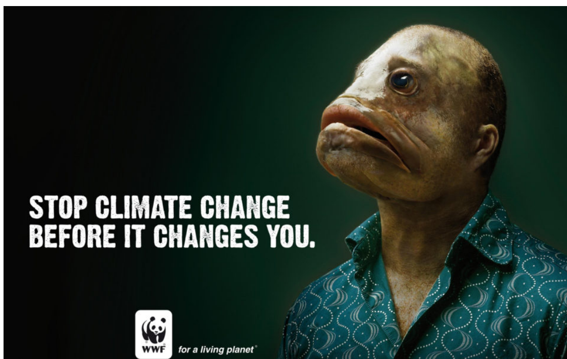
Kuva 12. Mainoskuva ekosysteemin tasapainosta.

Ensimmäiseksi kuvassa 12 denotatiivisesti huomio kiinnittyy ihmisen ja kalan näköiseen yhdistelmään, jossa ihmisen pään tilalla on kalan pää. Kuvan värimaailma on yhdistelmä tumman vihreää ja mustaa. Tausta on muutoin musta, mutta hahmon kohdalla tausta on vihertävä ja valotuksen avulla hahmo korostuu esiin. Tumma tausta korostaa synkkää tunnelmaa ja viestii viestin aiheen vakavuudesta. Ihmisen ja kalan hybridi on omituisen näköinen ja ilman kuvaan liitettyä tekstiosuutta kuvan kontekstia olisi vaikea päätellä. Tekstiosuudessa lukee "Lopeta ilmaston muutos ennen kuin se muuttaa sinut". Kuvan