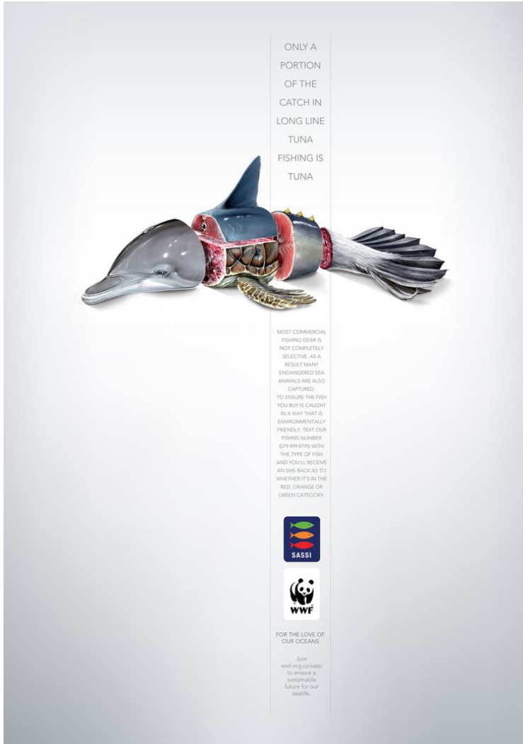
Kuva 11. Mainoskuva ylikalastuksesta.

Kuvan 11 viesti ei aukea ilman tekstiosuuksia, mutta ne lukemalla ymmärtää nopeasti, että eläinhybridi toimii metaforana sivullisille tonnikalan kalastuksen uhreille. Vaikka kuva on epäaito ja selkeästi muokattu, tässä yhteydessä liioittelu ja epäaidon eläinhybridin kuvastaminen luo ongelman hyvin ymmärrettäväksi ja näkyväksi. Kuva vetoaa vahvasti tunteisiin herättämällä myötätuntoa kuolleita eläimiä kohtaan. Lisäksi mainos hyödyntää ironiaa, jonka avulla katsoja saadaan ajattelemaan omia kulutustottumuksiaan tonnikalan ostamisen suhteen. Viestin avulla katsoja ymmärtää, että tonnikalaa ostaessa, vaikuttaa myös muihin merieläimiin. Mainos tarjoaa kuitenkin ratkaisun informoimalla, kuinka voi selvittää onko ostettava kala pyydetty ympäristöystävällisellä tavalla. Tämä informaation avulla pyritään vetoamaan katsojan