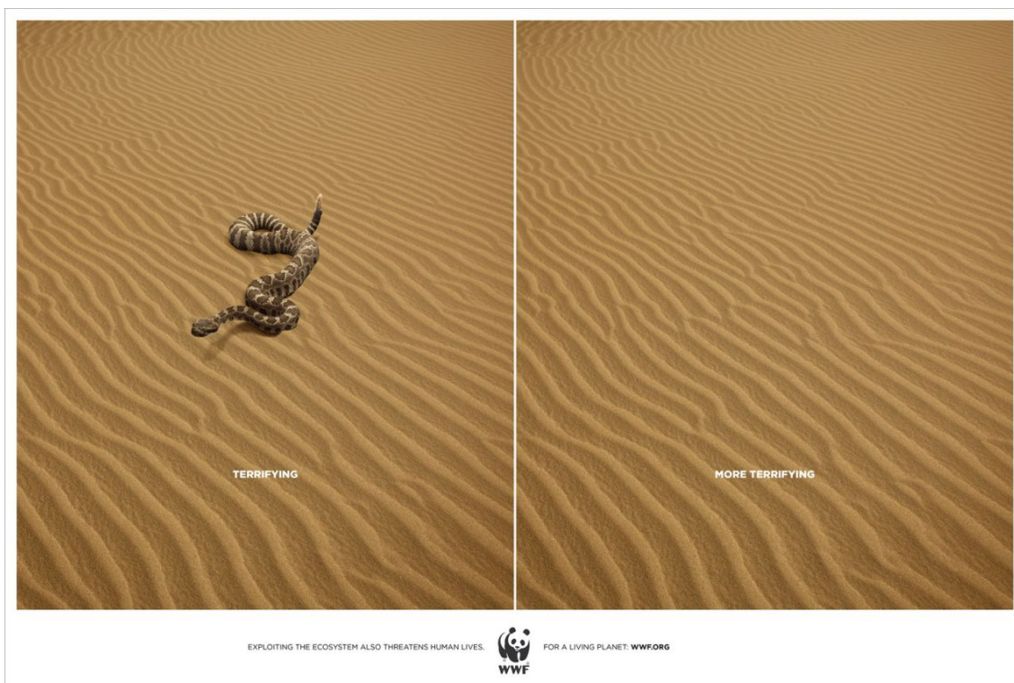
Kuva 2. Mainoskuva eläinten suojelusta.

Kuva 2 on hyvin yksinkertaisen näköinen, mutta sen viesti on vahva ilman suurempia ja monipuolisempia visuaalisia elementtejä. Kuvan denotaatio on se, että kuva on jaettu kahteen ruutuun, jossa vasemmalla näkyy hiekka-alue, jonka keskellä näkyy käärme. Käärmeen alapuolella on teksti, jossa lukee ”Pelottava”. Kuvan oikealla puolella näkyy sama hiekka-alue, mutta siinä ei näy käärmettä ollenkaan. Kuvaan on liitetty teksti, jossa lukee ”Vielä pelottavampi”. Kuvan alaosaan on liitetty teksti, jossa lukee ”ekosysteemin hyväksikäyttö uhkaa myös ihmishenkiä” sekä WWF:n logo, slogan ja verkko-osoite. Kuvan värimaailma on yksinkertainen ja se helpottaa viestin ymmärrettävyyttä ja tekee kuvasta visuaalisesti selkeän.