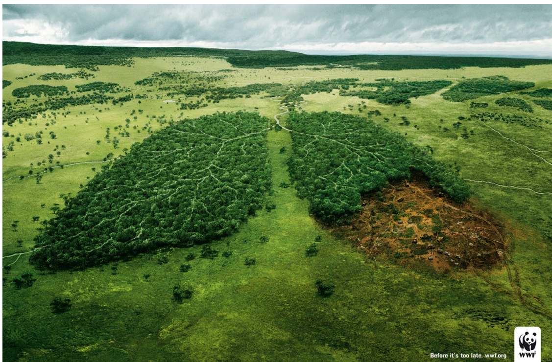
Kuva 5. Mainoskuva metsien suojelusta.

Mainoskuva 5 tarkasteltaessa denotatiivisella tasolla ensimmäisenä esiin nousee vihreä väri sekä metsiköiltä näyttävät alueet, jotka ovat ihmisen keuhkojen muotoisessa asetelmassa. Oikean puoleisen keuhkon muotoisen metsikön alaosa puuttuu puolet ja se näyttää tumman ruskean väriseltä. Värimaailmaltaan kuvan metsikkö on kirkkaan vihreään väristä, mutta silti kuvasta välittyy melko synkkä ja ankea vaikutelma. Etenkin kuvan oikea puolisko näyttää tummalta ja siinä metsikköä ympäröivä maasto on sotkuinen ja myllätty. Kuvassa ruskea alue kuvastaa maaperää, josta raikkaan vihreät kasvit ja puut on poistettu. Kun katsoo tarkasti, ruskealla alueella voi nähdä rakennuskalustoa sekä jonkinlaisia kulkuvälineitä. Kulkuvälineitä denotoidaan myös kuvan oikeassa alalaidassa olevien kulkuneuvojen renkaan jälkien avulla. Kuva konnotoi