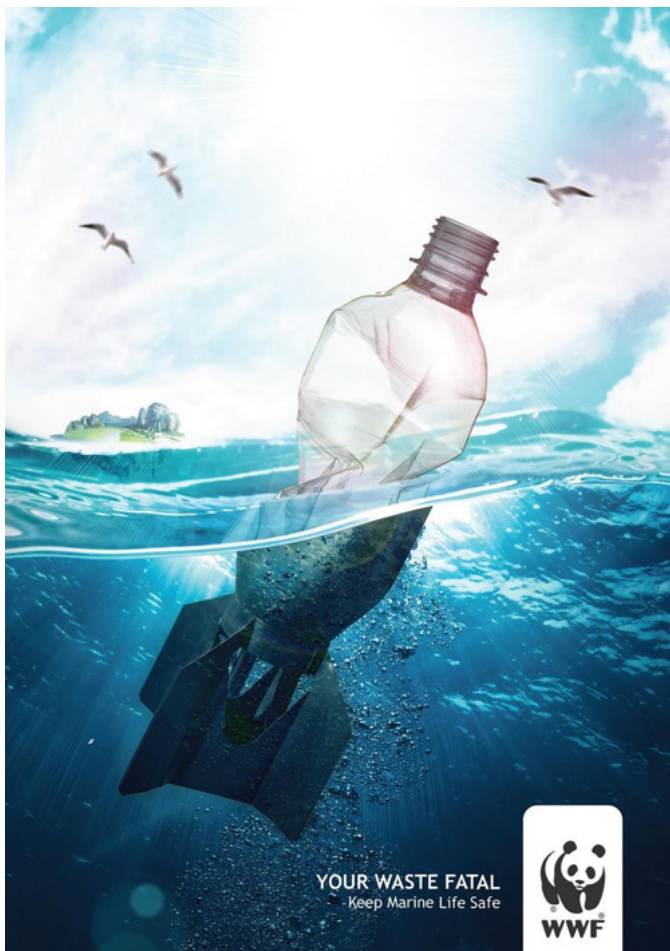
Kuva 3. Mainoskuva vesistöjen suojelesta.

Kuvassa 3 denotatiivisella tasolla konkreettisesti näkyy vesistö, jonka pinnan yläpuolella näkyy muovipullo, kun taas pinnan alapuolella pullo näyttäytyy pommina. Tämän lisäksi kuvan yläpuolella näkyy kirkas aurinkoinen maisema ja pinnan alapuolella on pimeää ja synkkää. Kuvan oikeassa alareunassa näkyy WWF:n logo ja lyhyt teksti ”Sinun jätteesi on kuolettavaa. Pidä merenelävät turvassa”. Kuvan viesti on nojaa vahvasti visuaalisuuteen ja se on hyvin ymmärrettävissä ilman mitään tekstuaalisuutta. Kuva konnotoi sitä, kuinka yksinkertaisen näköinen pullo voi olla mereneläville yhtä tuhoisa ja vaarallinen asia kuin pommi. Vaikka kuvan viesti on melko yksinkertainen, se on visuaalisesti todella voimakas. Kuvassa argumenttina toimii lyhyt tekstiosuus ”sinun jätteesi on