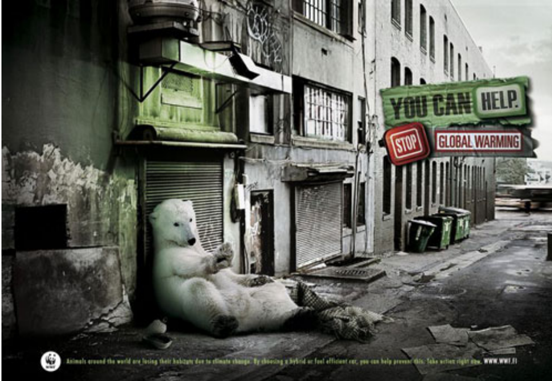
Kuva 7. Mainoskuva ilmaston lämpenemisestä.

Kuvassa 7 denotatiivisella tasolla ensimmäisenä huomio keskittyy jääkarhuun. Jääkarhu makoilee nuhjuisella ja likaisella kadulla, joka ei muistuta sen tyypillistä elinympäristöä. Kadulla näkyy muutama vihreä jätteastia ja jääkarhun ympärillä maassa on metallinen tyhjä säilykepurkki, viltti sekä kasa likaisia sanomalehtiä tai papereita. Kuvan oikeassa yläreunassa näkyy teksti, jossa lukee suomennettuna ”Sinä voit auttaa. Pysäytä ilmaston lämpeneminen”. Kuvan alareunassa näkyy WWF:n logo ja sen vieressä teksti, jossa sanotaan, kuinka ”eläimet ympäri maailmaa menettävät niiden elinympäristöjään ilmastonmuutoksen takia. Valitsemalla vähäpäästöisen tai hybridi-auton voit auttaa tämän estämisessä. Toimi nyt heti”. Tekstin perässä näkyy WWF:n verkko-osoite. Kuva on aikaisempiin mainoskuviin verrattuna todella yksityiskohtainen ja siinä näkyy useampia visuaalisia elementtejä.