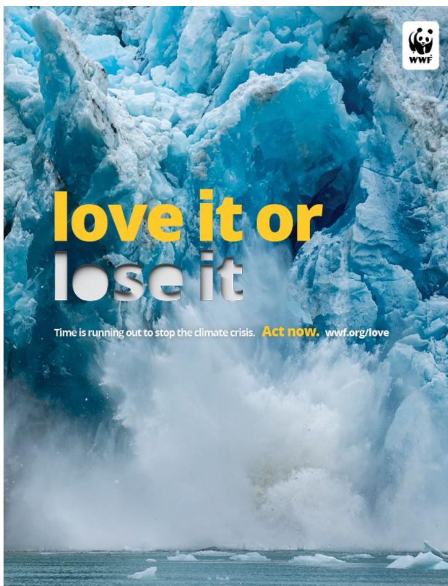
Kuva 8. Mainoskuva ilmaston lämpenemisestä.

väittämiä tieteellisinä faktoina. Ratkaisuiden esittäminen tarjoaa loogista tukea väittämille, kuten ”sinä voit auttaa pysäyttämään ilmaston lämpenemisen”. Eetoskeinoja on hyödynnetty suhteellisen vähän. Uskottavuus ja luotettavuus rakentuu pitkälti WWF:n pandalogon ja verkko-osoitteen avulla. WWF on suuri ja tunnettu ympäristöjärjestö, jonka logo ja verkko-osoite herättää luottamusta ja asiantuntijuutta ympäristöön liittyvässä viestinnässä.