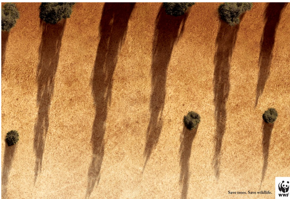
Kuva 6. Mainoskuva metsien suojelusta.

metsikkö ei välttämättä ole täysin realistinen, kuvassa esiintyvä metsien tuhoaminen on realistista ja oikeassa elämässä tapahtuvaa toimintaa. Kuvaa ei ole juurikaan liioiteltu, joka lisää sen uskottavuutta. Jos mainos olisi aito valokuva, se olisi entistä uskottavampi. Kuvassa on hyödynnetty mainokselle tyypillistä genrekonventiota eli syy-seuraussuhdetta. Jos et toimi nyt, pian voi olla liian myöhäistä. Kuvaa voisi vielä vahvistaa enemmän jonkinlaisella loogisella väitteellä tai tilastollisella tiedolla metsäkadon tilanteesta.