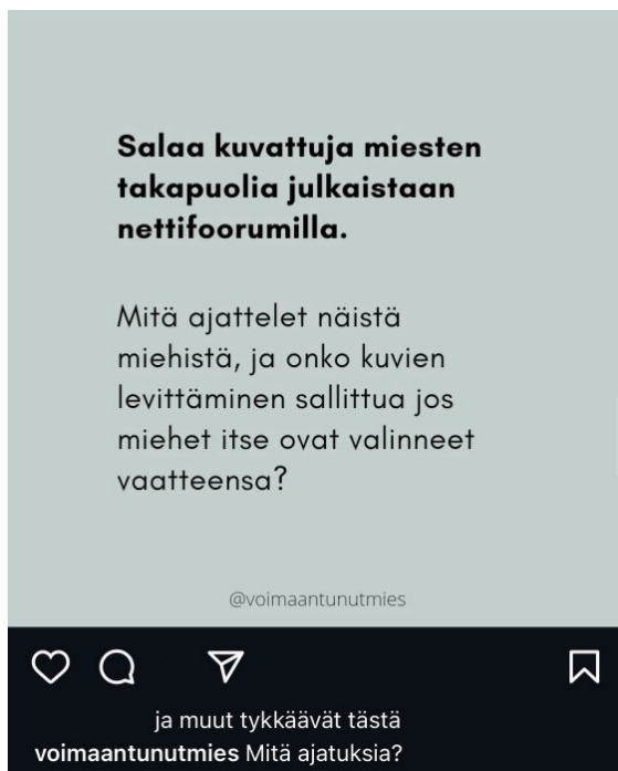
Kuva 8. Julkaisu 6. liittyen naisten salakuvaamiseen (@voimaantunutmies 28.6.2024).

Kuvan 8. julkaisussa 6. 28.6.2024 viittaa julkaisuajankohtana 28.6.2024 uutisoituun Ylilaudan salakuvaus -juttuun, jossa sivuston käyttäjät ovat ottaneet salaa kuvia naisten takapuolista julkisilla paikoilla ja jakaneet kuvat keskusteluihin. Keskusteluketjuissa on arvioitu naisten ulkonäköä ja jaettu vinkkejä, miten kuvata naisia niin, että he eivät varmasti huomaa. Julkaisussa irvaillaan jälleen uhrin syyllistämisen asenteilla ja pohditaan eri keinoja, joilla salakuvaus olisi voitu uhrien toimesta estää.