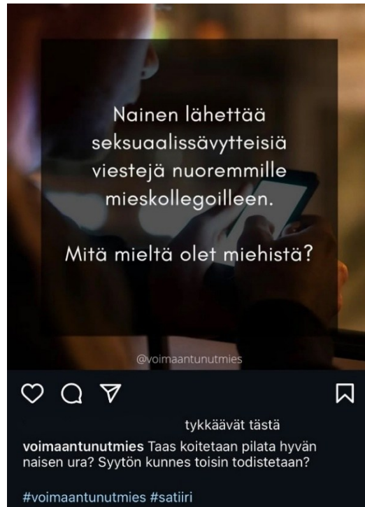
Kuva 3. Julkaisu 2. liittyen seksuaaliseen ahdisteluun (@voimaantunutmies, 10.11.2023).

Kuvan 3. julkaisussa 2. otetaan kantaa suostumuksettomien seksuaalisten tekojen tekijän vastuuseen toiminnastaan. Se liittyy tulkintani mukaan julkaisuajankohtana 10.11.2023 valtamediassa pinnalla olleeseen näyttelijä Aku Hirviniemen ahdisteluhuun, jossa tuotiin ilmi hänen väitetty vuosia jatkunut seksuaalinen ahdistelu muun muassa naiskollegoitaan kohtaan. Julkaisu pilailee raiskauskulttuurin ja erityisesti uhrin syyllistämisen asenteilla.