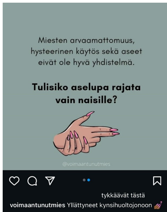
Kuva 7. Julkaisu 5. stereotypiasta naisista emotionaalisina (@voimaantunutmies 29.4.2024).