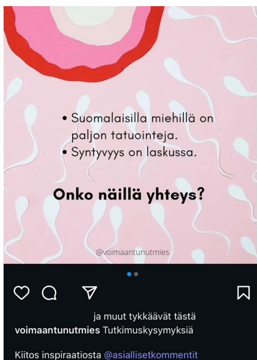
Kuva 9. Julkaisu 7. syntyvyyden laskun yhteydestä ulkonäköön (@voimaantunutmies 1.7.2024).

Julkaisu on hyvin tekstipainotteinen, ja itse kuva koostuu vain tekstistä ja valitusta vihervästä taustaväristä. Julkaisuteksti ”Mitä ajatuksia” tulkintani mukaan viittaa siihen, miten absurdia on, että asiasta joudutaan edes keskustelemaan, ikään kuin tilanteen syylliset eivät olisi tiedossa.