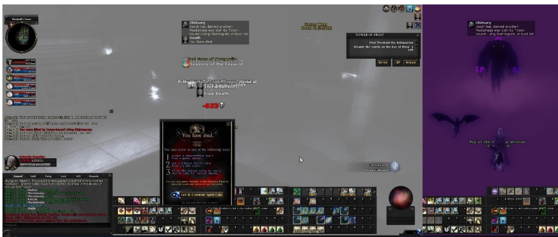
Kuva 1. Kuvakaappaus Hardcore-palvelimelta, jossa näkyy hetki, jolloin pelaajan hahmo kuolee sekä kuoleman jälkeinen olotila.

Hardcore-palvelimella pelaajilla on kaksi ylimääräistä motivaattoria etenemiselle ja tehtävien suorittamiselle: kosmeettiset palkinnot sekä tulostaululla kiipeäminen. Pelaaja voi saada kosmeettisia palkintoja, kuten varusteita ja ratsuja, suoritettuaan riittävän määrän tehtäviä samalla pelihahmolla. Palkintojen avulla saavutuksiaan voi esitellä toisille pelaajille ei-permadeath-palvelimilla sekä tulevilla Hardcore League -kausilla, mikä voi olla keino nostaa sosiaalista statustaan kanssapelaajien silmissä (Wang & Hang, 2021). Tulostauluja puolestaan on kaksi per kausi; yksinkertaistettuna, suurimman määrän tehtäviä suorittaneille ja eniten vaikeimmalla vaikeustasolla pelanneille. Kriteerinä listalla pysymiseen on myös, että pelihahmon täytyy olla hengissä kauden päättyessä. Menneiden kausien tulostauluja voi tarkastella sekä pelin sisällä että pelin verkkosivuilla. Permadeathin ja tulostaulun yhdistelmässä näkyy hyvin Kimin (2001) kuvaus digitaalisten olentojen kahdesta vastakkaisesta mahdollisuudesta: ikuisesta kestävydestä ja välittömästä kadotuksesta.