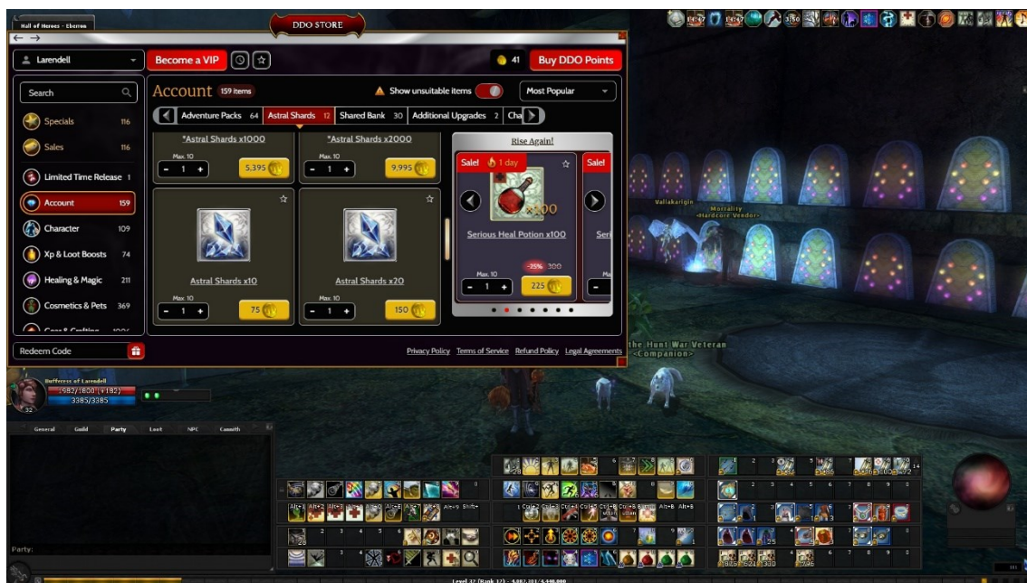
Kuva 2. Kuvakaappaus, jossa näkyy DDO Store vuoden 2023 visuaalisen päivityksen jäljiltä. Taustalla oikealla näkyy myös Hardcore League -kausien tulostaulut rivissä seinällä.

DP-valuuttaa on mahdollista kerryttää hitaasti pelaamalla peliä: jokainen onnistuneesti suoritettu tehtävä antaa vaikeustasosta ja pituudesta riippuen 2–42 suosiopistettä, ja pelihahmon kerrytettyä 100 suosiopistettä hän saa 25 DP:tä. Pelinsisäistä valuuttaa voi siis kerryttää poikkeuksellisen orgaanisesti pelaamalla peliä normaaliin tapaan. Pelkäättään peliä pelaamalla on toisin sanoen mahdollista ostaa DDO:n pelinsisäisestä kaupasta kaikki mieluisat tuotteet, mutta tähän tarvitaan pelaajan osalta hyvin merkittävä investointi pelin parissa käytetyn ajan suhteen, vaikka hän hyödyntäisi ahkerasti viikoittain vaihtuvia alennusmyyntejä.