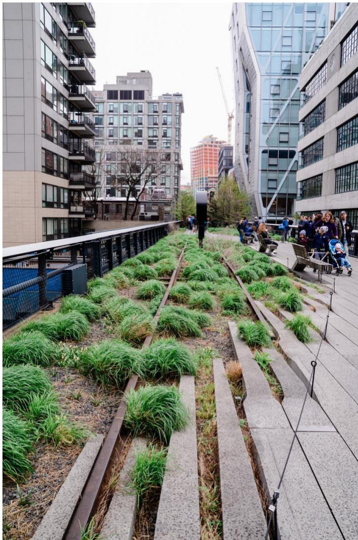
Kuva 2: High Line. (Pixaby).

uusien ja nykyaikaisten komponenttien kanssa, jolla on haettu harmonista ja visuaalisesti kiinnostavaa kokonaisuutta. (Rothenberg & Lang, 2017.)