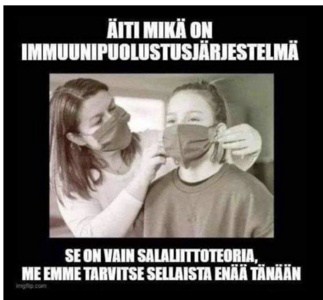
Kuva 7. Salaliittoteoria-meemi.

salaliittoteoreetikoita. Sen sijaan koronakriittiset pyrkivät horjuttamaan aineiston meemeissä maskeja käyttävien ja ne hyväksyvien ihmisten uskottavuutta, sekä koronakriittisiä salaliittoteoreetikoiksi kutsuvien väitteitä. Esimerkiksi Salaliittoteoria-meemissä (Kuva 7) rinnastetaan salaliittoteoriat yleisesti todeksi tiedettyyn immuunipuolustusjärjestelmän olemassaoloon, ja pyritään korostamaan, että koronakriittiset ovat oikeassa. Koronakriittisissä meemeissä ulkoryhmän jäsenet esitetään niin aivopestyinä, että uskovat tällaisten asioiden olevan salaliittoteorioita.