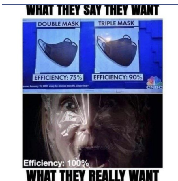
Kuva 11. Tukehduttavat maskit -meemi.

Tuhon ja alistamisen diskurssissa maskit symboloivat pääosin orjuutta, mutta äärimmillään symbolisen merkityksen voi tulkita olevan jopa kuolema. Symboliikka ulottuu laajemmin pahantahtoiseen salaliittoon sekä ihmisten tukahduttamista ja tuhoa tahtoviin valtaapitäviin viranomaisiin, poliitikkoihin ja mediaan. Esimerkiksi Tukehduttavat maskit -meemissä (Kuva 5), koronakriittiset vihjaavat maskin tehokkuuden tarkoittavan todellisuudessa kykyä estää ihmistä hengittämästä, mitä valtaapitävät haluavatkin.