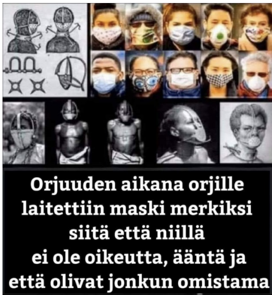
Kuva 5. Orjuus-meemi.

Tästä esimerkkinä Orjuus-meemi (Kuva 5). Tuhon ja alistamisen diskurssia tuottavissa meemeissä poliittisten johtajien ja median lopullisena päämääränä on koronakriittisten mukaan alistaa puhujan kaltaiset tavalliset kansalaiset. Siinä missä ulkoryhmä edustaa kontrollia, koronakriittiset muodostavat diskurssissa itselleen vapautta