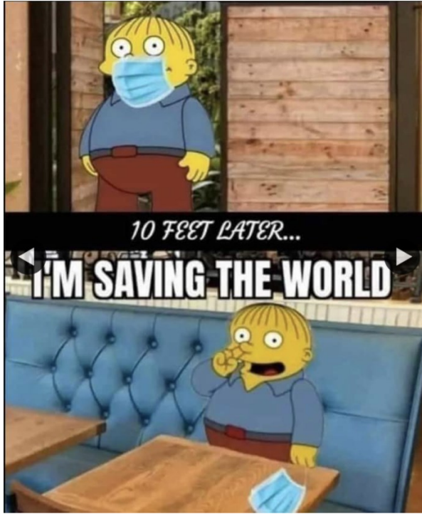
Kuva 3. Maailman pelastaja -meemi.

intertekstuaalisen viittauksen myötä meemi tuottaa myös joukkoharhan diskurssia, jota käsittelen alaluvussa 4.2.3.