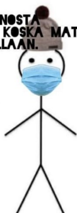
Kuva 4. Matti-meemi.

Aineiston meemeistä yksi kritisoi niitä, jotka eivät käytä maskia (Kuva 4). Käsittelen sen tässä luvussa, sillä siinä on samoja piirteitä kuin älykkyyden diskurssia tuottavissa mee- meissä. Matti-meemissä (Kuva 4) aivokuoren voimakas poimuttuminen viittaa aivojen suureen kapasiteettiin ja siten älykkyyteen. Meemissä kehoitetaan olemaan älykäs ja käyttämään maskia, eli toisin sanoen maskin käyttämättä jättäminen on tyhmää. Se vai- kuttaa tuottavan älykkyyden diskurssia, mutta positiot kääntyvät pääläelleen, ja ko- ronakriittiset ovat valtasuhteessa heikommassa asemassa. Sama diskurssi voi siis tuot- taa eri lopputulosta. Meemissä on lisäksi viittaus salaliittoteorioihin, joiden esiintymistä meemeissä käsittelen luvussa 4.4.