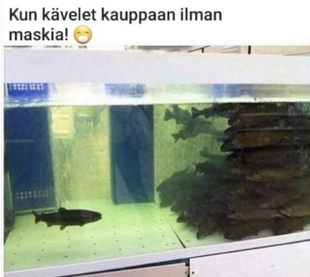
Kuva 10. Muiden syrjimä -meemi.

On tärkeää huomata, että vaikka esimerkiksi älykkyyden diskurssissa tuotetaan myös jakoa tavallisten kansalaisten kesken, se on siinä tulkintani mukaan sivujuonne. Jakautumisen diskurssissa ryhmien eriytymistä tuotetaan voimakkaasti, ja siten koronakriittisille tuotetaan myös toisenlaista identiteettiä.