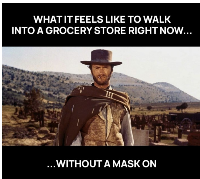
Kuva 9. Antisankari-meemi.

Diskurssissa kapinallisen identiteetissä on myös epävarmuutta. Meemeissä esitetään, että ulkoryhmä ottaa koronakriittiset jopa aggressiivisesti silmätikukseen. Koronakriittisen ryhmän edustaja on näiden meemien kuvissa yleensä yksin, kun taas muut meemissä ollessaan esitetään joukkona tai parina (ks. Kuva 10). Maskia pitävät positioidaan syrjiviksi eli valta-asemaan koronakriittisiin nähden.