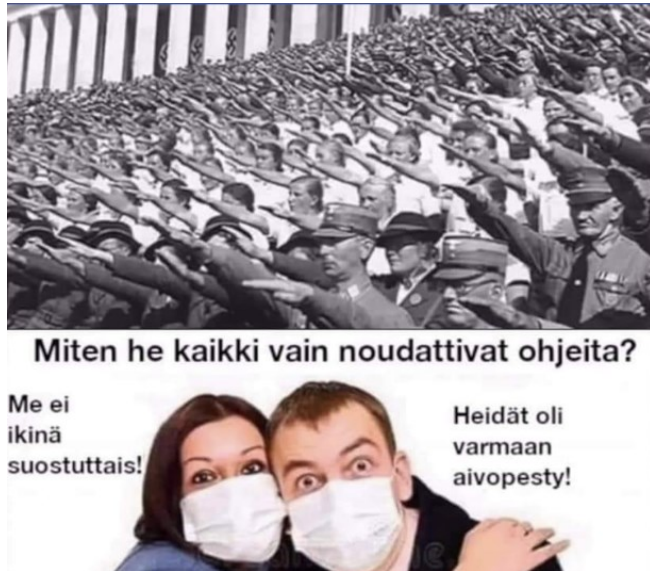
Kuva 8. Natsivertaus-meemi.

identiteettiä, sillä aivopesuun tai joukkoharhaan vedoten he voivat aina todeta olevansa oikeassa.