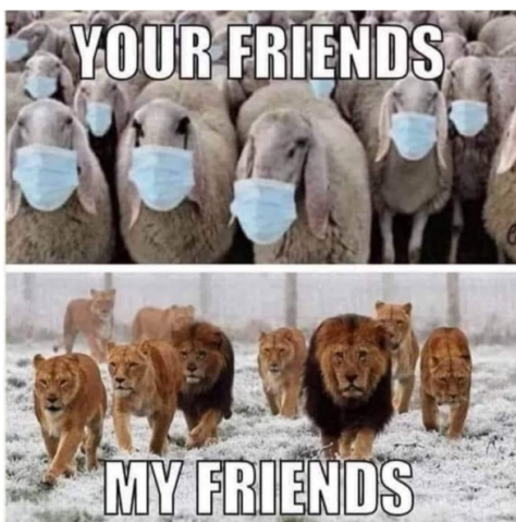
Kuva 1. Esimerkki Koronakapina-ryhmässä jaetuista meemeistä.

Tutkimukseen valitut Koronakapina, Korona- ja rokotuskriittiset sekä Korona Great Reset -Facebook-ryhmät täyttivät seuraavat määrittelemäni kriteerit: ryhmä on tai oli aineistonkeruun aloitushetkellä julkinen, suomenkielinen ja kuvailunsa mukaan koronan tai koronaan liittyvän tiedon kyseenalaistava, minkä lisäksi ryhmään kuului vähintään satoja henkilöitä ja julkaisuja tehtiin useita päivässä. Tutkittavana on ainoastaan kuva meemistä, eli aineistoon eivät sisälly meemin ohessa olevat Facebook-julkaisun tekstit, reaktiot tai kommentit. Valinnalla on vaikutusta analyysini lopputulokseen, enkä voi esimerkiksi päätellä onko meemin jakaja samaa vai eri mieltä meemin sisällön tai ryhmästä muodostuvan kuvauksen kanssa. Tämä ei kuitenkaan ole tutkimuksen tavoitteen saavuttamisen kannalta haitallista, sillä meemit itsessään ovat merkittäviä ja vaikutusvaltaisia sisältökokonaisuuksia, jotka voivat liikkua eri alustoilla täysin irrallisenakin.