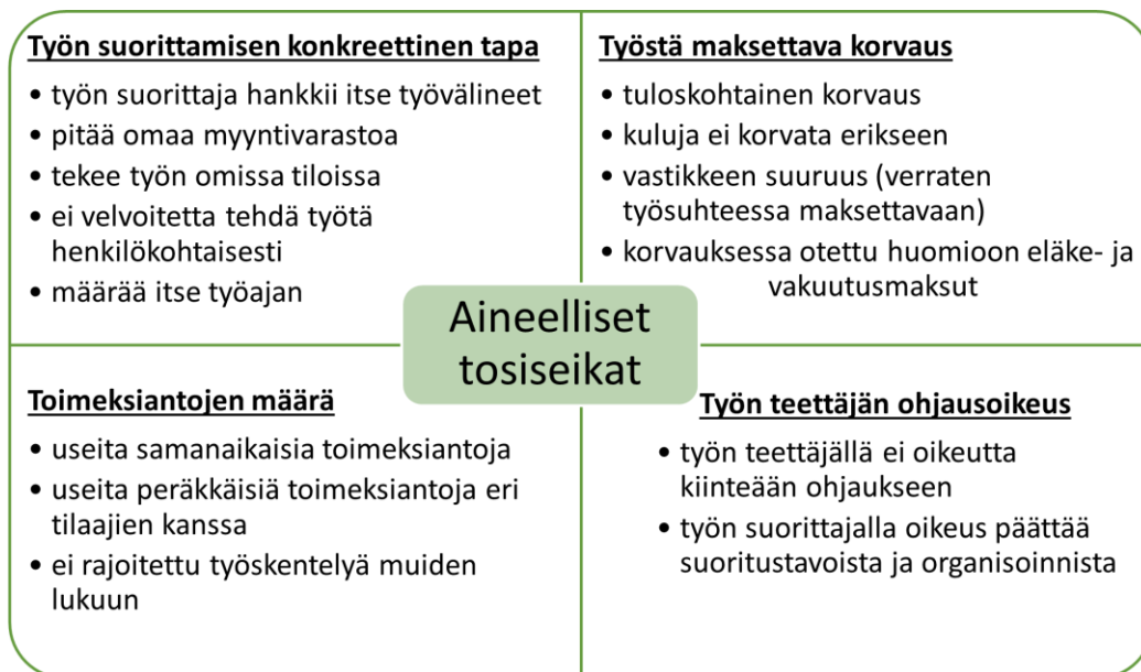
Kuvio 1. Yrittäjyyden aineelliset tosiseikat. 146

Yrittäjyyden aineelliset tosiseikat ovat oikeussuhteen luonteen arvioinnissa suurem- massa asemassa kuin muodolliset tosiseikat 147 . Yrittäjyyden muodollisina tunnuspiir- teinä voidaan puolestaan pitää esimerkiksi yrittäjävakuutusta, elinkeinoluvan hankki- mista, verotuskäytäntöä sekä toiminnan harjoittamista yhtiömuodossa. Muodolliset tosiseikat on koottu kuvioon 2.