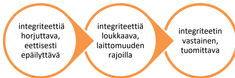
Kuvio 1. Integriteetin loukkausten kolme vaihetta

Integriteetin loukkausten kehitystä voidaan kuvata vaiheittain, kuten horjuttavasta ja eettisesti epäilyttävästä kohti integriteetin vastaista ja tuomittavaa. Integriteetti on rajakäsite epäeettisen ja moitittavan sekä moitittavan ja tuomittavan välillä. Tätä selvennetään kuviossa 1.