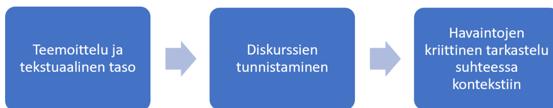
Kuvio 1. Menetelmän vaiheet.