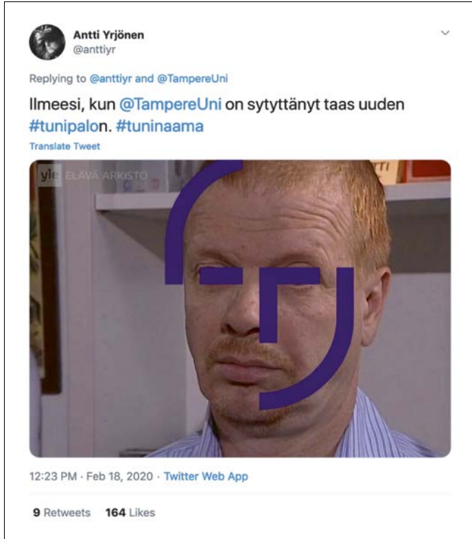
Kuva 1. Tuninaama- ja tunipalo-tunnisteen yhdistävä kriittinen twiitti (Yrjönen 2020).

Pöhinäretoriikasta syntyy kiinnostavalla tavalla myös työvälina kriittiselle yleisölle sekä keino delegitimoida Tampereen yliopiston uutta brändiviestintää ja organisatiota parodian kautta. Erityisesti Kauppalehden jutussa käytetty tulipalometafora ja siitä väännöksenä syntynyt tunipalo jää elämään verkkokeskusteluissa (ks. myös Piata 2016). Tuli- tai tunipalojen syöttämisestä rajapinnoille muodostuu metafora, jolla Twitter-keskusteluissa viitataan alkuperäisen innovaatio toiminnan asemesta Tampereen yliopiston viestinnällisiin epäonnistumisiin (ks. kuva 1).