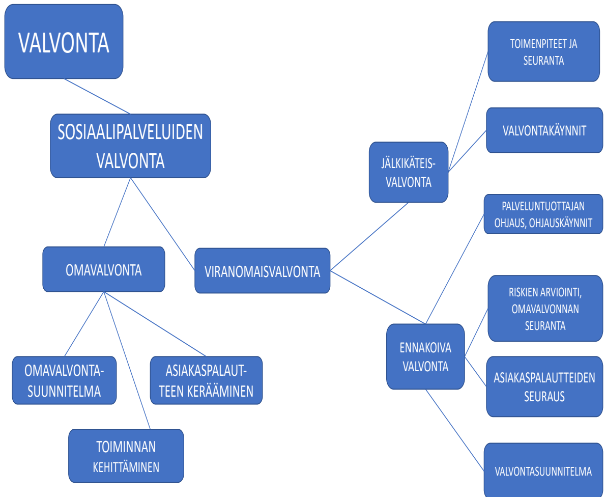
Kuvio 1. Valvonnan käsite.

Sosiaalipalveluiden valvonnan kansainvälinen vertailu kuntatasolla on haastavaa erilaisten palvelujärjestelmien ja valvontakäytänteiden vuoksi. Yleisellä tasolla valvontajärjestelmiä voidaan kuitenkin vertailla, sillä kansalliset ohjaus- ja valvontajärjestelmät eivät Nykäsen ym. (2016) mukaan ole palvelujärjestelmästä riippuvaisia. Vuonna 2016 valmis- tuneessa Vaikuttava valvonta osana sosiaali- ja terveydenhuollon uudistusta -selvityk- sessä on tarkasteltu terveyspalveluiden valvontaa seitsemässä Euroopan maassa. Näi- den maiden järjestelmissä on jonkin verran samankaltaisuutta suomalaisten järjestel- män kanssa. Suomessa, Norjassa, Ruotsissa ja Englannissa sosiaali- ja terveyspalveluita valvoo ylimpänä sama viranomainen, kun taas Tanskassa, Skotlannissa ja Walesissa