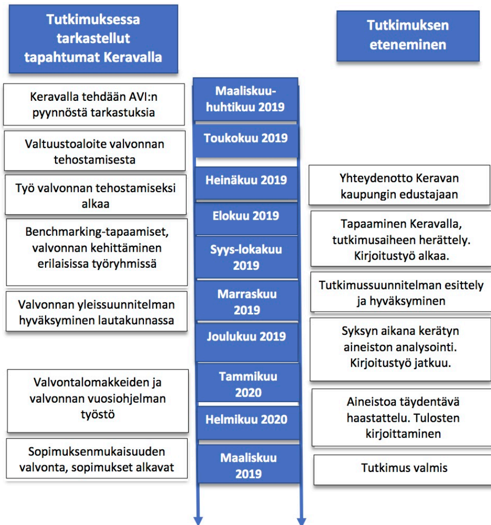
Kuvio 3. Aikajana tapahtumista

tutkimuksessa myös tilaaja-tuottaja-suhteen vaikutuksia valvonnan järjestämiseen ja toteuttamiseen. Jotta tapauksesta saadaan mahdollisimman kokonaisvaltainen kuva, sivutaan tutkimuksessa Keravan kaupungin osalta myös kilpailutukseen liittyvää materiaalia. Kuviossa 3 on esitetty tämän tutkimuksen etenemistä vieretysten Keravan kaupungilla tehdyn työn kanssa. Tutkimuksessa tarkastellaan tapahtumia ja aineistoa Keravan kaupungin valvonnan kehittämisestä maaliskuusta 2019 alkaen. Ennen tutkimusprosessin alkua ajoittuvan ajan aineisto muodostuu vain kirjallisesta materiaalista. Syksyllä 2019 tutkimukseen tulee mukaan myös tapahtumien ja työskentelyn havainnointi.